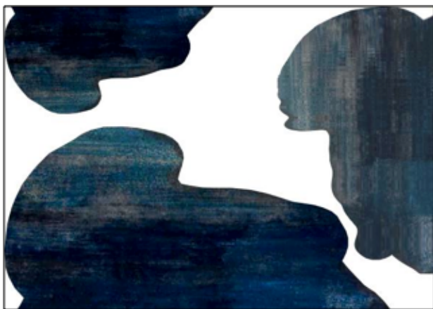
Papiers gouachés extraits d'éléments transformés de l'album