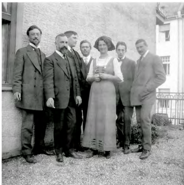
Les membres du Blaue Reiter.