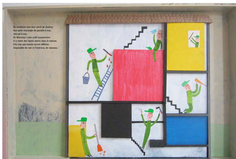
Le jeu des différences et des ressemblances.