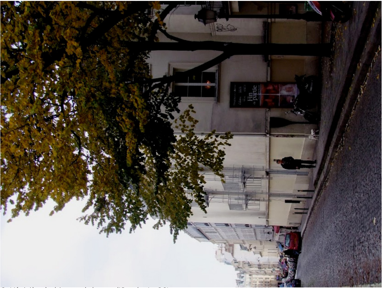
2. L'épicière à chignon de la rue d'Orsel... (p. 38)