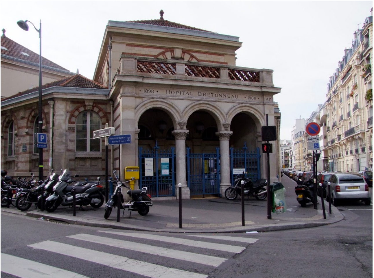
4. L'hôpital Bretonneau, je savais qu'il se trouvait dans le bas de la rue Damrémont... (p. 57)