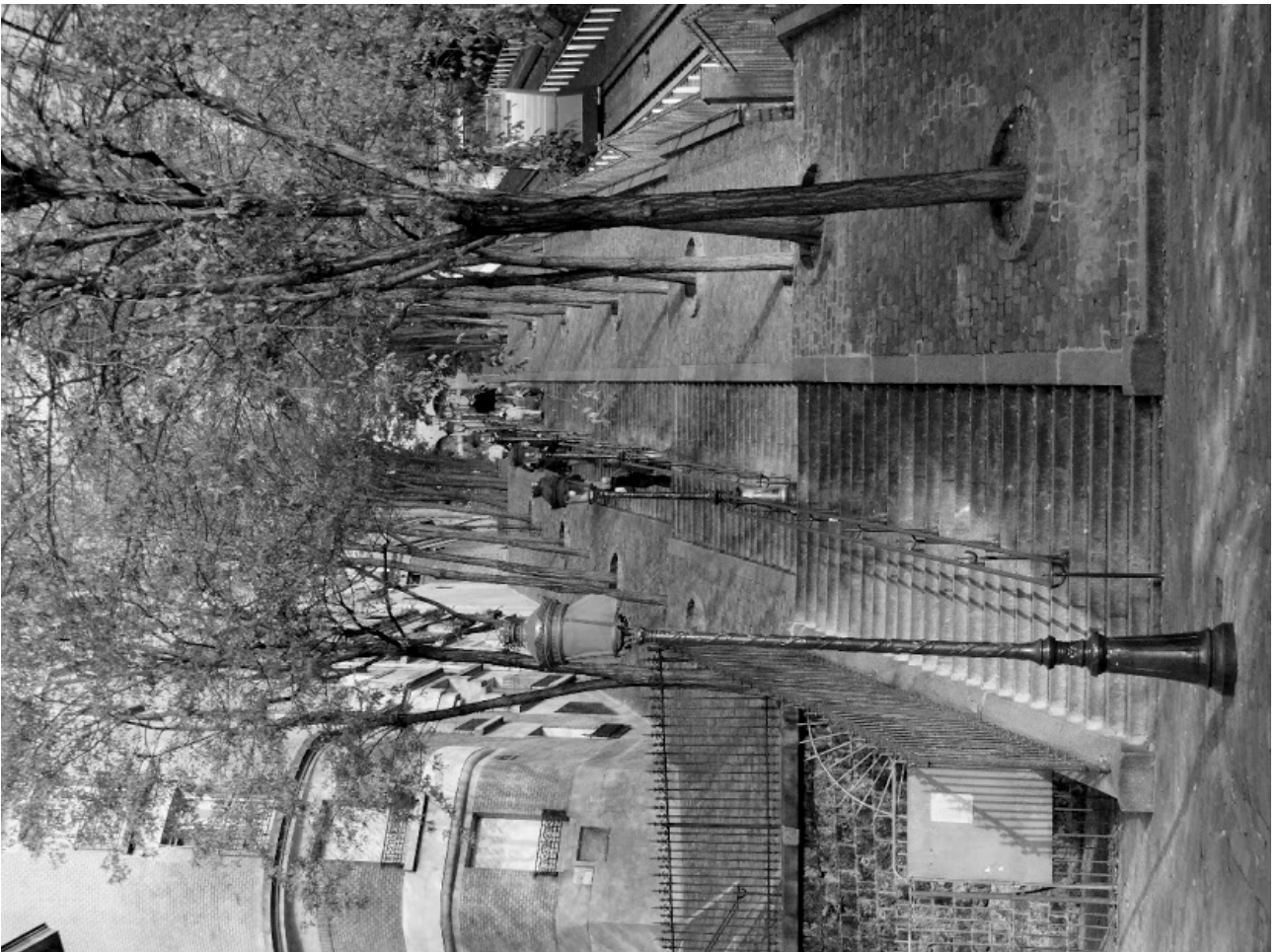
3. La rampe en fer des escaliers de la rue Foyatier... (p. 38)