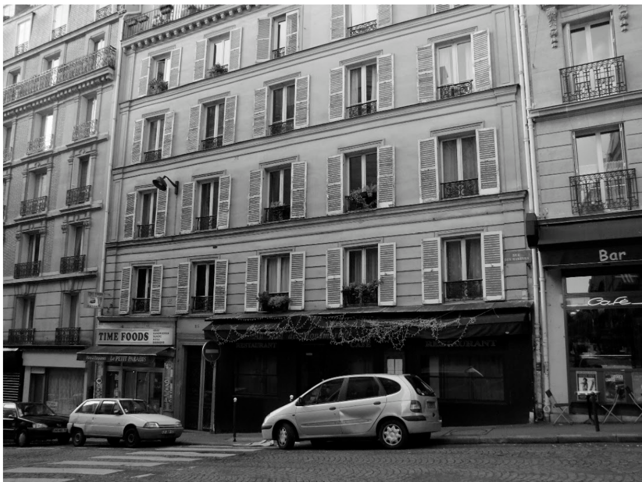
1. Rue des Martyrs, une rue raide pentue... (p. 37)