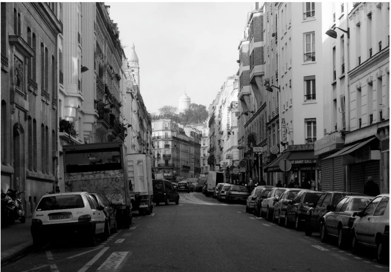
5. ... nous accompagnions mon père à la Schule, la synagogue de la rue Doudeauville... (p. 65)