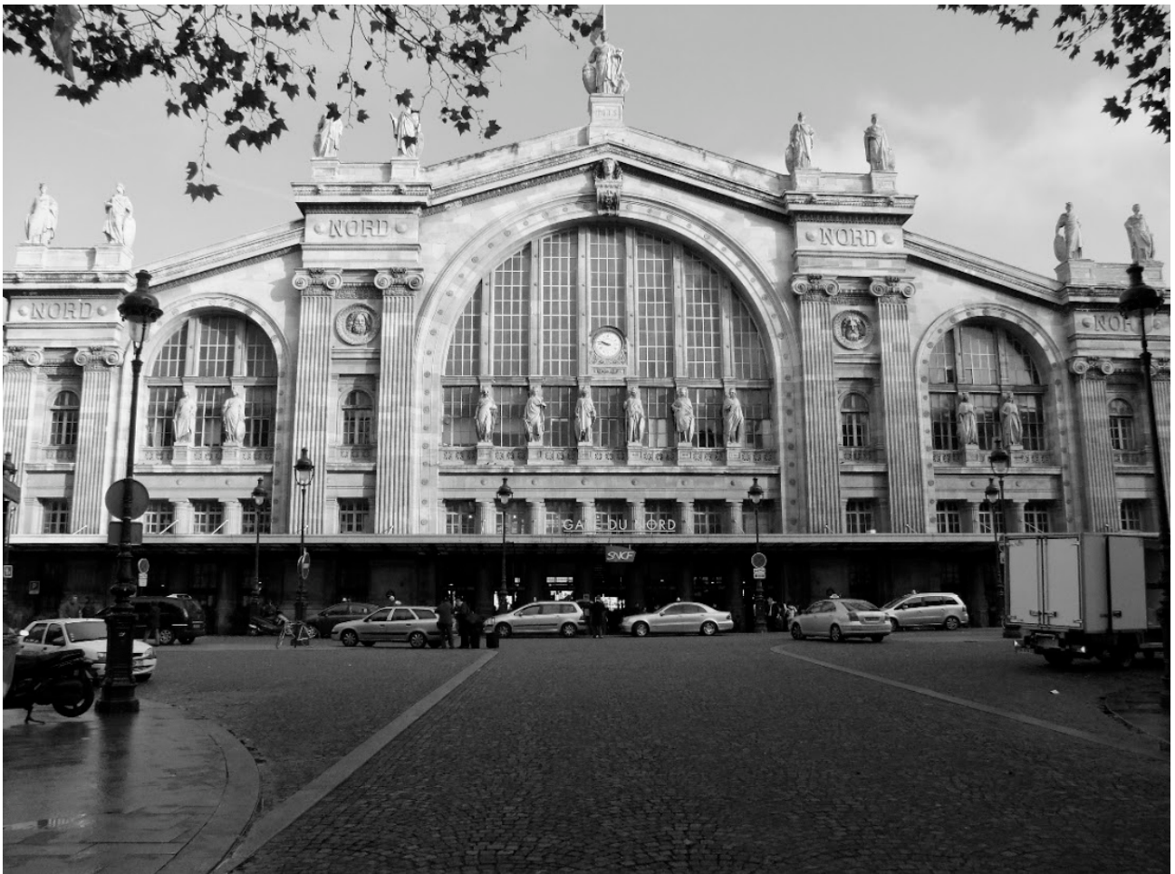
10. La gare du Nord était terriblement vert-de-gris... (p. 170)