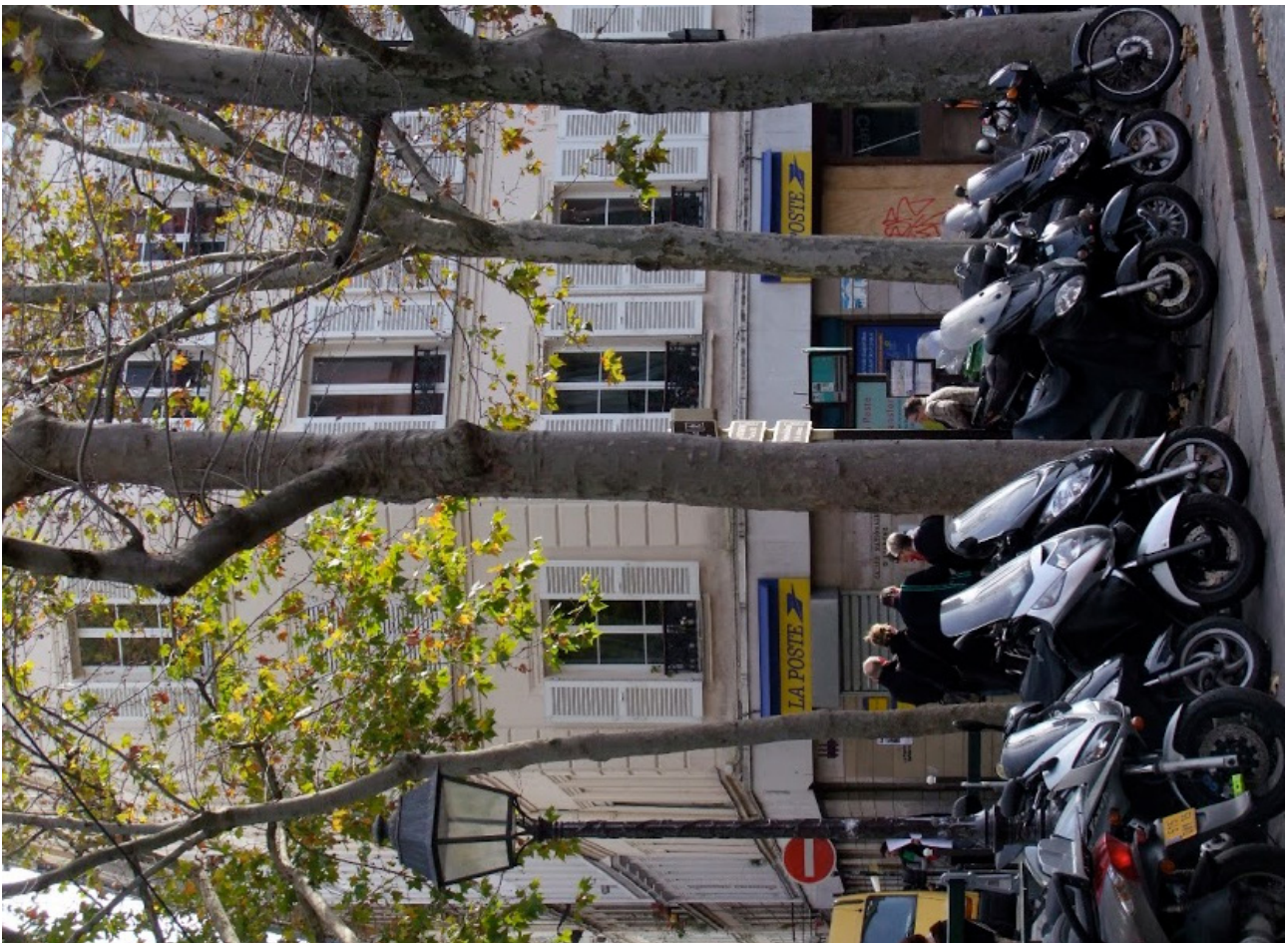
7. Le cortège... dévale les cahots de la butte et le Reichsführer peut visiter les rues et les ruelles du «vrai Paris, ja !»... le terre-plein des Abesses. (p. 99)