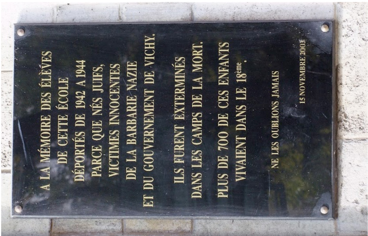
6. Nous avons quitté la communale de la rue Foyatier pour l'école Lucien-de-Hirsch... (p. 73)