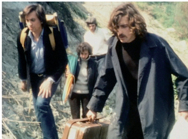
Je suis un autarcique