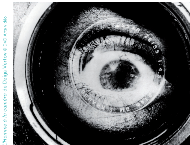
L'Homme à la caméra de Dziga Vertov

Si le premier film de l'histoire du cinéma n'est pas un film dans le film, il organise bien une sorte de mise en abyme dont la visée était avant tout publicitaire – faire la promotion de l'entreprise Lumière. Les trois versions 1 de La Sortie de l'usine Lumière à Lyon (1895) inaugurent en tout cas un art centripète ayant fortement tendance à retourner la caméra vers lui-même, pour se représenter, se mettre en scène, interroger sa nature. Bien entendu, on ne prétend pas ici établir un historique de cette (très vaste) question, mais seulement en cerner quelques jalons et problématiques.