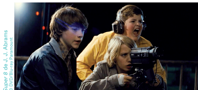
Super 8 de J. J. Abrams

Le cinéma moderne européen qui s'annonce dans les années 1950 se signale par ses ruptures avec l'homogénéité du cinéma classique, pour mettre en œuvre des formes réflexives, parmi lesquelles la mise en abyme figure en bonne place. Par exemple en rompant avec le pacte fictionnel par l'usage du regard-caméra qui force le spectateur à se rappeler qu'il est en présence d'une représentation – parmi les plus célèbres citons Un été avec Monika (1953) d'Ingmar Bergman, Les 400 coups (1959) de François Truffaut, et de nombreux films de Jean-Luc Godard ( À bout de souffle , Pierrot le fou ...). Ce dernier réalise en 1963 Le Mépris , vertigineuse déconstruction d'un couple et du cinéma prenant place durant le tournage en Italie de L'Odyssée par Fritz Lang, qui joue pour l'occasion son propre rôle. Godard s'attribue le rôle de l'assistant de Lang, une façon pour lui de s'inscrire comme un moderne dans la lignée des classiques. François Truffaut signe quant à lui en 1973 La Nuit américaine (1973), récit d'un tournage agité où le cinéaste interprète Ferrand, le réalisateur du film dans le film intitulé Je vous présente Pamela . La scène d'ouverture, où l'on croit rentrer dans le film avant que ne retentisse le «Coupez!» dévoilant l'artifice cinématographique, fait fortement penser au début de Mia madre .