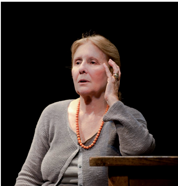
Giulia Lazzarini

«En ce qui concerne la première personne, ce film est un retour en arrière et une évolution de mes films de journal intime, c'est-à-dire Journal intime et Aprile . C'est pour le moment (pour ces premières quarante années...) le seul moyen que je connais de faire du cinéma.» 1 Alors que La Chambre du fils (2001) est hanté par la terreur d'un père vis-à-vis de la possibilité de perdre un enfant, Nanni Moretti est frappé personnellement par la mort lorsqu'il réalise Habemus papam , film sur la vieillesse, l'effacement et la renaissance. C'est en effet pendant ce tournage que sa mère tombe gravement malade, avant de décéder. Mia madre découle ainsi davantage de l'autobiographie directe, non sous la forme du film-journal mais d'une adaptation d'un épisode de son existence: «La mort d'une mère est une étape importante de la vie, et je voulais la raconter sans sadisme vis-à-vis des spectateurs.» 2