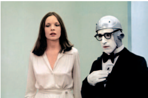
Woody et les Robots (1973) – Rollins-Joffe Productions.