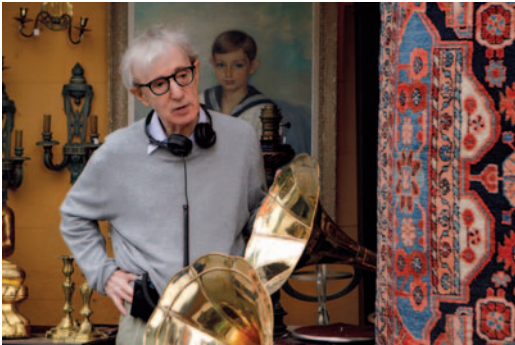
Woody Allen sur le tournage de Midnight in Paris (2010) – Coll. Cahiers du cinéma.