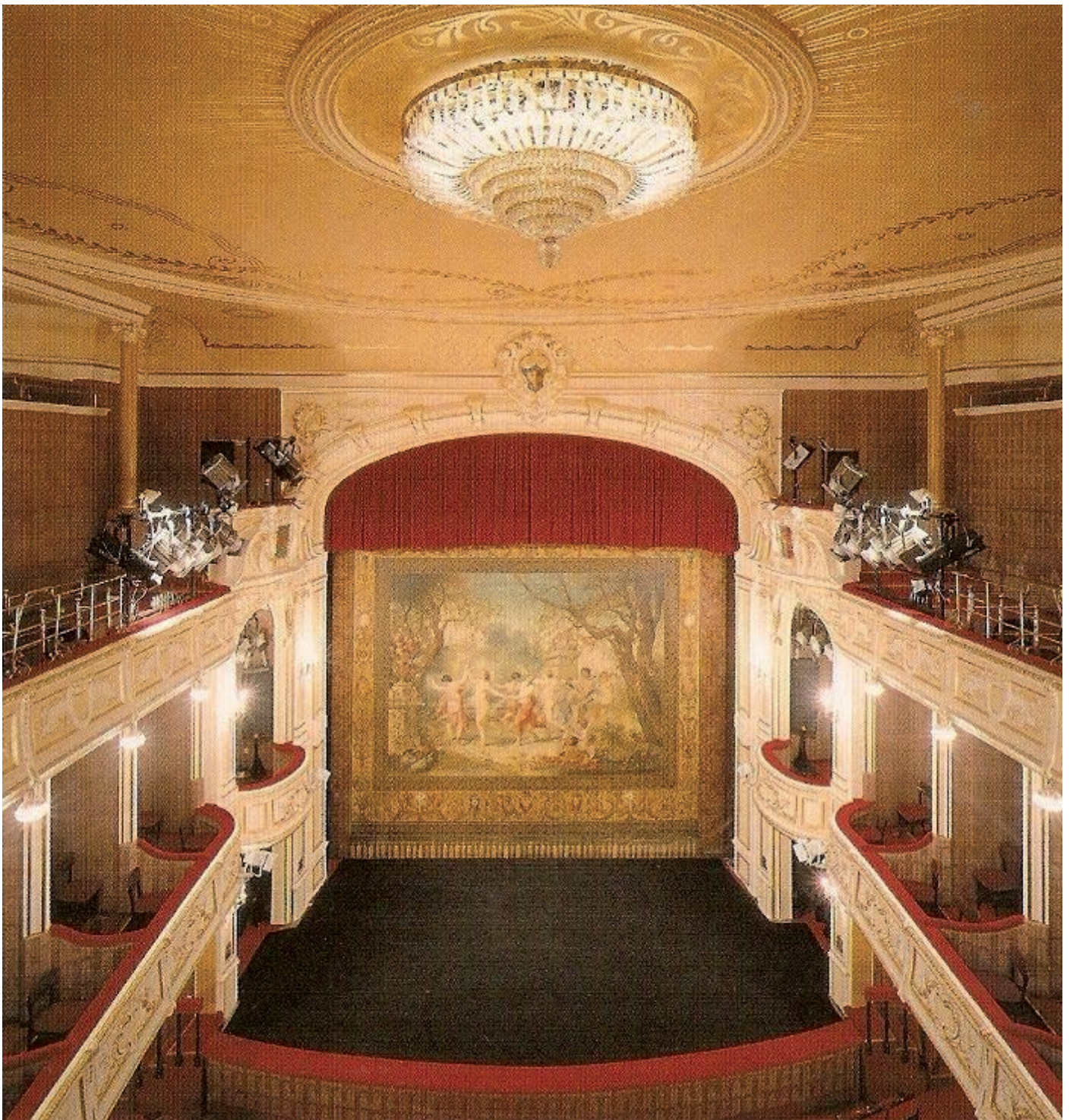
Placer sur la photo (flèches) : scène, plateau, côté cour, côté jardin, rideaux, coulisses