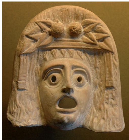
Figure décorative d'un masque de théâtre représentant Dionysos, terre cuite de Myrina, Musée du Louvre - CC