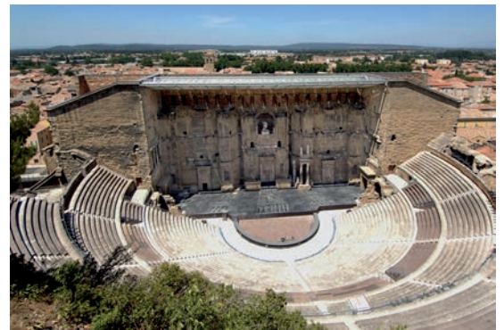
CC - Théâtre d'Orange

Le théâtre romain : il est construit au cœur des villes. D'abord en bois, il sera ensuite construit en pierre. La scène est fermée à l'arrière par un haut mur et l'orchestre ne forme plus qu'un demi-cercle. Des machines de plus en plus perfectionnées permettent d'offrir des effets spéciaux dont le public raffole. Ici le théâtre antique d'Orange.