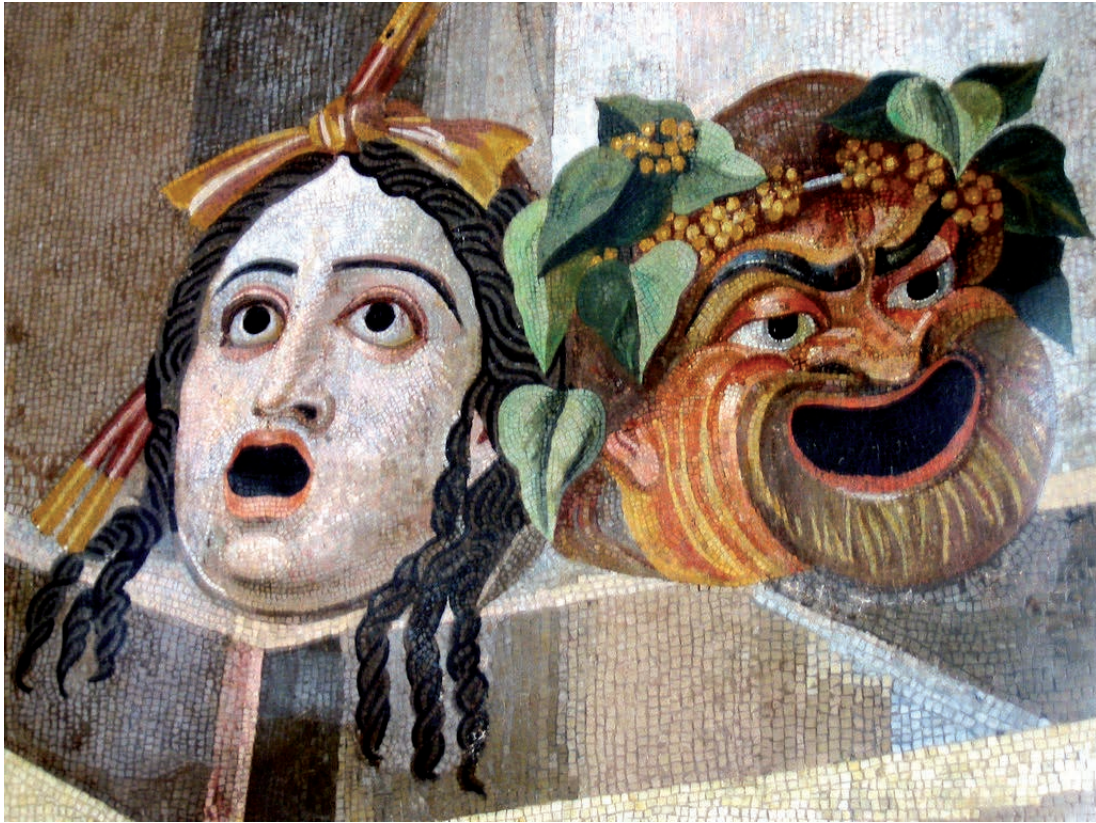
Les masques de théâtre antique - CC