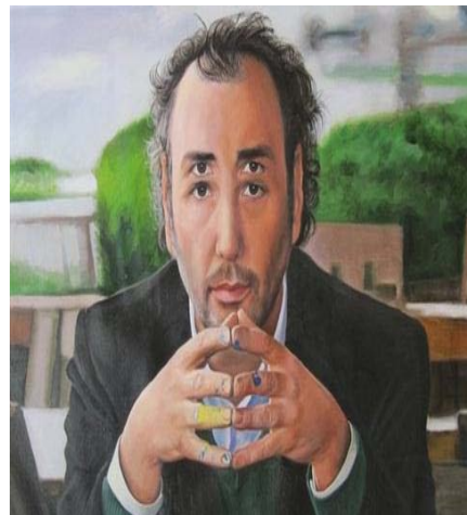
Genco Gülan, Artist with four Eyes. 2011. Oil on Canvas. 100cm * 70cm