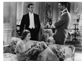
Cette sacrée vérité de Leo McCarey (1937)