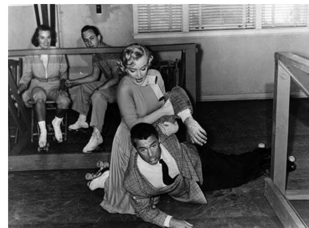
Chérie, je me sens rajeunir de Howard Hawks (1952)

En tête d'affiche de L'Impossible Monsieur Bébé , on trouve un couple d'acteurs emblématiques de l'âge d'or du cinéma américain. Comment, en effet, imaginer celui-ci sans Cary Grant ? En près de 34 ans de carrière et plus de 85 films, dont des dizaines de chefs-d'œuvre avec les plus grands réalisateurs de son époque, l'acteur s'est imposé comme une figure à ce point indissociable de l'ère classique qu'il semble littéralement incrusté dans son A.D.N. Quant à Katharine Hepburn, elle fut sans doute l'actrice la plus originale et la plus moderne à laquelle Hollywood ait jamais donné naissance. Elle lui fit don d'une vivacité extraordinaire et sut jouer d'un physique singulier qui bouscula les standards de la féminité à l'écran. Réuni à quatre reprises entre 1935 et 1940, dont trois fois pour George Cukor, le duo témoigne d'une complicité que Grant résumera ainsi : « Nous étions fous tous les deux. » 1