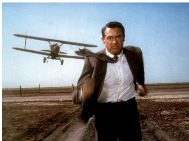
La Mort aux trousses d'Alfred Hitchcock (1959) – MGM.