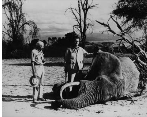
Howard Hawks et John Wayne sur le tournage de Hatari (1962)