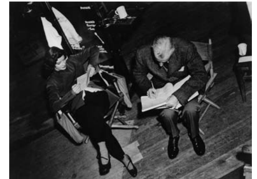
Katharine Hepburn et Howard Hawks pendant le tournage de L'Impossible Monsieur Bébé

Certaines productions naissent sous d'excellents auspices ; c'est le cas de celle-ci, baptisée dès le berceau par la tendre histoire d'amour qui éclot entre Wilde et Nichols et les amènera à rédiger ensemble, pour Fred Astaire et Ginger Rogers, le délicieux Amanda (1938) de Mark Sandrich. Une grande part de leur relation amoureuse se reflète dans celle qu'ils inventent pour leurs personnages. L'écriture suit son cours dans une joie communicative, et les différentes versions du scénario se succèdent, émaillées de notes espiègles qui respirent le bonheur. Soulignant tel accroc dans la continuité, le duo écrit : « Le bruit hors champ que vous entendez est celui de deux scénaristes malades de ne pas savoir ce que David et Susan ont fait depuis la tombée du jour. » Et, pour conclure : « On imagine qu'il devrait l'embrasser – il ne l'a pas fait depuis 10 000 pieds de pellicule – donc il l'embrasse et nous FONDONS AU NOIR. » Dès le départ, Hawks et ses scénaristes sont tombés d'accord sur une même vision du film, compris comme un hommage au cinéma burlesque. Il y eut même, dans les premières versions du scénario, une scène de combat avec tartes à la crème.