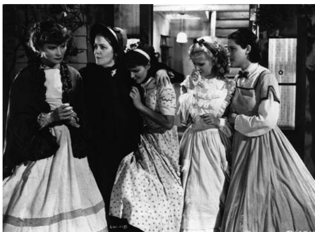
Les Quatre Filles du docteur March de George Cukor (1933)