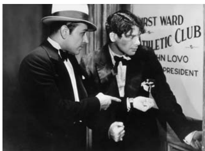
Scarface (1930)