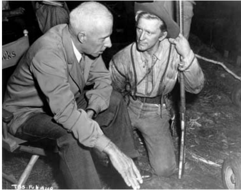
Howard Hawks et Kirk Douglas sur le tournage de La Captive aux yeux clairs (1952)