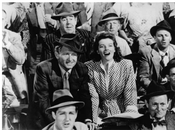
La Femme de l'année de George Stevens (1942)