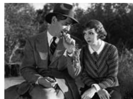
New York Miami de Frank Capra (1934) – Columbia/Coll. CDC.