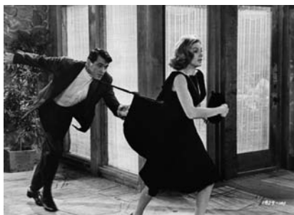
Le Sport favori de l'homme (1964) – Universal/Coll. CDC.