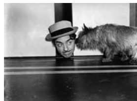
L'Introuvable de W.S. Van Dyke (1934)