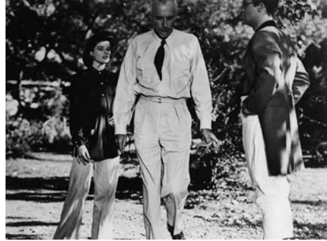
Tournage du film – Turner/Coll. CDC.