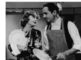
Mon homme Godfrey de Gregory La Cava (1936) – Columbia/Coll. CDC.