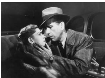
Le Grand Sommeil (1946)