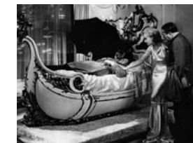
Train de luxe de Howard Hawks (1934) – Columbia/Coll. CDC.

L'Impossible Monsieur Bébé offre l'un des exemples les plus célèbres, en tout cas parfaitement canonique, de ce que fut la screwball comedy , dite aussi « comédie loufoque », sous-genre de la comédie hollywoodienne qui prit son essor avec la mise en application dans les studios de l'autocensure du code Hays, qui régna pendant près de dix ans (1934-1943) sur les écrans américains. Au départ, le terme screwball vient de l'univers du sport anglo-saxon, notamment des sports de balle, comme le base-ball. Il désigne une technique particulière de feinte qui, par torsion, produit un effet trompeur dans la trajectoire d'une balle. Dans les années 1920-1930, le mot se répand comme une traînée de poudre par l'intermédiaire du journalisme sportif. Cette origine de l'expression annonce les caractéristiques cruciales des screwball comedies , à savoir leur vitesse inhabituelle et l'excentricité des comportements qu'elles mettent en scène.