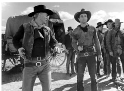
La Rivière rouge (1948)