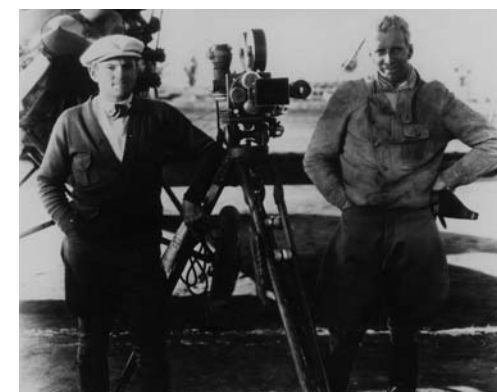
Howard Hawks (à droite) sur le tournage de La Patrouille de l'aube (1930)