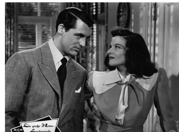
Indiscrétions de George Cukor (1940)

d'une certaine misogynie, mais il n'est pas interdit de faire résonner ces choix de carrière avec la bisexualité supposée de Cary Grant, qui, au-delà de ses quatre mariages officiels, vécut pendant douze ans avec l'acteur Randolph Scott et parvint, en ayant toujours contesté ces rumeurs, à traduire à l'écran cette division de l'être entre public et privé à laquelle assujettissait le star system américain.