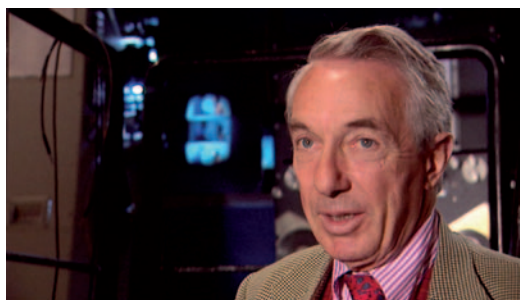
Philippe de Broca.