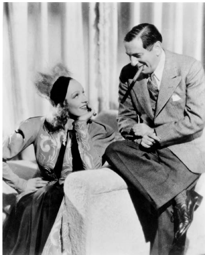
Marlene Dietrich et Ernst Lubitsch sur le tournage d' Ange en 1937

Une fois que le principe général de la scène était trouvé, les dialogues étaient travaillés de la même façon. Dans le premier film que nous avons fait avec lui ( La Huitième Femme de Barbe-bleue en 1938, ndlr), il y avait une scène où Claudette Colbert devait dire quelque chose de cinglant à Gary Cooper et plonger dans la mer, d'un radeau. Chaque fois que l'on arrivait à cet endroit, Ernst allait dans le même coin de la pièce où nous travaillions. «Alors Claudette dit...», énonçait-il en ménageant un blanc et un énorme point d'interrogation, «...et plonge gracieusement». Il joignait alors les mains et plongeait dans son coin. Puis il se tournait vers