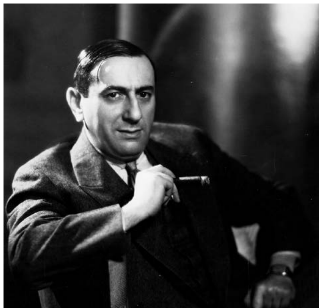
Portrait d'Ernst Lubitsch dans les années 1930

Il se spécialise ensuite dans la comédie sophistiquée (ou sex comedy ) et s'intègre si bien à la méthode des studios