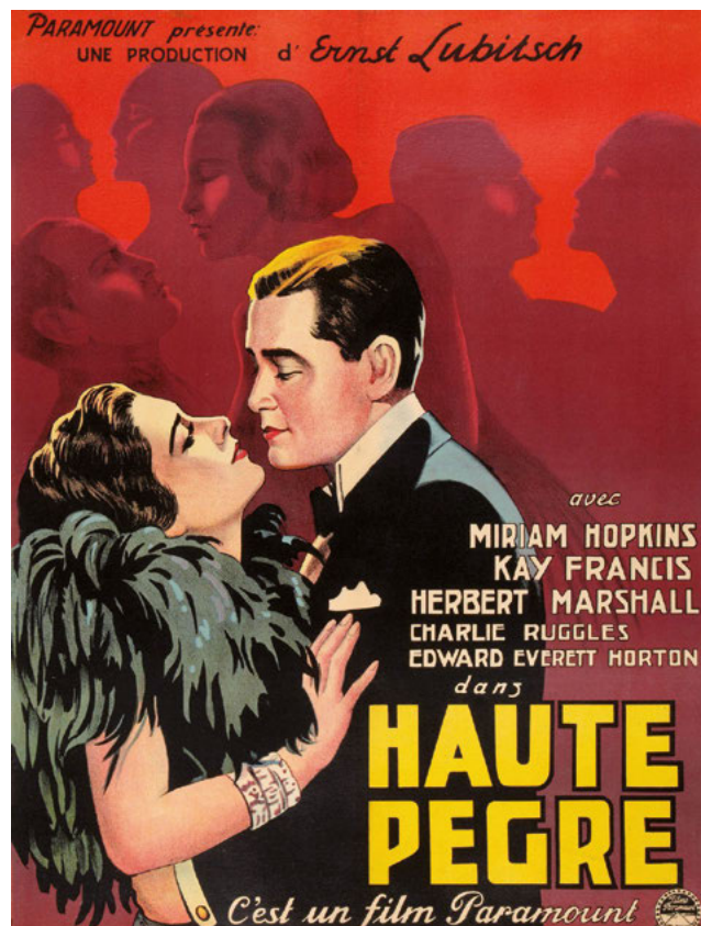
Affiche, 1932 © Paramount Pictures/Splendor Films