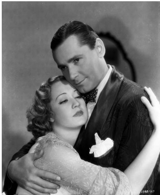
Photographie de tournage, 1932

le jeu qui s'établit entre maîtres et valets chez le dramaturge français. Face à la Grande Dépression, la comédie sophistiquée choque parfois par ses thèmes légers et les modes de vie fastueux qu'elle dépeint. Lubitsch dira au moment de son passage à la MGM en 1939 qu'il ne peut plus se permettre de mettre en scène des personnages dont on ne sait pas comment ils gagnent leur vie.