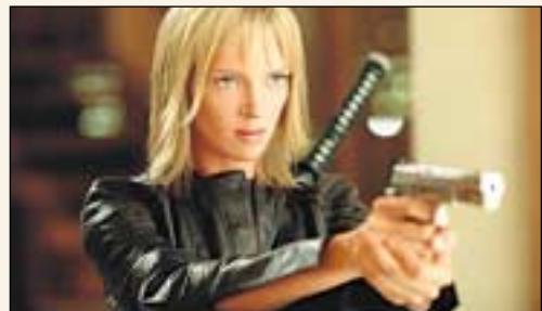
KILL BILL II

Brian De Palma (1976) ou Star Wars de George Lucas (1977) ne sont que quelques-uns des très nombreux exemples du succès d'un thème dont l'efficacité dramatique n'est pas à démontrer. Pourtant, peu de réalisateurs ont, à l'instar de Fritz Lang, souhaité faire de la vengeance elle-même l'objet de leur réflexion. On retiendra malgré tout l'unique film de Marlon Brando, La Vengeance aux deux visages (1961), ainsi que le spectaculaire et violent film du Coréen Park Chan-wook, Old Boy (2004), qui reprend avec brio le thème de la « vengeance de la vengeance » tout en revendiquant sa lointaine parenté avec l'archétype littéraire que constitue Le Comte de Monte-Cristo d'Alexandre Dumas.