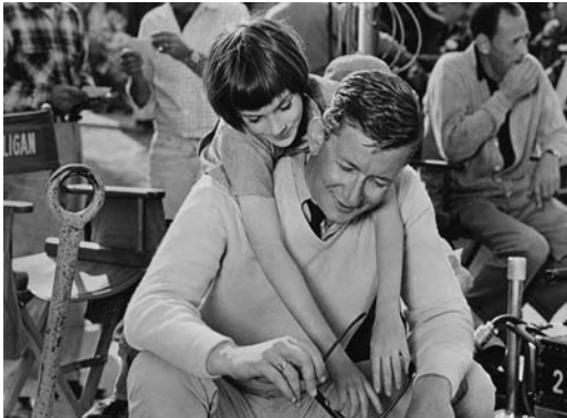
Robert Mulligan et Mary Badham (tournage).