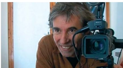
Jacques Doillon, rencontre avec Mathieu Kassovitz