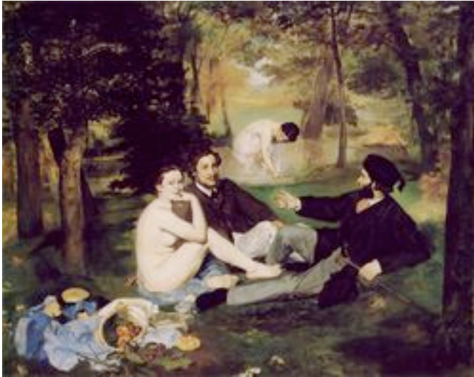
Le déjeuner sur l'herbe

Ce tableau de Manet est exposé au musée d'Orsay, à Paris.