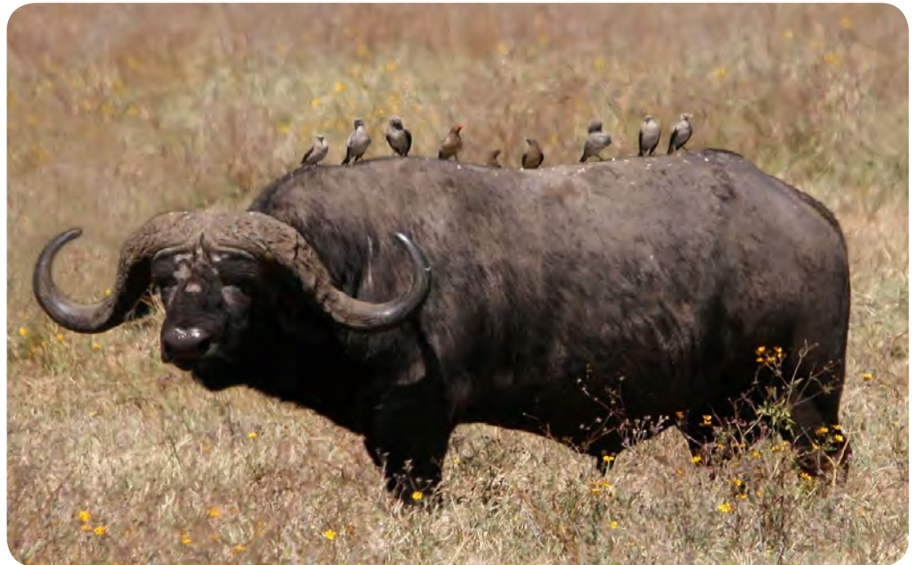
African buffalo Syncerus caffer

Leur association avec les crocodiles n'est pas si étonnante : en échange du nettoyage méticuleux de la bouche de ceux-ci, ils en reçoivent une protection (involontaire) de leurs nids, lesquels nids sont fort exposés, puisque établis au ras du sol.