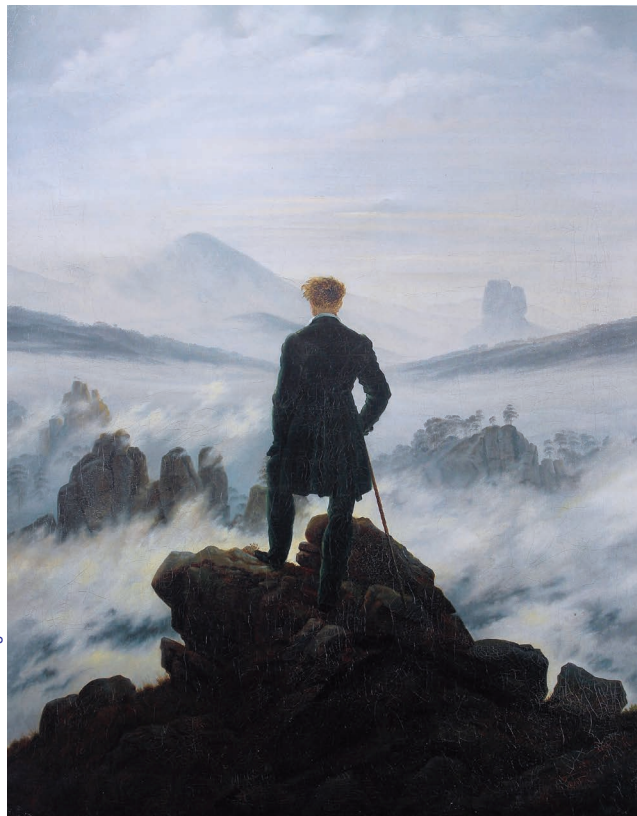
Le Voyageur contemplant une mer de nuages, Caspar David Friedrich, 1818

pictural de «l'homme au bain»). Le choix de cette image, qui est aussi une image de solitude recueillie (surtout isolée ainsi de son contexte), met l'accent sur une dimension intérieure, existentielle, l'expérience plus que l'action pure. On sera attentif durant la projection à repérer les plans et les séquences qui relèvent du même registre. En tenant compte du fait que l'image retenue pour l'affiche a été dument choisie, les élèves pourront aussi donner leur sentiment sur ce que celle-ci leur évoque avant et après vision du programme. Quelles sont les caractéristiques de l'image qui peuvent faire également écho à La Soufrière (figure humaine isolée, environnement extrême voire dangereux, dénuement)? ■