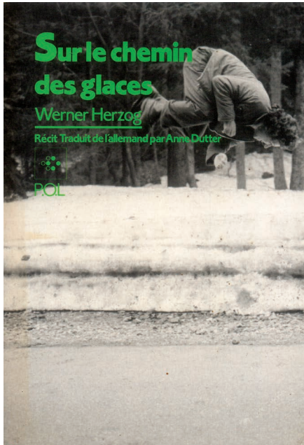
Couverture de Sur le chemin des glaces de Werner Herzog, 1988 © P.O.L

Le récit d'une longue marche effectuée par Werner Herzog, Sur le chemin des glaces , présente de nombreux échos avec ces films d'ascensions.