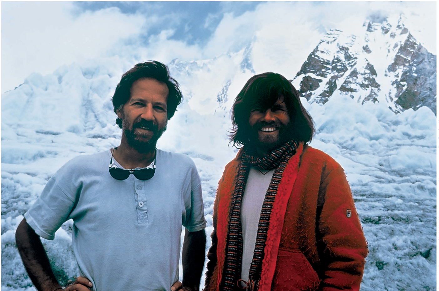
Werner Herzog et Reinhold Messner sur le tournage de Gasherbrum en 1984