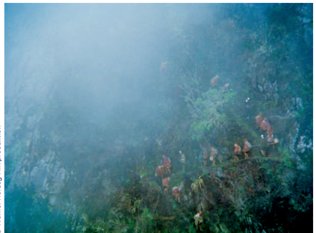
Aguirre, la colère de Dieu de Werner Herzog, 1972

commentateurs de Herzog pour qualifier l'impression que donnent ses films de fiction. On dira plutôt qu'il n'y a pas de différence essentielle chez Herzog entre un plan de fiction et un plan documentaire, comme le montre l'ouverture. Le cinéaste s'attache dans tous les cas à exprimer la nature de l'action enregistrée par la caméra (ce qu'il appellerait sa « vérité », au-delà de sa dimension factuelle), la dimension physique restituée dans toute son ampleur autant que ce qui anime les personnages, fictifs ou réels. En accord aussi avec sa conception du paysage au cinéma, il ne s'agit pas pour lui de « poser le décor », mais de représenter les rapports entre les personnages et leur environnement (par exemple les contrastes produits par des personnages richement vêtus dans la jungle vont inciter à être attentif à ces rapports dans la fiction, à ce que la jungle fera à ces personnages, ou deviendra à leurs yeux).