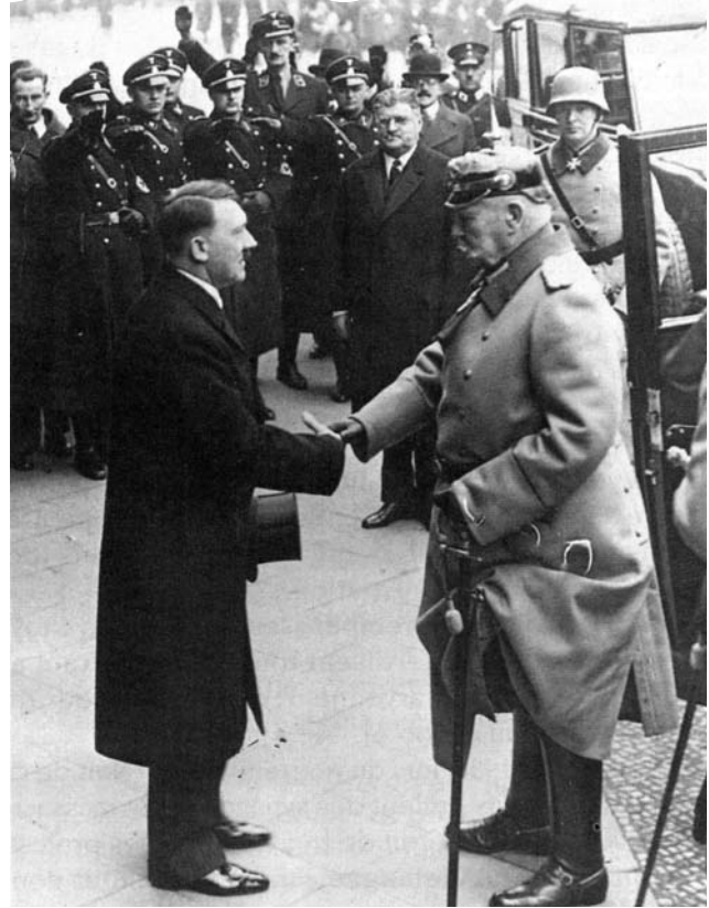
Le président Hindenburg appelle Hitler au poste de chancelier

Le pays est dans un état de guerre civile latente. La constitution ne fonctionne plus selon le mode parlementaire. Depuis 1930, alors que le Reichstag s'enlise dans des manœuvres stériles, le président Hindenburg (réélu en mars 1932 à l'âge de 85 ans) tire la république vers un régime présidentiel. Ainsi n'a-t-il pas nommé Hitler comme chancelier après sa victoire aux législatives de juillet 1932, mais Von Papen, sans parti. Frustrés de leur victoire électorale, les nazis accentuent leur recours à la violence. Une multitude de milices paraded dans les rues, s'affrontent, sèment la terreur (environ 300 000 SA et 2 000 SS pour les nazis, Reichsbanner pour les syndicats et les socialistes, Combattants du Front Rouge pour les communistes...). Pour le seul mois de juillet, on dénombre une centaine de morts violentes pour raisons politiques, parmi lesquelles 70 provoquées par des SA. Révélatrice de cette brutalité