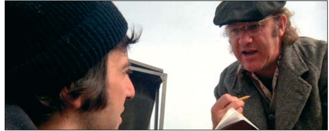
Al Pacino et Gene Hackman dans L'Épouvantail