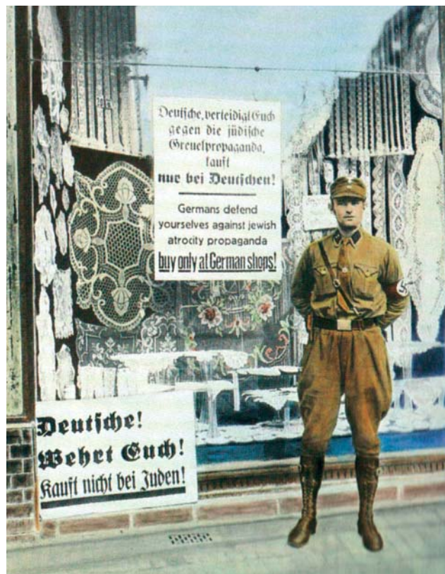
Boycott des magasins et cabinets juifs à Berlin, le 1 er avril 1933. Slogans : « Allemands, résistez ! N'achetez pas chez les juifs ! » – « Allemands, défendez-vous contre l'abominable propagande juive. N'achetez que chez les Allemands ! »

La théorie du bouc émissaire est l'explication la plus courante de l'antisémitisme : les Juifs, partout minoritaires, seraient les victimes expiatoires d'une société en crise. Durkheim, Freud, Braudel, Sartre ( Réflexions sur la question juive ) ou René Girard ( Le Bouc émissaire ) l'ont invoquée. Agrresser les Juifs permettrait