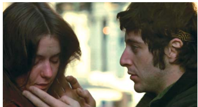
Kitty Winn et Al Pacino dans Panique à Needle Park