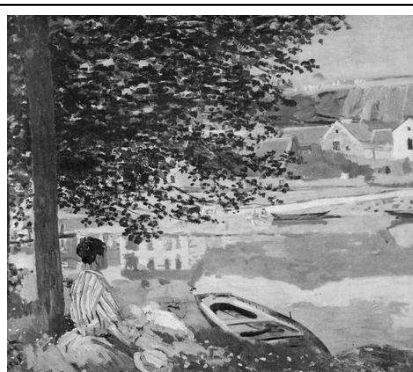
La Seine à Bennecourt Claude Monet, 1868