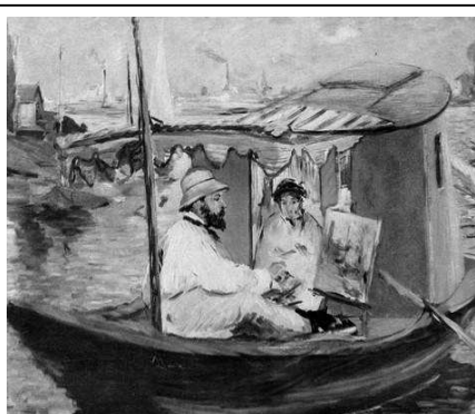
Monet et sa femme sur le bateau atelier Claude Monet, 1874