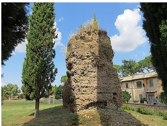
Catacombe di San Callisto (Catacombes de Saint-Calixte)