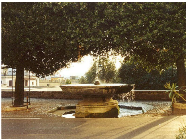
Fontana di Villa Medici, jardins de la Villa Medici, Giovanni Lippi, ca. 1564

C : pour la dernière partie, pas de thème, mais un ralentissement du tempo, des trombones tonitruants, puis un decrescendo progressif : le cortège s'éloigne.