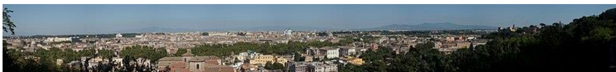
Panorama de Rome depuis le Janicule

« Un frémissement passe dans l'air : les pins du Janicule se profilent au clair d'une lune sereine. Le rossignol chante. »