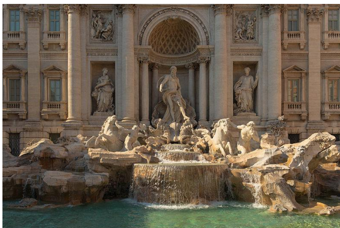
Détail de la Fontana di Trevi, place de Trevi, Nicolas Salvi, 1732-1762

« Un thème solennel chante au-dessus des grondements de l'orchestre. C'est la fontaine de Trevi en plein midi. Passant des bois aux cuivres, le thème atteint une sonorité triomphante.