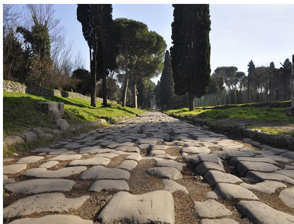
Panorama de Rome depuis le Janicule

« Aube brumeuse sur la Voie Appienne : la campagne tragique est veillée par des pins solitaires. Indistinct, incessant, le rythme d'un pas innombrable. À la fantaisie du poète apparaît une vision de gloires antiques : les buccins retentissent, et une armée