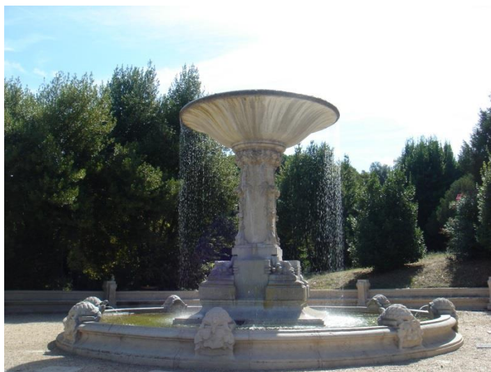
L'une des deux fontaines du Valle Giulia, Villa Borghese, nommée Fontane delle tartarughe (« Fontaine des tortues »), Cesare Bazzani, 1911

Ce tableau lent et calme évoque l'aube et le lever du soleil. Il est construit sur une forme simple ABA : un premier thème A, un second thème B au caractère contrasté, puis retour du thème A.