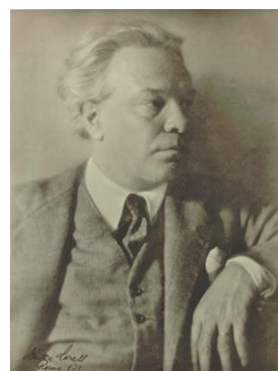
Ottorino Respighi

Pour prolonger, cf. Annexe 1, Petite histoire du poème symphonique, p. 19.