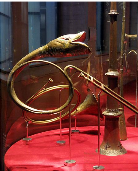
Buccin, Narcis Coll., ca. début XIX e s., Musée de la musique de Barcelone

Pour « Les Pins de la Voie Appienne », le 4 e et dernier tableau de Pins de Rome , Respighi indique « 6 buccins ».