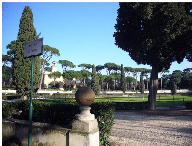
Piazza di Siena, jardins de la Villa Borghese - © Howardhudson at Englishwikipedia

« Joyeux ébats d'enfants sous les pins de la Villa Borghese. Danses et rondes ; les plus belliqueux jouent au soldat et à la guerre. Tous se grisent de clameur et de grand air comme des hirondelles à la tombée du jour, et finissent par s'échapper en essaim. Le paysage change tout à coup ... »