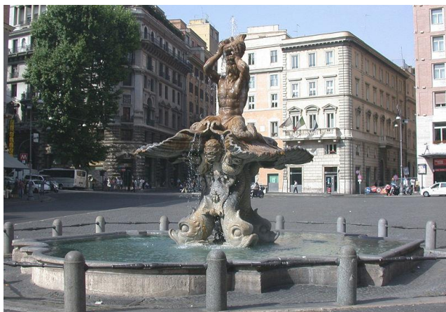
Fontana del Tritone (« Fontaine du Triton »), place Barberini, Gian Lorenzo Bernini, dit Le Bernin, 1543 - © MM, via Wikimedia Commons

Ce deuxième tableau est plus animé. Il porte la fraîcheur du matin. Sa structure repose sur deux thèmes (A et B), le second étant plutôt une cellule mélodique. Noter la présence du piano.