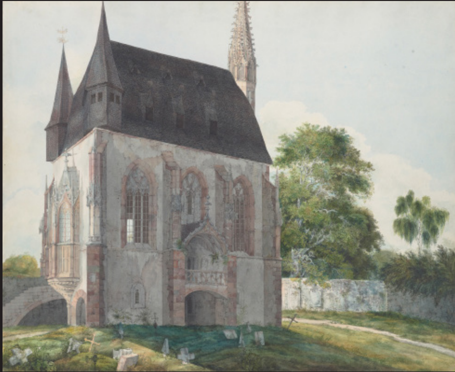
Carl Philipp Fohr, La Chapelle des morts à Kiedrich , vers 1814, Plume et encre gris-noir, aquarelle et traces de blanc de plomb sur crayon graphite sur vélin