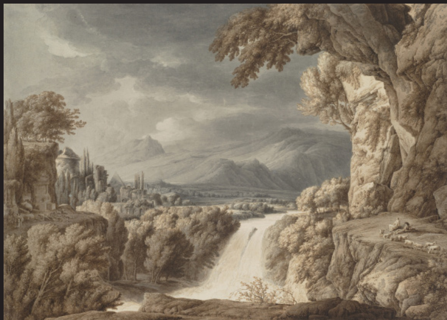
Franz Innocenz Josef Kobell, Paysage héroïque avec cascade , Plume et encre brune, lavis gris et brun sur crayon graphite sur papier