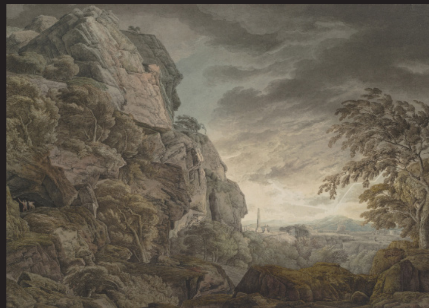
Franz Innocenz Josef Kobell, Paysage héroïque sous l'orage , Plume et encre brune et noire, aquarelle sur crayon graphite sur papier