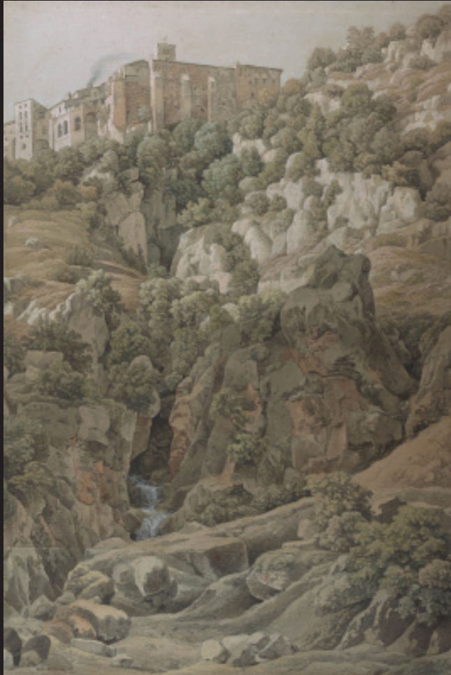
Johann Christian Reinhart, L'Abbaye bénédictine Sainte-Scholastique dans les monts Sabins , 1797, Aquarelle, rehauts de blanc, plume et encre noire sur craie noire et crayon graphite sur papier