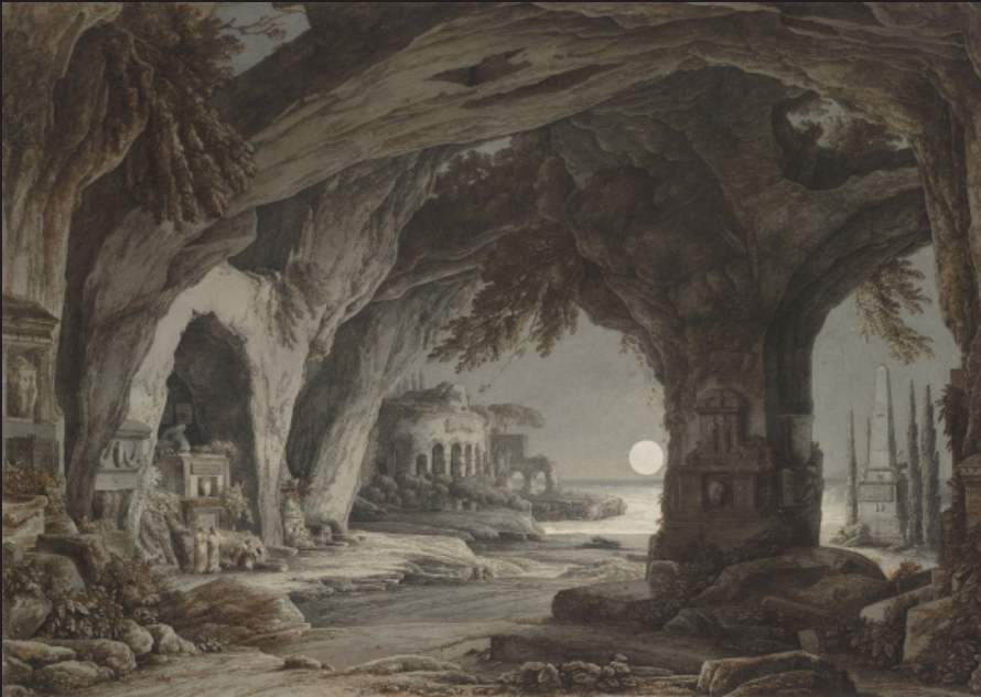
Franz Innocenz Josef Kobell, Paysage idéal avec grotte, tombeaux et ruines au clair de lune , vers 1787, Craie noire, plume et encre brune et noire, lavis gris et brun sur papier