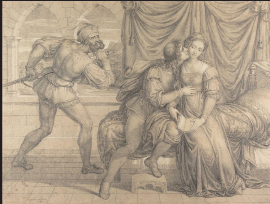
Joseph Anton Koch, Paolo et Francesca surpris par Gianciotto Malatesta , 1809, Craie noire et blanche sur crayon graphite sur papier brunâtre