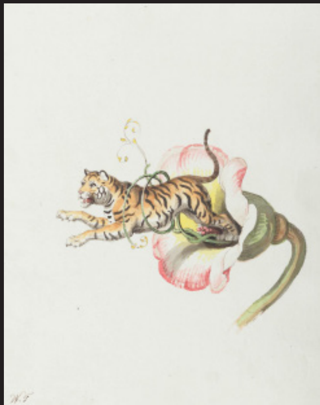
Johann Heinrich Wilhelm Tischbein, Un tigre bondit hors d'une corolle de fleur. Allégorie d'inspiration florale , 1817, Plume et encre brune sur crayon graphite, craie sur aquarelle, encadrement rectangulaire avec plume et encre noire, cadre à l'aquarelle sur papier