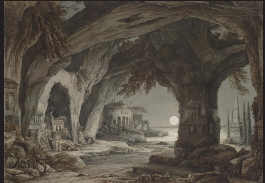
Franz Innocenz Josef Kobell, Paysage idéal avec grotte, tombeaux et ruines au clair de lune , vers 1787, Craie noire, plume et encre brune et noire, lavis gris et brun sur papier