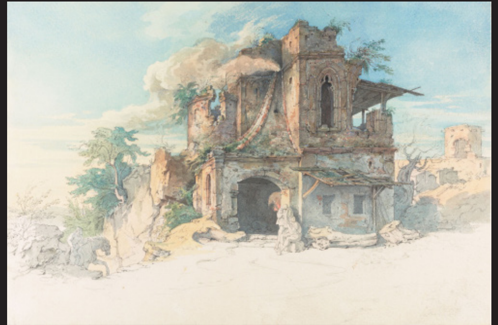
Moritz Ludwig von Schwind, Schiller : Fridolin ou l'Usine , sans date, Plume et encre gris-noir, aquarelle, traces de gouache sur crayon graphite sur carton