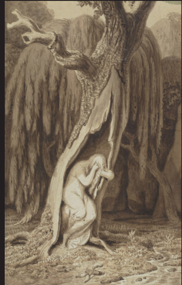
Johann Heinrich Wilhelm Tischbein, Dryade , vers 1820, Plume et encre brune, lavis brun sur papier, bordure aquarellée en vert, collée et marouflée sur papier