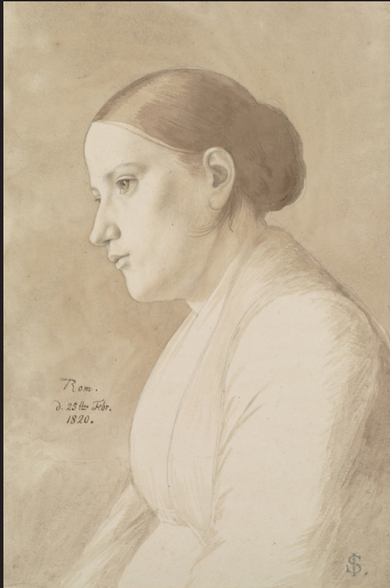
Julius Schnorr von Carolsfeld, Portrait de femme tournée vers la gauche , 1820, Plume et encre grise, lavis brun sur crayon graphite sur vélin