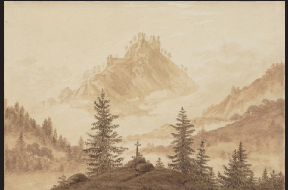
Caspar David Friedrich, Paysage de montagne avec croix au milieu des sapins, vers 1804-1805, Plume et encre, lavis brun sur crayon graphite, encadrement au crayon graphite sur vélin