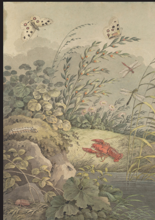
Adrian Zingg, Fragment de nature. Berge avec écrevisse, insectes, papillons et argousier , vers 1800, Aquarelle, plume et encre grise sur papier