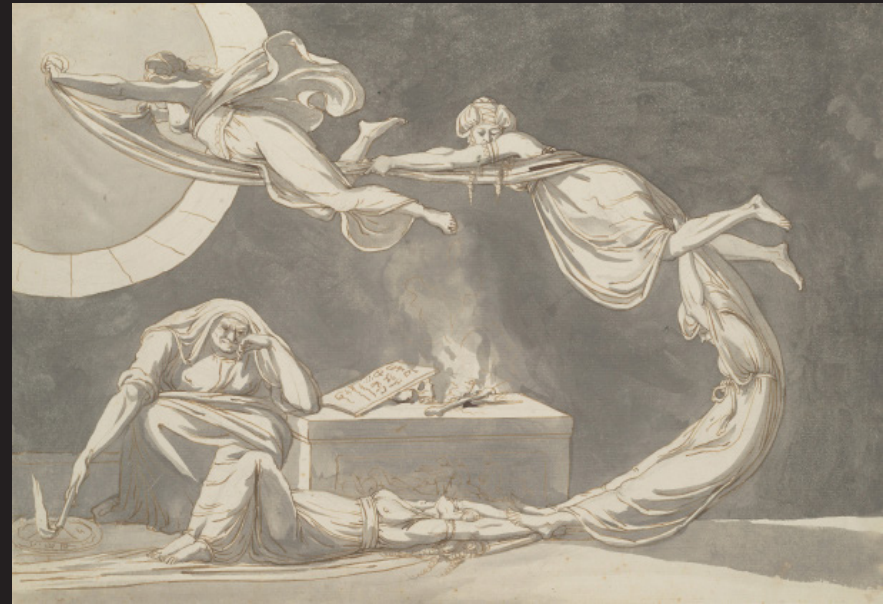
Johann Heinrich Füssli, Scène d'incantation avec une sorcière près de l'autel , avril 1779, Crayon graphite, plume et encre brune et noire, lavis gris sur papier