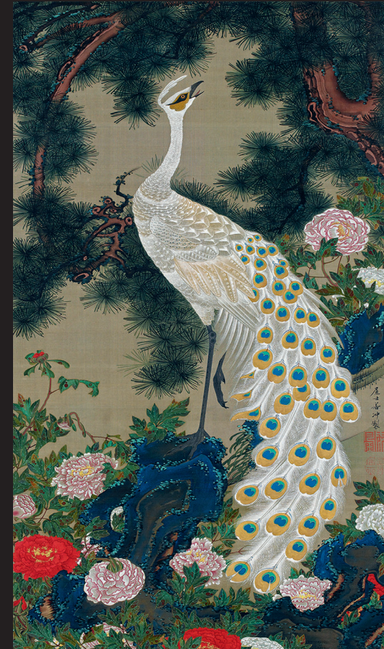
2. Itō Jakuchū, Vieux pin et paon , 1757-1760, Tôkyô, Musée des collections impériales (Sannomaru Shōzōkan), Agence de la Maison impériale