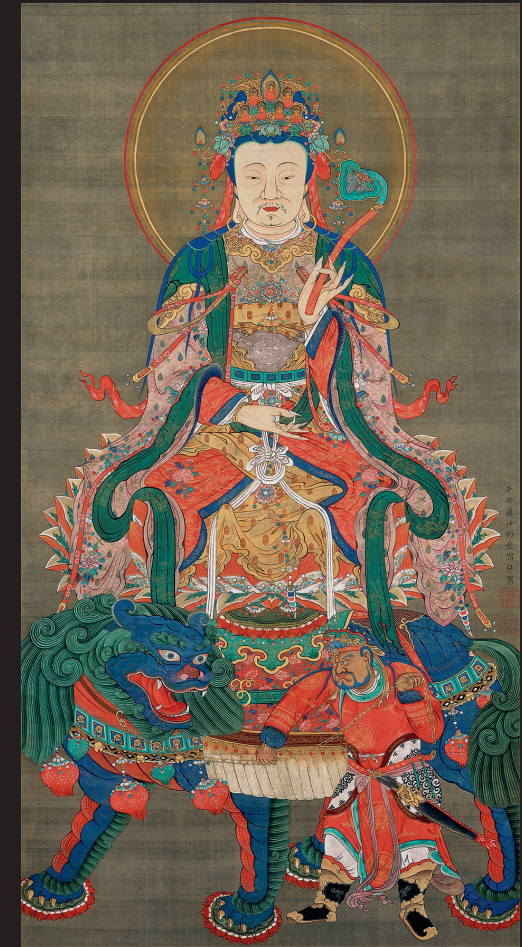
11. Itō Jakuchū, Bodhisattva Manjusri , 1765, Shōkokuji, Kyōto