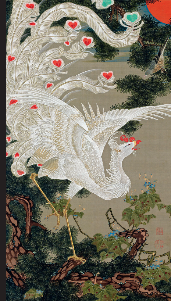
Itō Jakuchū, Vieux pin et phénix blanc , 1765-1766, Tōkyō, Musée des collections impériales (Sannomaru Shōzōkan), Agence de la Maison impériale