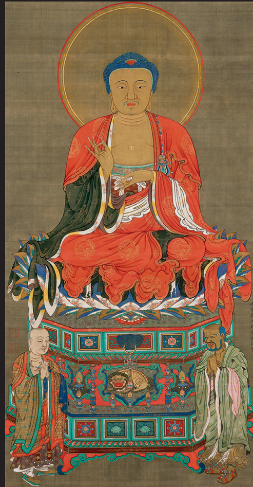
10. Itō Jakuchū, Boudhha Sakyamuni , 1765, Shōkokuji, Kyōto