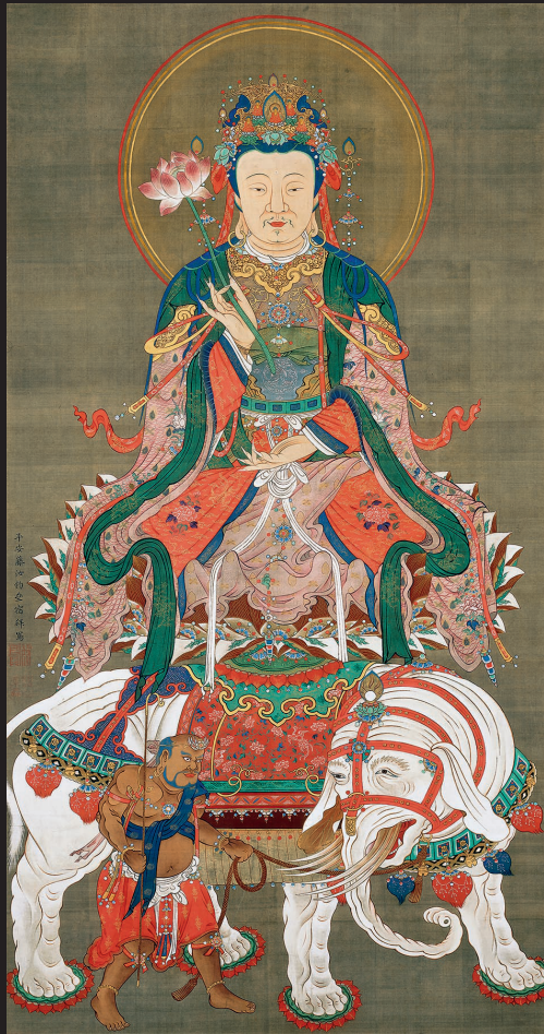
9. Itō Jakuchū, Bodhisattva Samantabhadra , 1765, Shōkokuji, Kyōto