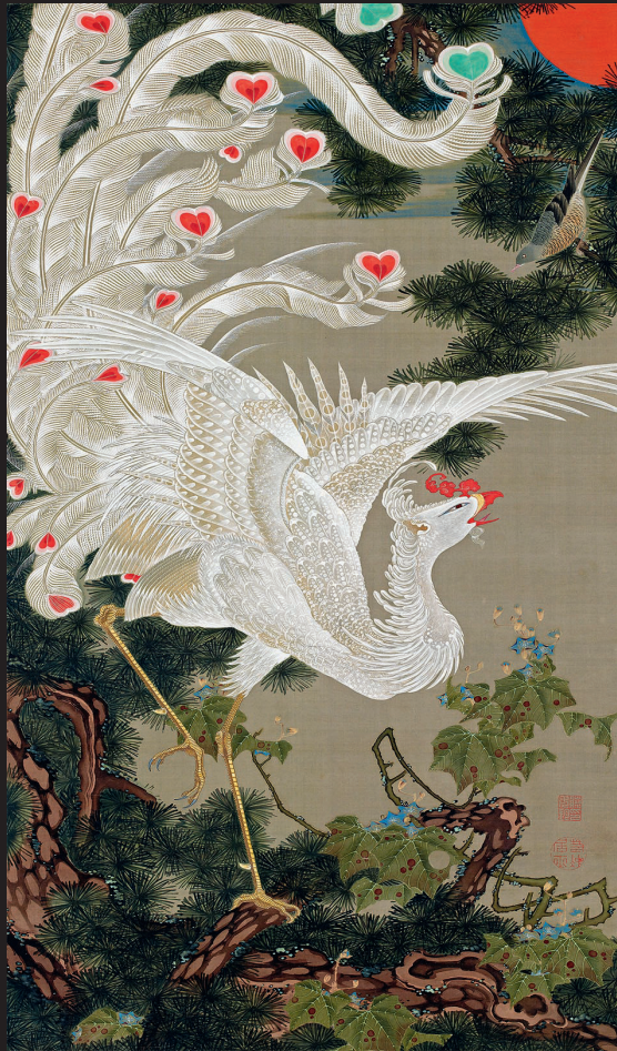
7. Itō Jakuchū, Vieux pin et phénix blanc , 1765-1766, Tōkyō, Musée des collections impériales (Sannomaru Shōzōkan), Agence de la Maison impériale