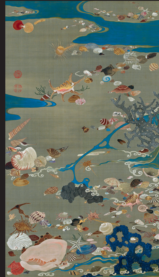
6. Itō Jakuchū, Coquilles , 1761-1765, Tôkyô, Musée des collections impériales (Sannomaru Shōzōkan), Agence de la Maison impériale