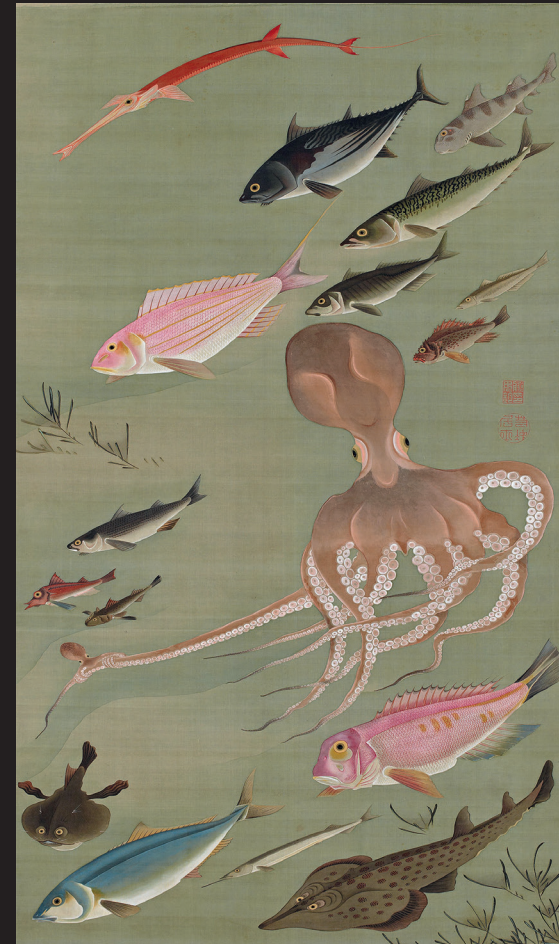
8. Itō Jakuchū, Poissons , 1765-1766, Tōkyō, Musée des collections impériales (Sannomaru Shōzōkan), Agence de la Maison impériale