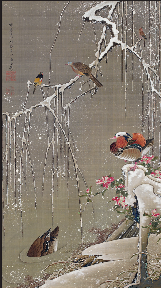
1. Itō Jakuchū, Canards mandarins dans la neige , 1759, Tôkyô, Musée des collections impériales (Sannomaru Shōzōkan), Agence de la Maison impériale