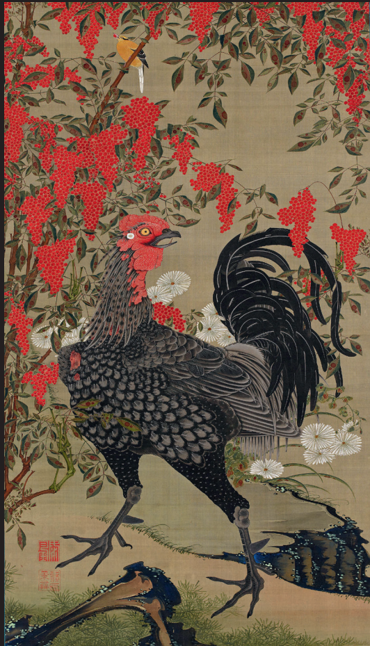
3. Itō Jakuchū, Nandina et coq , 1765, Tōkyō, Musée des collections impériales (Sannomaru Shōzōkan), Agence de la Maison impériale