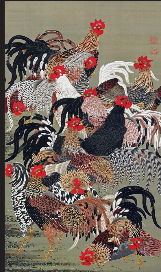
4. Itō Jakuchū, Coqs , 1761-1765, Tōkyō, Musée des collections impériales (Sannomaru Shōzōkan), Agence de la Maison impériale