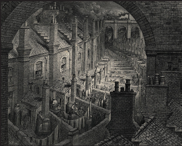
1. Gustave Doré, Au-dessus de Londres depuis une voie ferrée , Gravure sur bois. Musée d'art moderne et contemporain de Strasbourg.