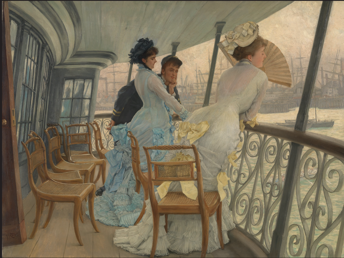
7 James Tissot, La Galerie du «HMS Calcutta» (Portsmouth) , vers 1876, huile sur toile, Tate, Londres, don de Samuel Courtaud en 1936.