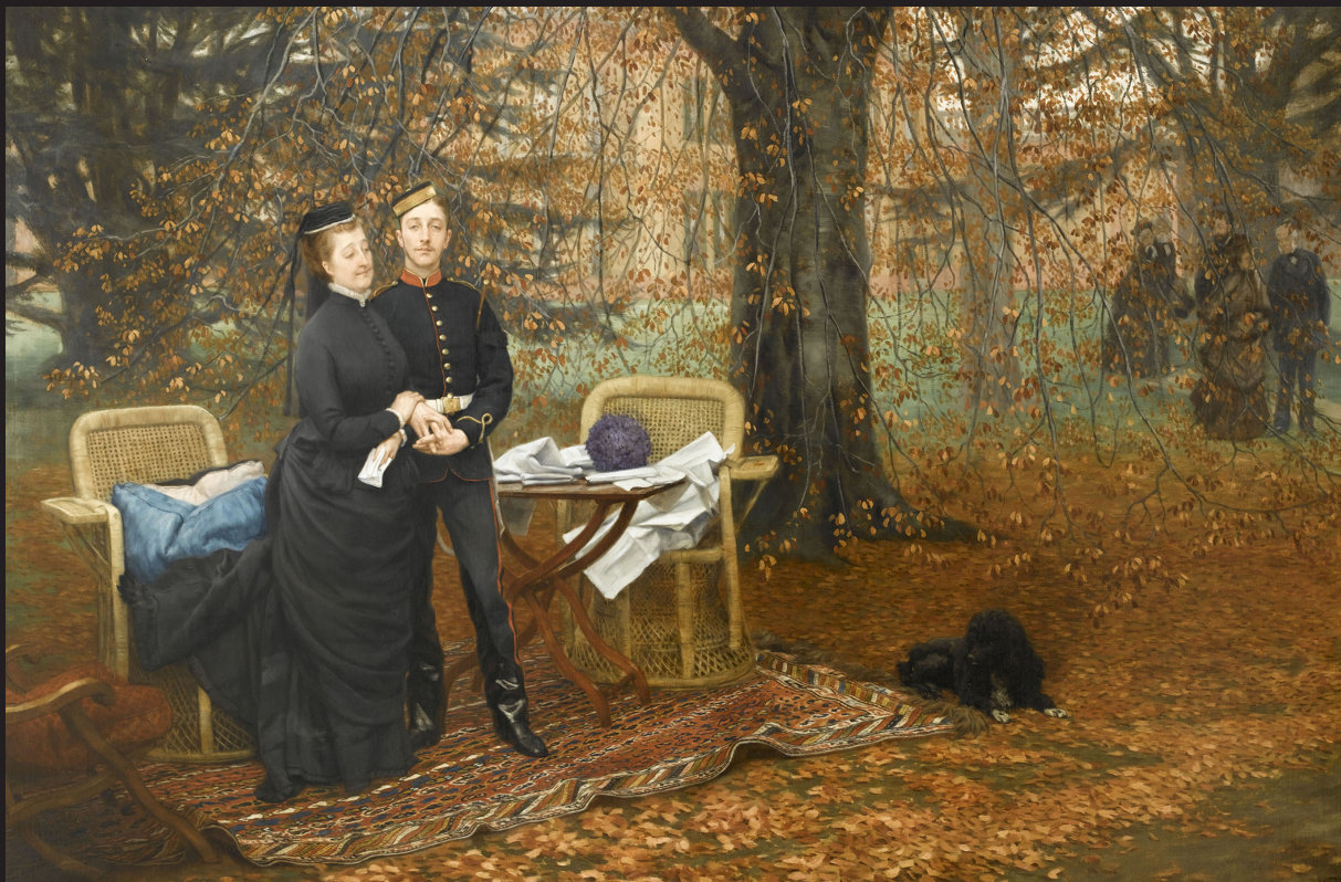
3. James Tissot, L'impératrice Eugénie et le prince impérial dans le parc de Camden Place, Chislehurst, 1874-1875, huile sur toile, Musée national du palais de Compiègne.