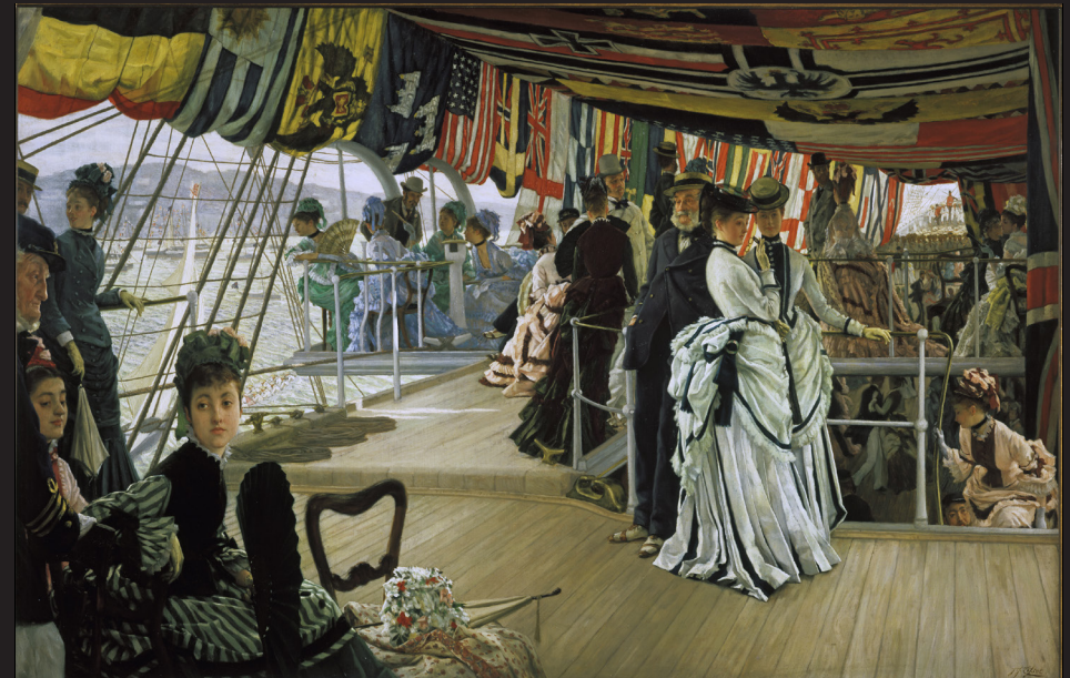
6. James Tissot, Bal sur le pont , vers 1874, huile sur toile. Tate, Londres, don de The Trustees of the Chankey Bequest, 1937. © Tate 2017. Photo : David Lambert