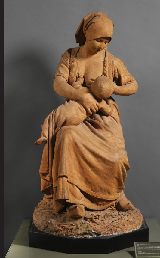
9. Jules Dalou, Paysanne française allaitant, 1873, terre cuite.