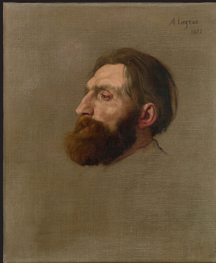
11. Alphonse Legros, Portrait d'Auguste Rodin , 1882, huile sur toile, Musée Rodin, Paris.