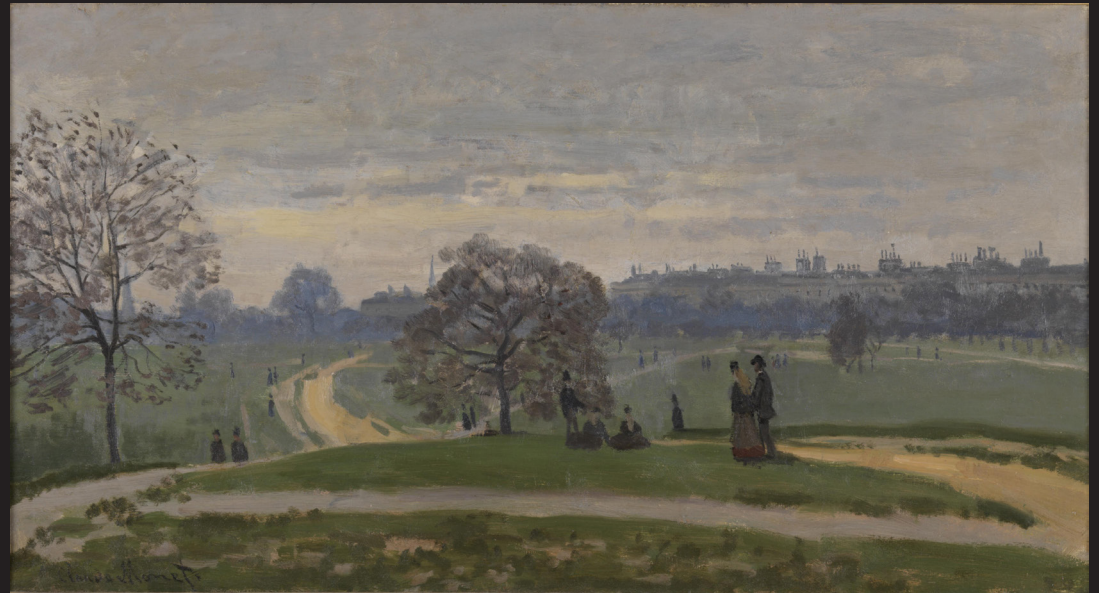
2. Claude Monet, Hyde Park , 1871, Huile sur toile. Museum of Art, Rhode Island School of design, Providence, don de Mrs Murray S. Danforth.