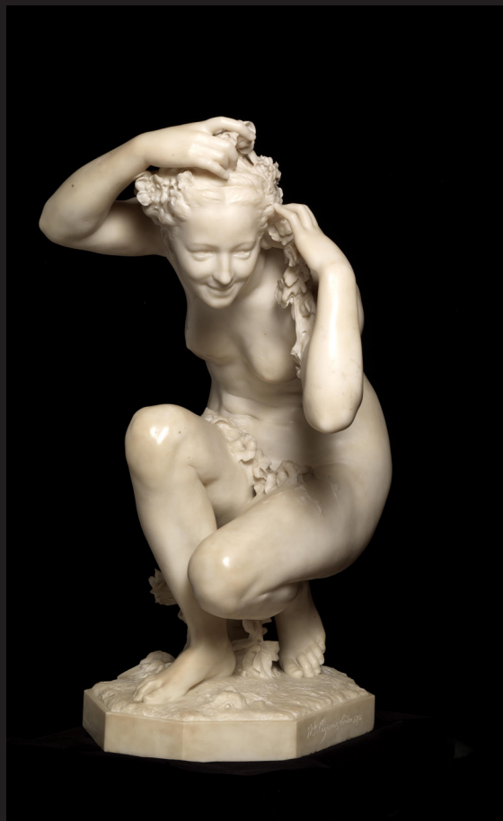
4. Jean-Baptiste Carpeaux, Flore , 1873, Museu Calouste Gulbenkian, Founder's Collection, Lisbonne.