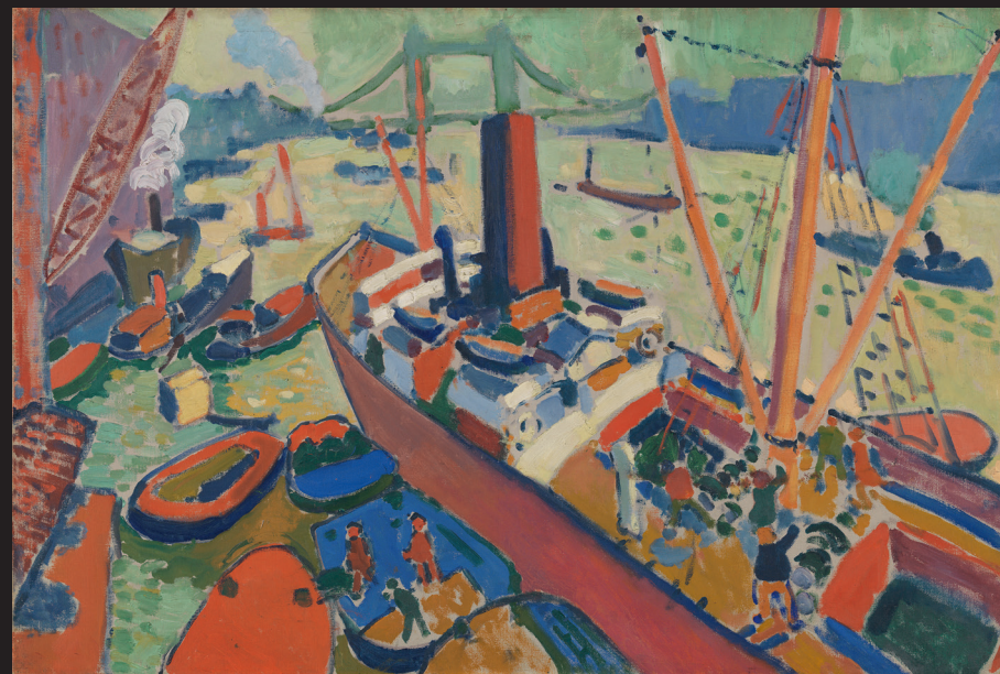
21. André Derain, Le Bassin de Londres , 1906, huile sur toile, Tate, Londres, don de The Trustees of the Chantrey Bequest, 1951.