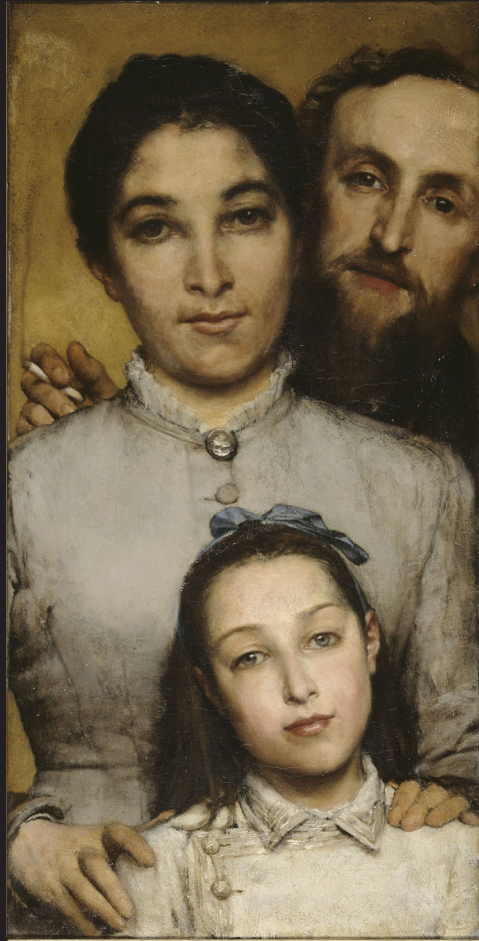
8. Lawrence Alma-Tadema, Portrait de Jules Dalou, sa femme et sa fille, 1876, huile sur toile, Musée d'Orsay, Paris.