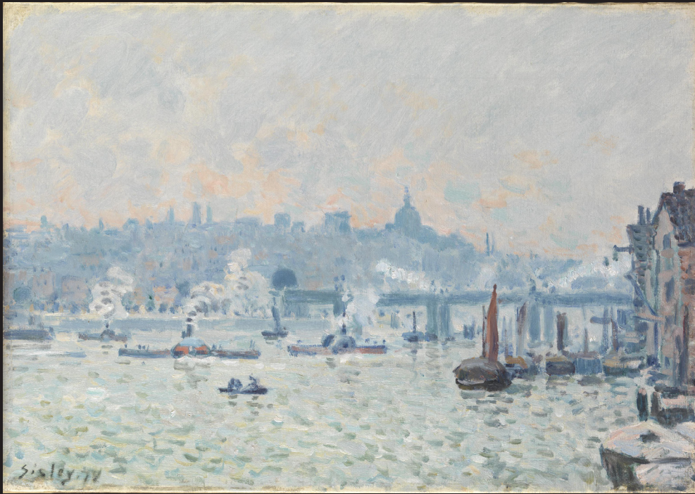
13. Alfred Sisley, Vue de la Tamise : le pont de Charing Cross , 1874, huile sur toile, Andrew Brownsword Arts Foundation, en dépôt à la National Gallery, Londres.