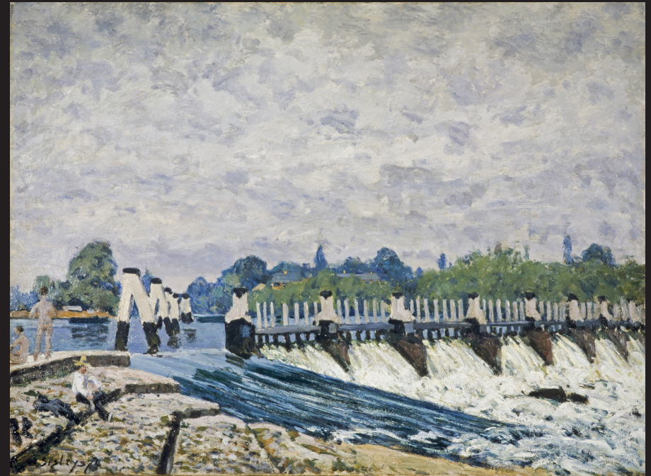
14. Alfred Sisley, Le Barrage de Molesey, Hampton Court, effet du matin , 1874, huile sur toile, Scottish National Gallery, Edimbourg.