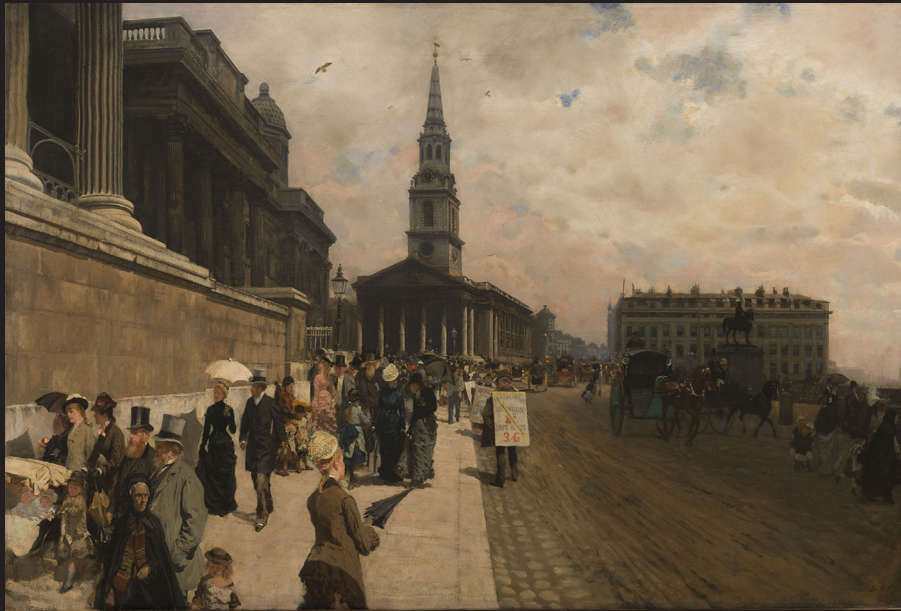
5. Giuseppe De Nittis, The National Gallery , 1877, huile sur toile. Petit Palais, Musée des Beaux-Arts de la Ville de Paris.