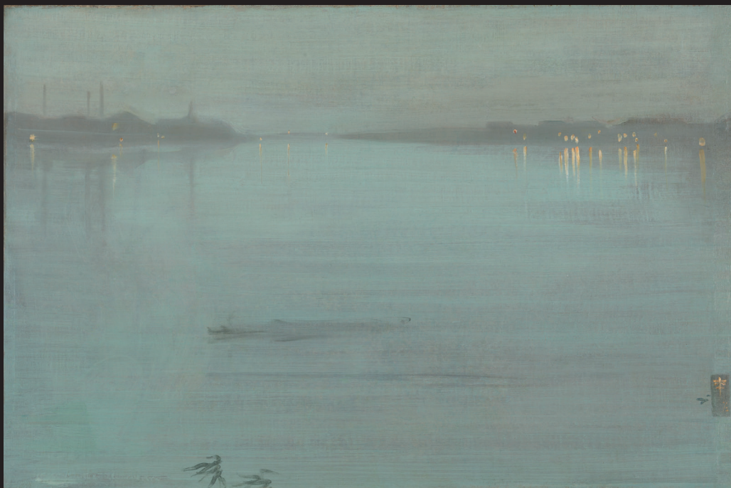
17. James Abbott McNeill Whistler, Nocturne en bleu et argent : les lumières de Cremorne , huile sur bois, 1872. Tate, Londres, legs d'Arthur Studd en 1919.