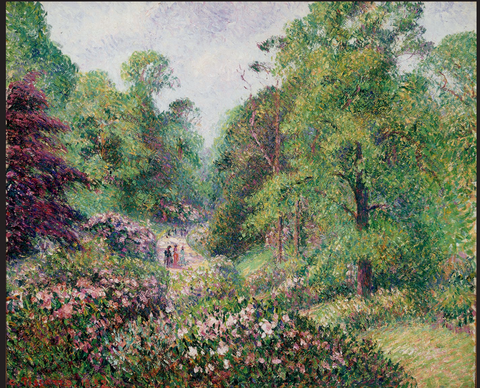
16. Camille Pissarro, Jardin de Kew, Londres. L'allée des rhododendrons , 1892, huile sur toile, collection particulière, États-Unis