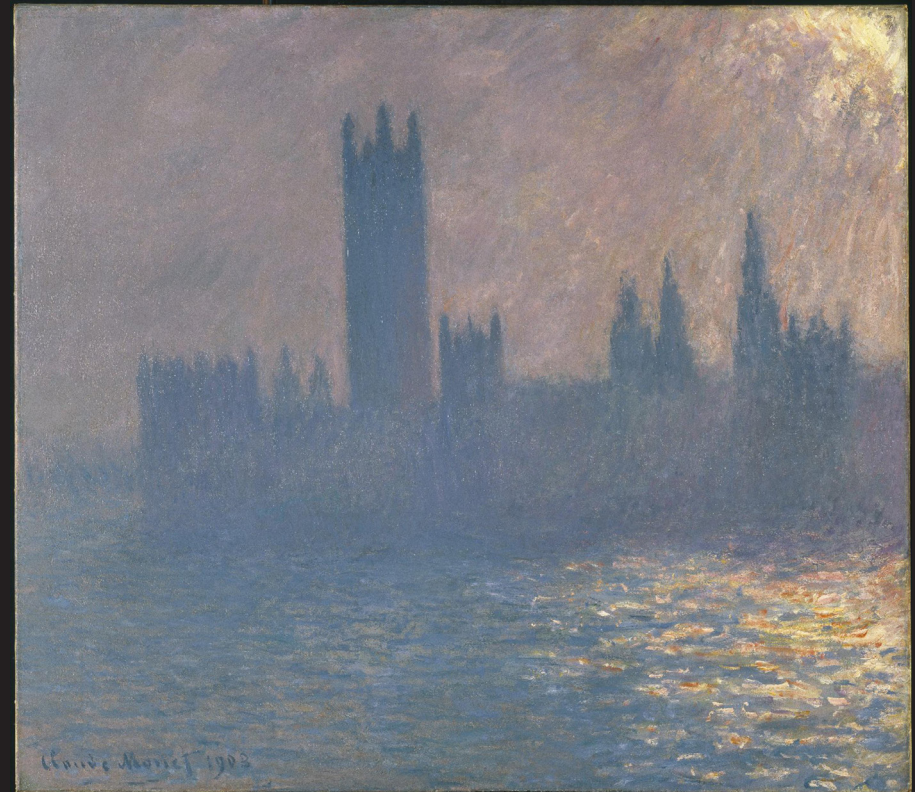
19. Claude Monet, Le Parlement de Londres, effet de soleil , 1903, huile sur toile, Brooklyn Museum, New York, legs de Grace Underwood Barton.