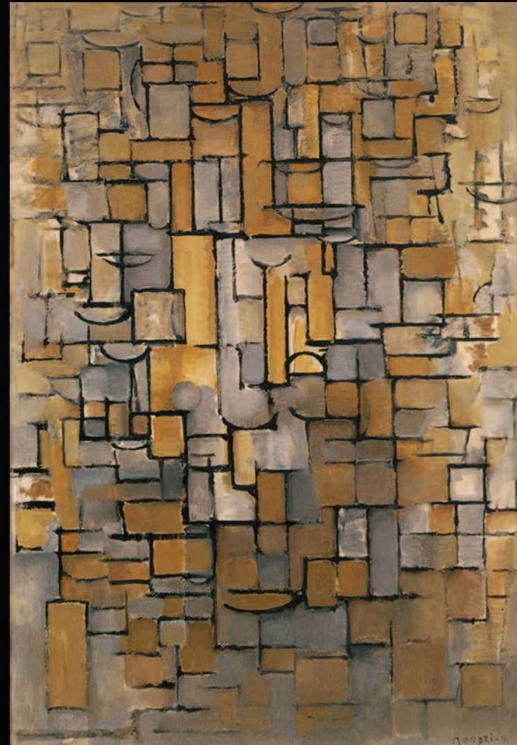
19. Piet Mondrian, Composition XIV (Compositie XIV) , 1913. Huile sur toile. Collection Van Abbemuseum, Eindhoven, Pays-Bas NE PAS RECADRER