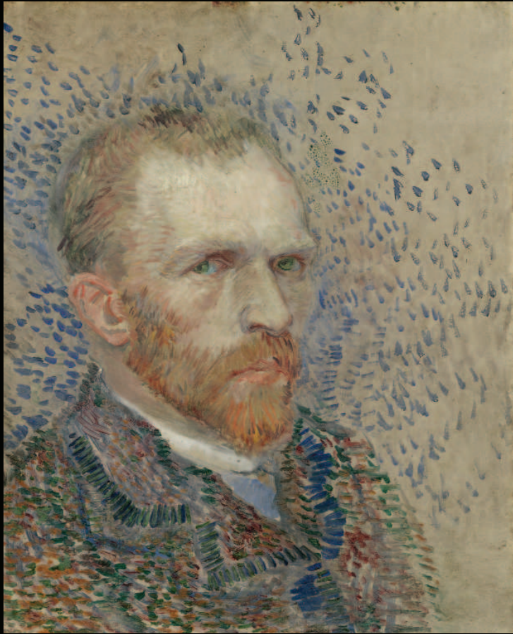
10. Vincent van Gogh, Autoportrait , 1887, huile sur carton, Van Gogh Museum, Amsterdam (Vincent van Gogh Foundation)