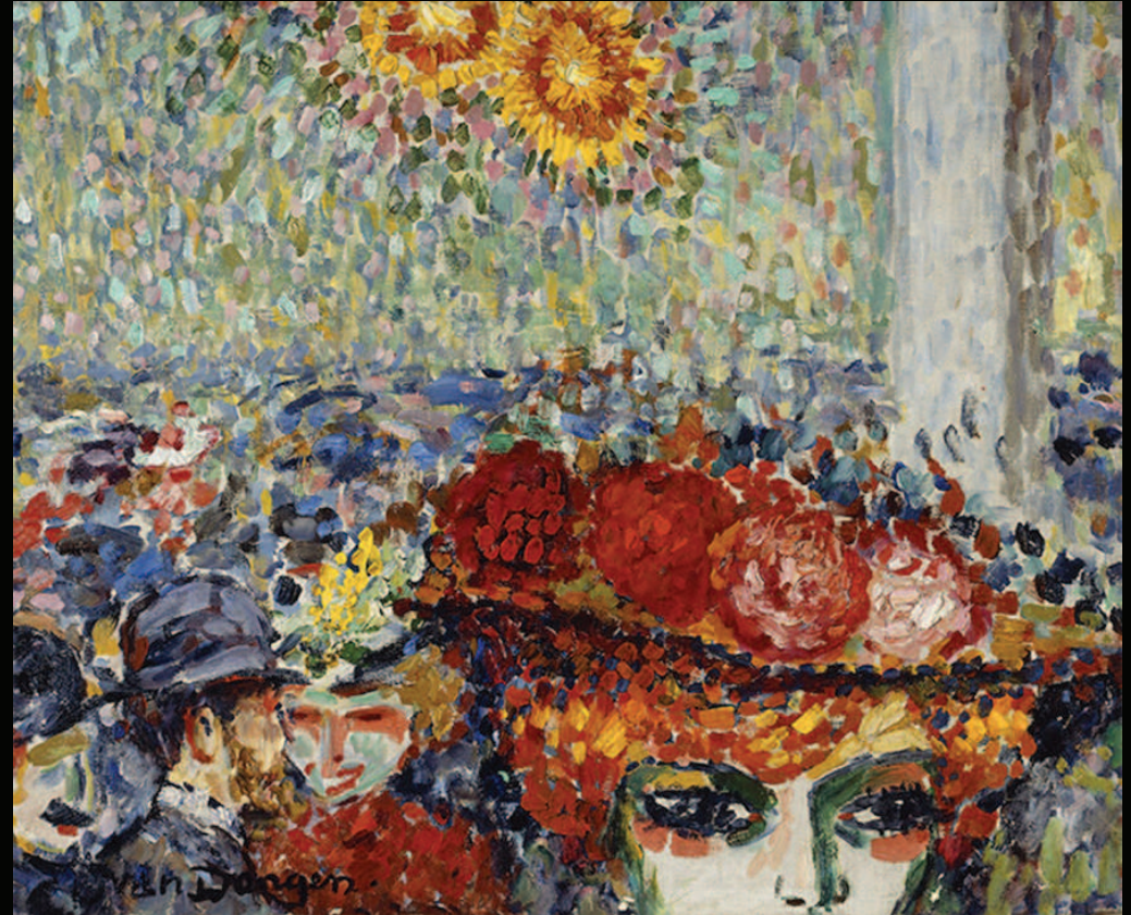
15. Kees van Dongen, À la Galette, 1904-1906. NE PAS RECADRER