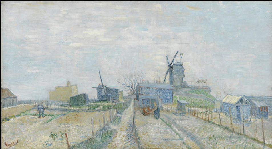
12. Vincent van Gogh, Jardins potagers et moulins à Montmartre , 1887, huile sur toile, Van Gogh Museum, Amsterdam (Vincent van Gogh Foundation)