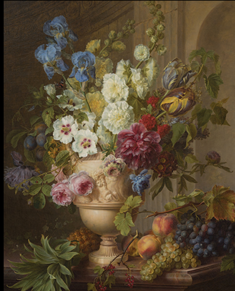
2. Gerard van Spaendonck, Bouquet de fleurs dans un vase d'albâtre sur un entablement de marbre , 1781. Huile sur toile, Het Noordbrabants Museum, Bois-le-Duc ('s-Hertogenbosch)