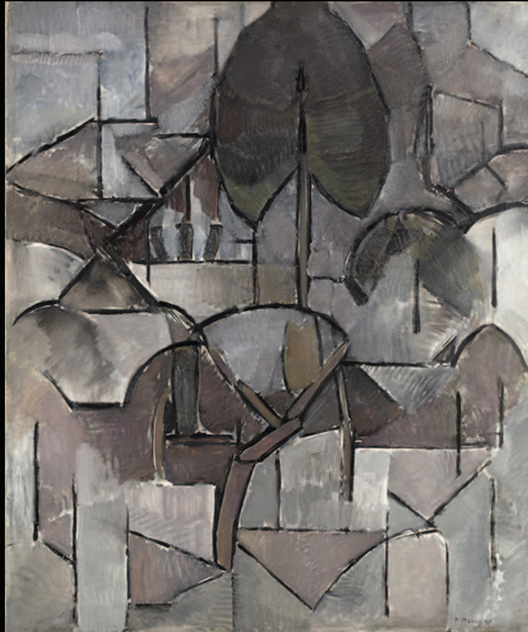
18. Piet Mondrian, Paysage avec arbres , 1912, huile sur toile © Collection Gemeentemuseum, La Haye NE PAS RECADRER