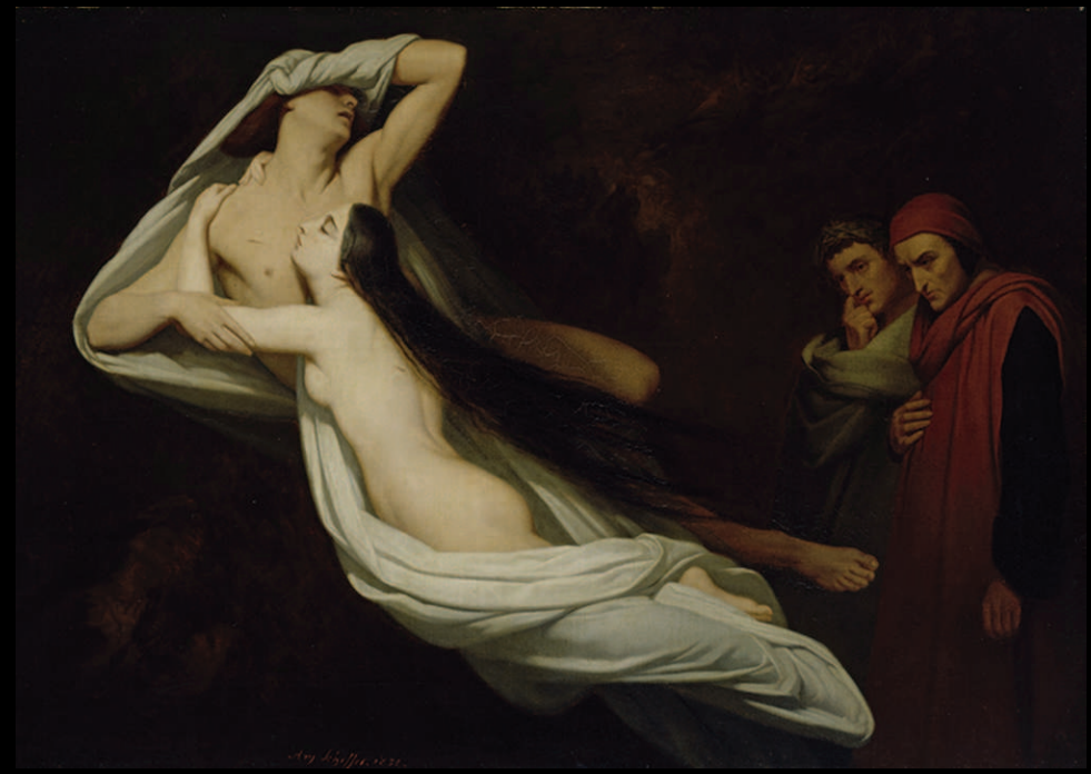
4. Ary Scheffer, Les ombres de Francesca da Rimini et de Paolo Malatesta apparaissent à Dante et à Virgile , 1854, huile sur toile, Hamburger Kunsthalle