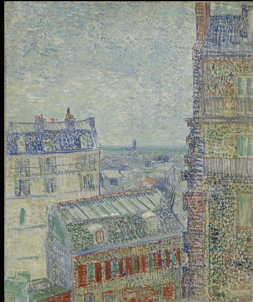
13. Vincent van Gogh, Vue depuis l'appartement de Theo , 1887, huile sur toile, Van Gogh Museum, Amsterdam (Vincent van Gogh Foundation)