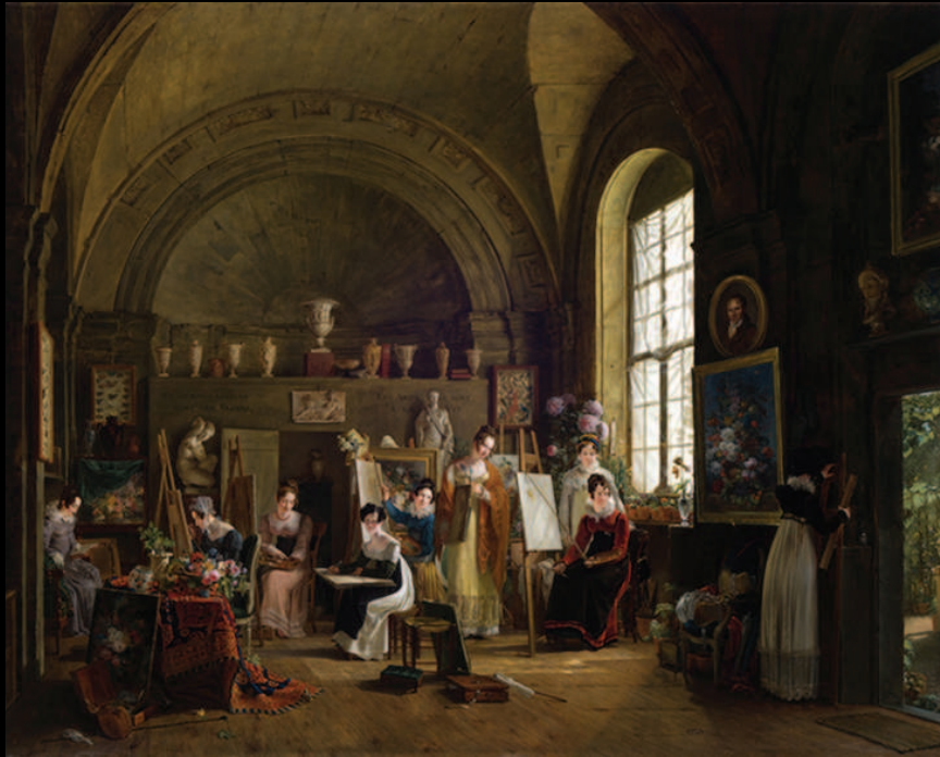
3. Philip van Bree, Vue de l'atelier de Jan Frans van Dael à la Sorbonne , 1816, huile sur toile, Worcester Art Museum, MA, Stoddard Acquisition Fund, 2016.12