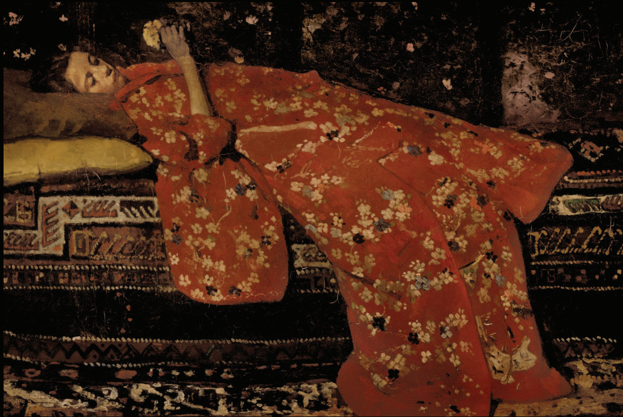
9. George Hendrik Breitner, Le Kimono rouge , 1893, huile sur toile, Stedelijk Museum, Amsterdam, © Collection Stedelijk Museum Amsterdam