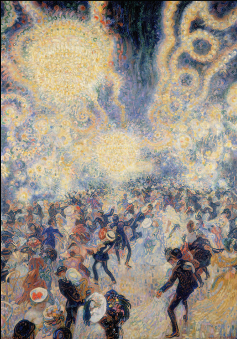
16. Jan Sluijters, Bal Tabarin , 1907, huile sur toile, Stedelijk Museum, Amsterdam