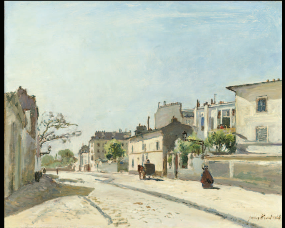
6. Johan Barthold Jongkind, Rue Notre-Dame, Paris , 1866, huile sur toile © Collection Rijksmuseum, Amsterdam. Purchased with the support of the BankGiro Lottery, the Rijksmuseum Fonds and the Vereniging Rembrandt, with additional funding from the Prins Bernhard Cultuurfonds