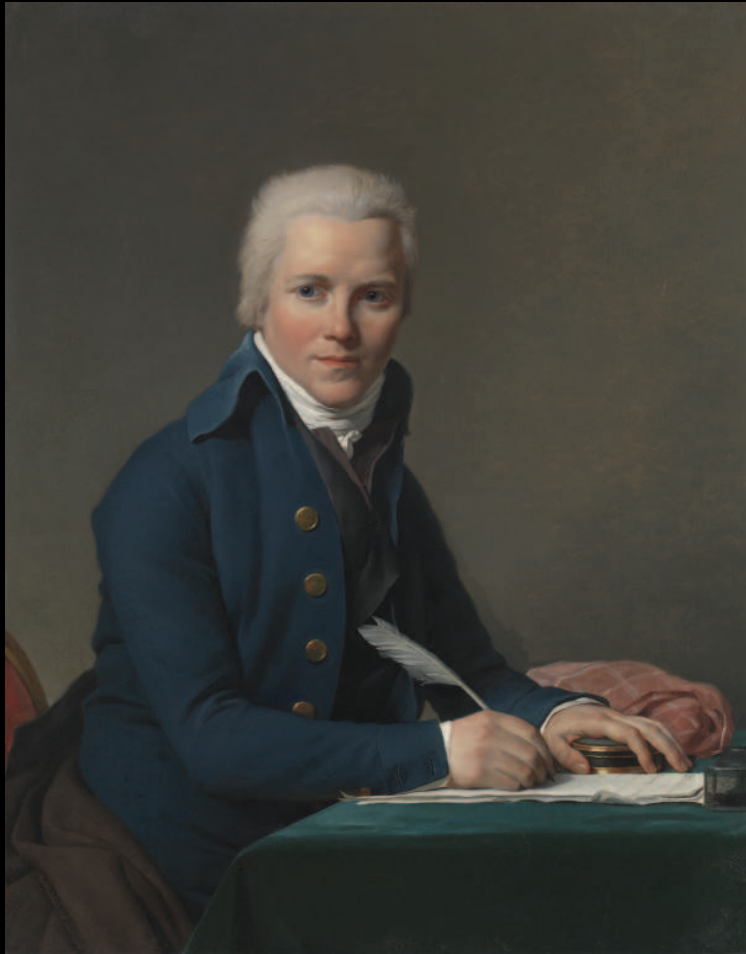
1. Jacques-Louis David, Portrait de Jacobus Blauw , huile sur toile, 1795