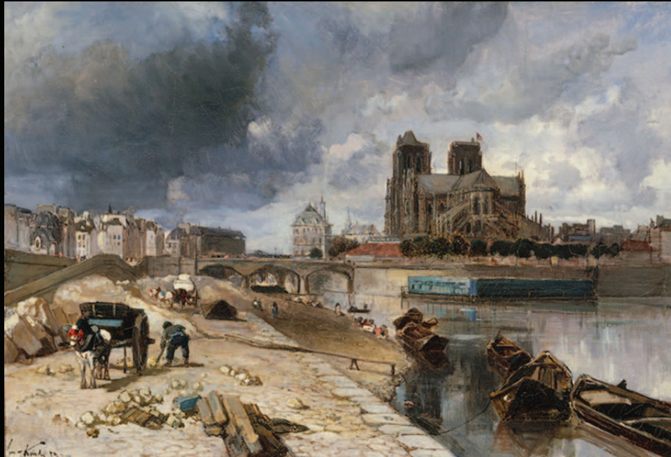
5. Johan-Barthold Jongkind (1819-1891). Notre-Dame vue du quai de la Tournelle. Huile sur toile, 1852. Musée des Beaux-Arts de la Ville de Paris, Petit Palais