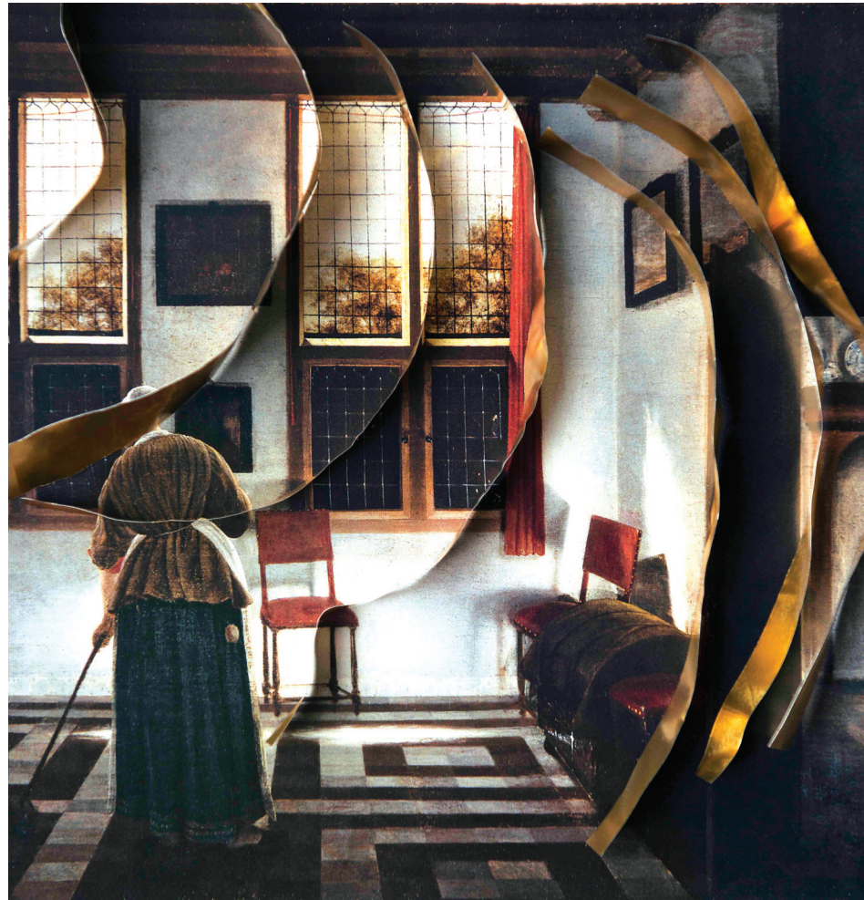
9. Laurence Aëgerter, Elinga , de la série Compositions catalytiques , 2018