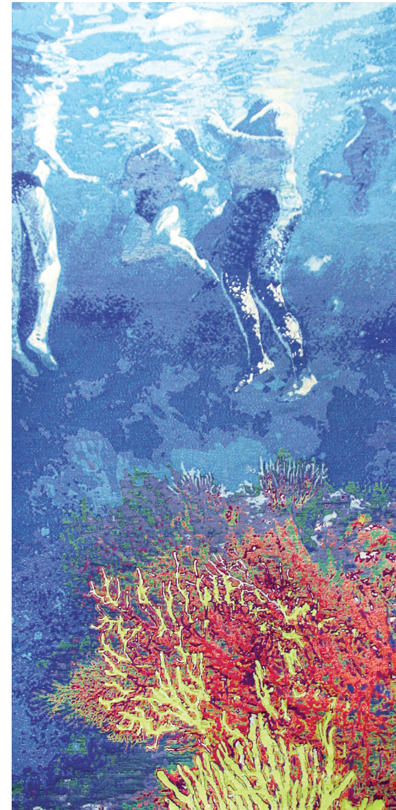
3 et 4. Laurence Aëgerter, Longo Mai , 2013. Série de tapisseries : Bains de Minuit et Bains de Midi . Tapisserie Jacquard en fils mixtes dont laine de mohair, fils lurex et phosphorescents. Commandées par le Musée Borély des Arts décoratifs, de la Faïence et de la Mode, Marseille. 270x135 cm, © Laurence Aëgerter