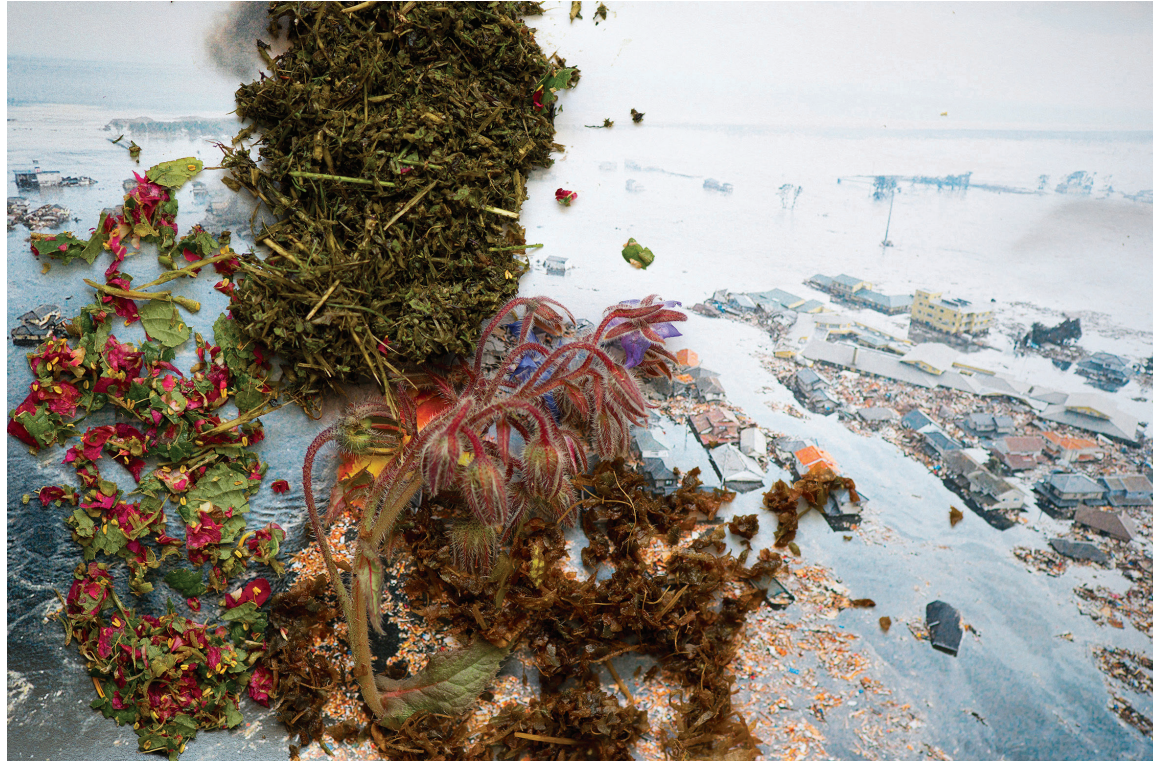
5. Laurence Aëgerter, Cannabis sativa i.a. - coastal Japan, de la série Healing Plants for Hurt Landscapes , 2015.

Laurence Aëgerter «Ici mieux qu'en face» - du 6 octobre 2020 au 17 janvier 2021