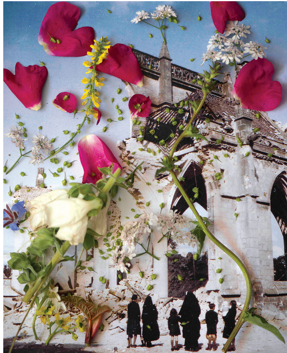
6. Laurence Aëgerter, Digitalis ambigua i.a. – Normandy, France, de la série Healing Plants for Hurt Landscapes , 2015.

Laurence Aëgerter «Ici mieux qu'en face» - du 6 octobre 2020 au 17 janvier 2021