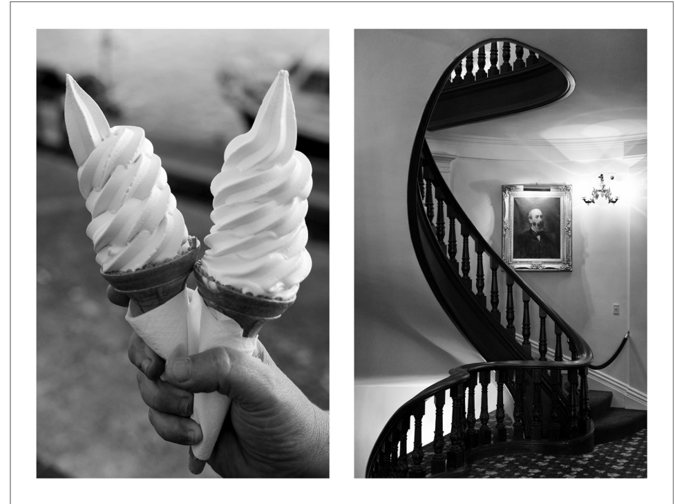
13. Laurence Aëgerter, Photographic Treatment ©, PHT #131, 2016, Tirage sérigraphié au parfum de menthe poivrée, © Laurence Aëgerter