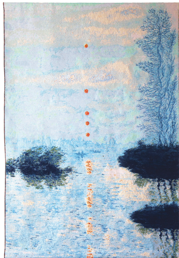
1. Laurence Aëgerter, Soleils couchants sur la Seine à Lavacourt , 2020. Tapisserie jacquard en fils mixtes dont mohair et lurex, 260x165 cm.

Mathilde Beaujard, responsable communication et presse 01 53 43 40 14 - mathilde.beaujard@paris.fr