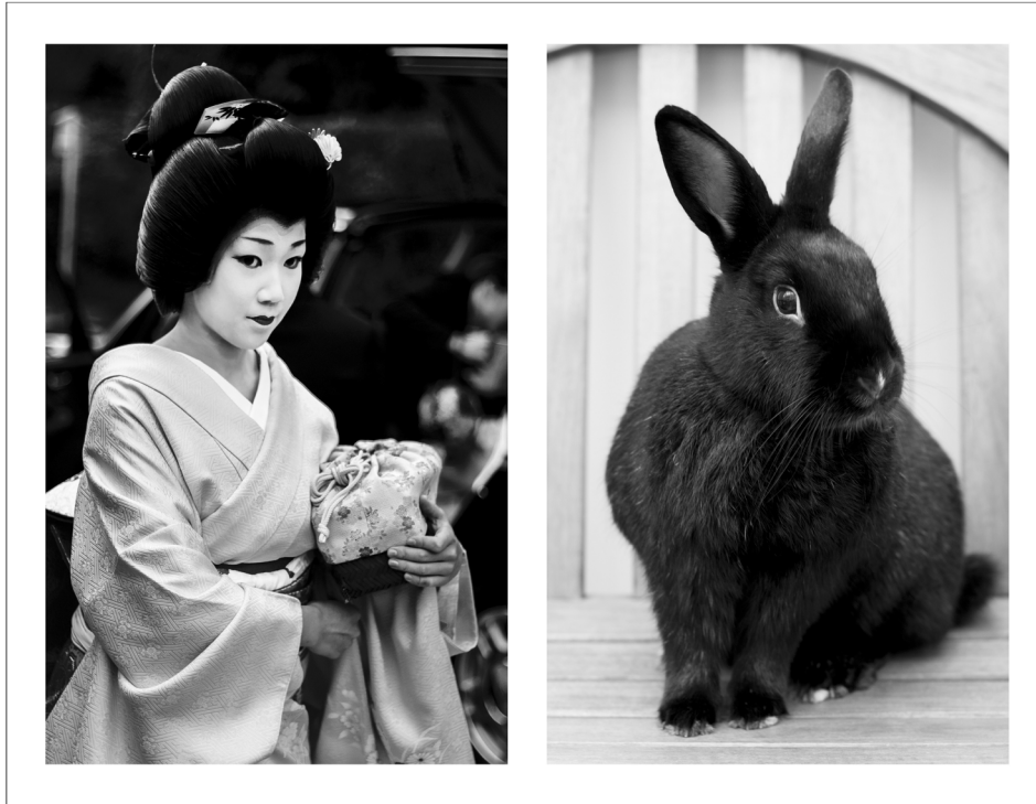
12. Laurence Aëgerter , Photographic Treatment ©, PHT #187, 2016, Tirage ultrachrome sérigraphié au parfum de rose, © Laurence Aëgerter