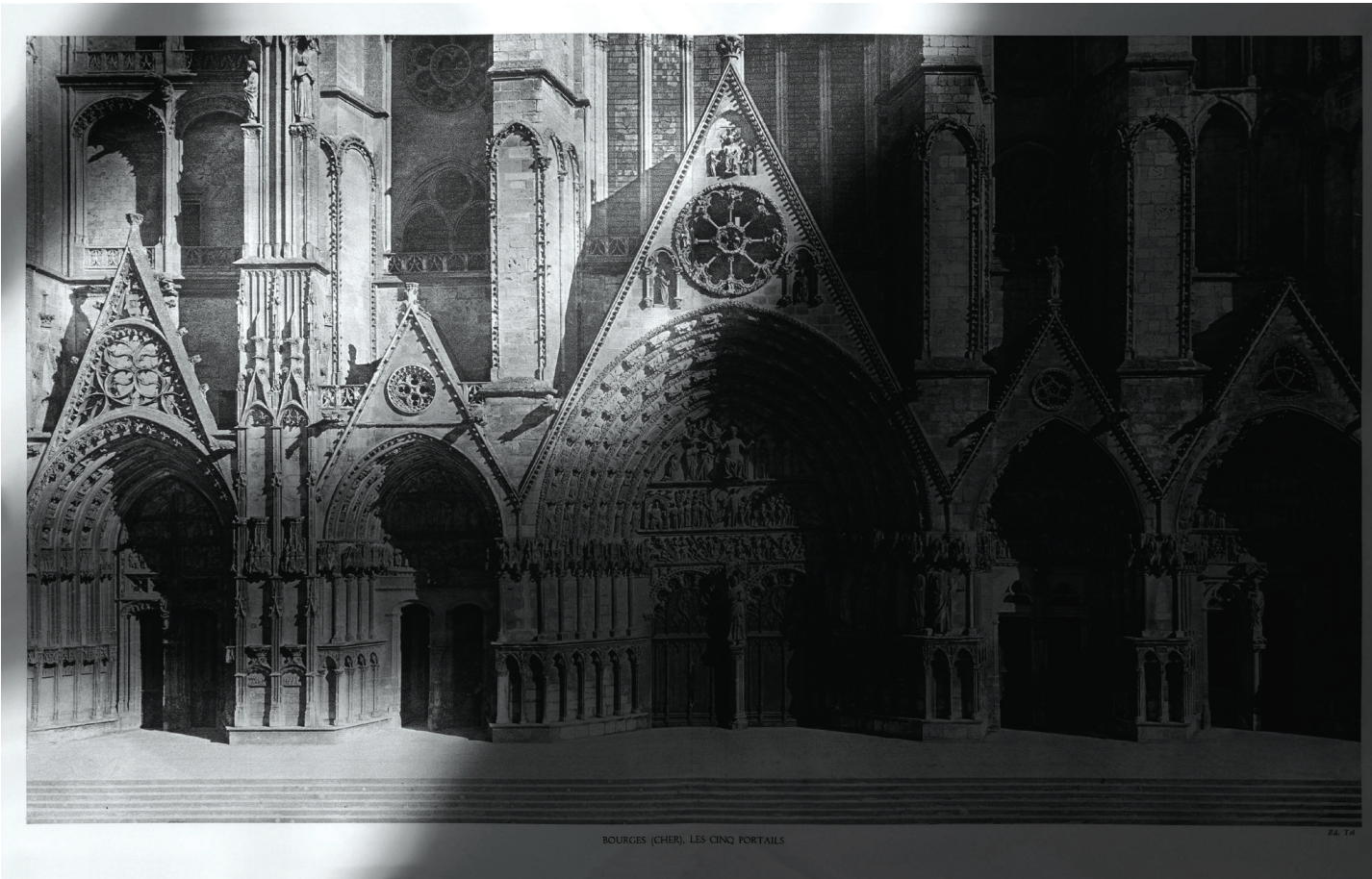
7 Laurence Aëgerter, Cathédrale 1h34' , de la série Cathédrales , 2014 Tirage archive pigmentaire sur papier FineArt Baryta, © Laurence Aëgerter

Laurence Aëgerter «Ici mieux qu'en face» - du 6 octobre 2020 au 17 janvier 2021