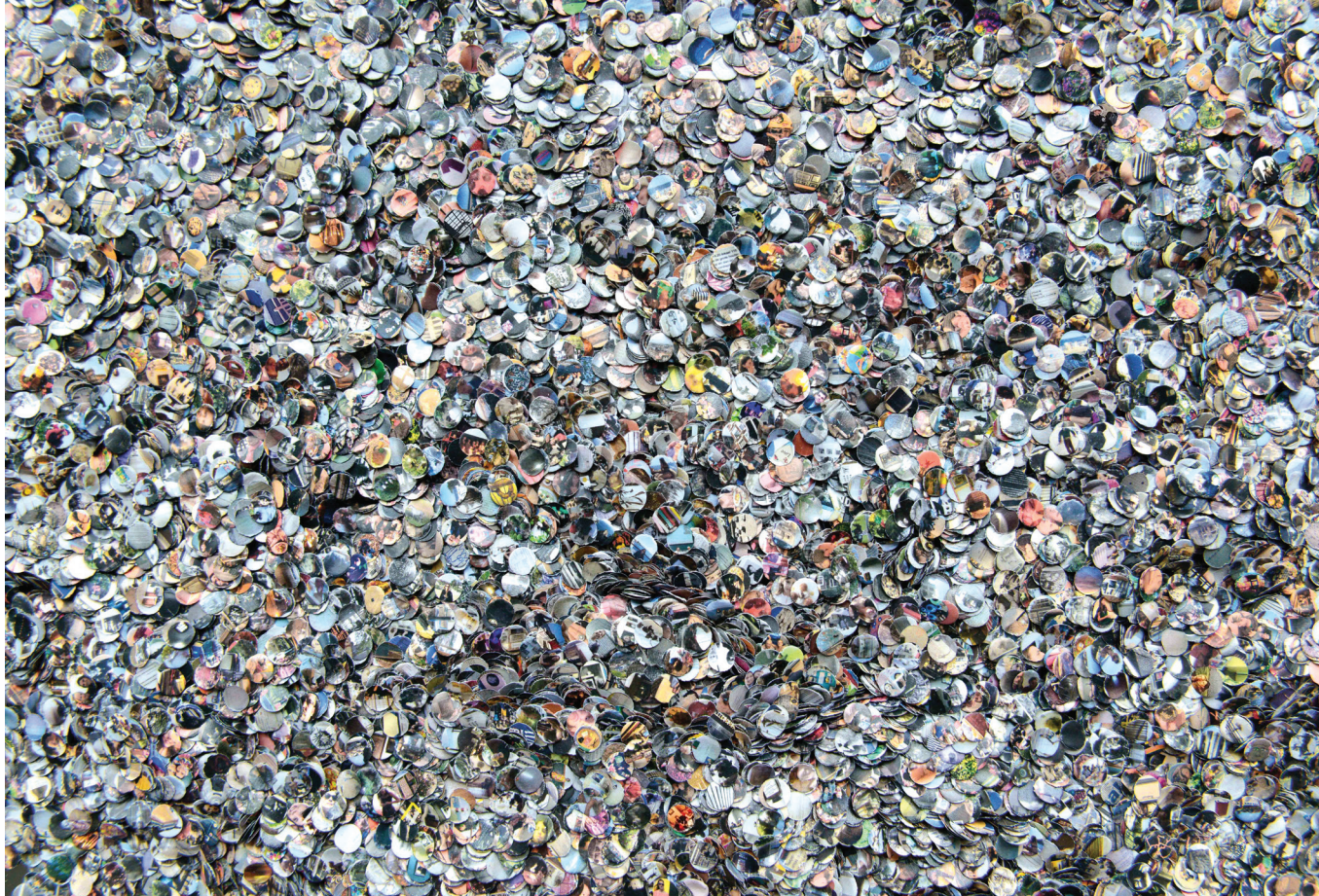
2. Laurence Aëgerter, Confetti , 2019, 58 038 confettis, imprimés en double face, © Laurence Aëgerter

Laurence Aëgerter «Ici mieux qu'en face» - du 6 octobre 2020 au 17 janvier 2021