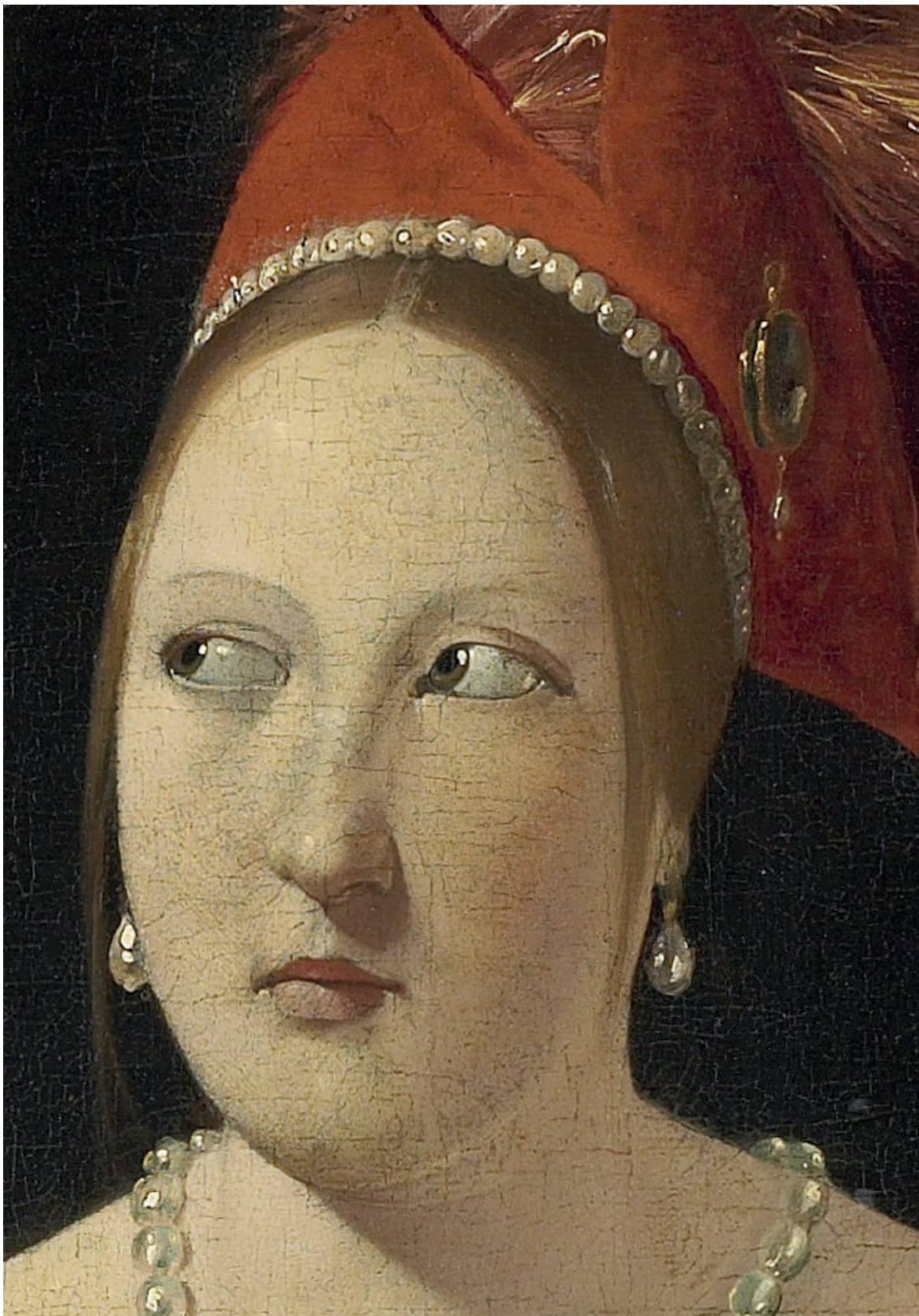
Le Tricheur (détail). H. 1,06 x L. 1,46 m. Échelle 1 : 1