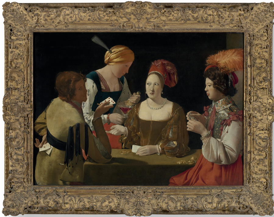
Georges DE LA TOUR (Vic-sur-Seille, 1593 – Lunéville, 1652) Le Tricheur Vers 1635 Huile sur toile H. : 1,06 m. ; L. : 1,46 m Acquis en 1972 Département des Peintures

« Mais quel tableau, que celui des Tricheurs ! Quelle “précieuse” extravagante, cette courtisane lorraine à la mode de 1630 ! Son visage comme un œuf d’autruche (...) »