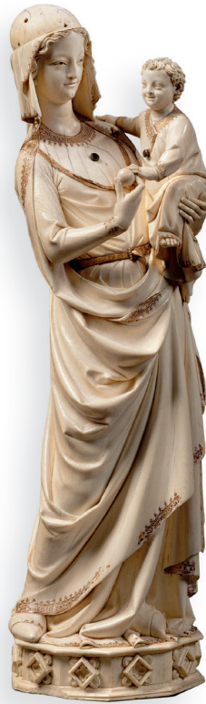
Auteur anonyme Vierge à l'Enfant Troisième quart du 13 e siècle, avant 1279 Ivoire, traces de polychromie H. : 41 cm Provient du trésor de la Sainte-Chapelle de Paris Acquis lors de la vente de la collection Soltykoff en 1861 Département des Objets d'art

« Par la Reine qui n'eut jamais d'autre couronne Que les astres, tresse d'une ineffable aumône, Et d'autre sceptre que le lys d'un vieux jardin [...] »