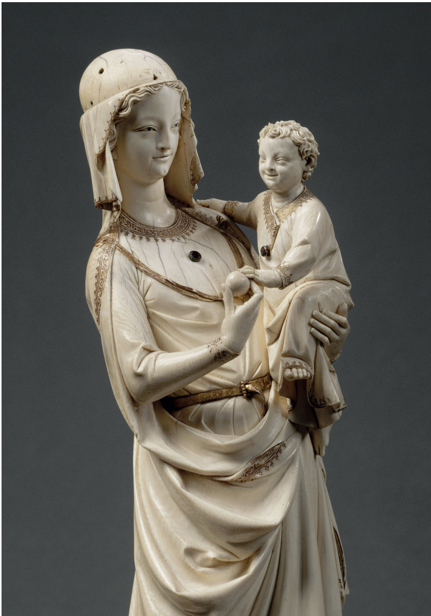
Vierge à l'Enfant (détail). H. 41 x L. 12,40 cm. Échelle : 1 : 1