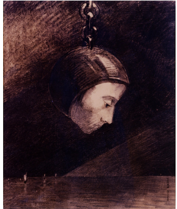
Odilon Redon, Tête suspendue par une chaîne , XIXe siècle. Fusain sur papier beige, 45 x 37 cm, Collection Prat.

Les feuilles de Gros , Géricault , et trois beaux ensembles de Ingres , de Delacroix et de Chassériau offrent un florilège des tendances esthétiques qui agitent cette période si riche. L'exposition aborde ensuite les académismes et les réalismes d'après 1850 avec les dessins de Corot , Courbet , Millet , Daumier ou encore Carpeaux , Gustave Doré et Puvis de Chavanne .