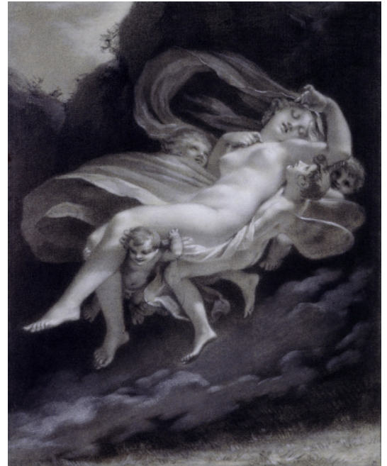
Prud'hon, Psyché enlevée par les Zéphirs , vers 1808 Pierre noire, réhautes de blanc sur papier bleu, Collection Prat.