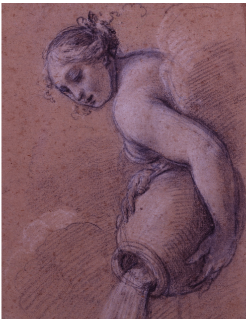
Simon Vouet, Femme tenant une urne , vers 1644. pierre noire, rehauts de blanc sur papier beige. Collection Prat

Tout au long du XVII e siècle, l'Italie, et particulièrement la Ville éternelle, attire les artistes français qui n'hésitent pas à accomplir ce long voyage. Nicolas Poussin en demeure l'exemple le plus célèbre, lui qui accomplira presque toute sa carrière à Rome. Il en sera de même pour son ami Claude Gellée dit Le Lorrain, pour qui la campagne romaine demeurera la principale source d'inspiration. Plus épisodiques, les relations avec l'Italie de François Perrier ou de Jacques Callot, qui séjourna un temps à Florence à la cour des Médicis, ont marqué à jamais l'art de ces dessinateurs.