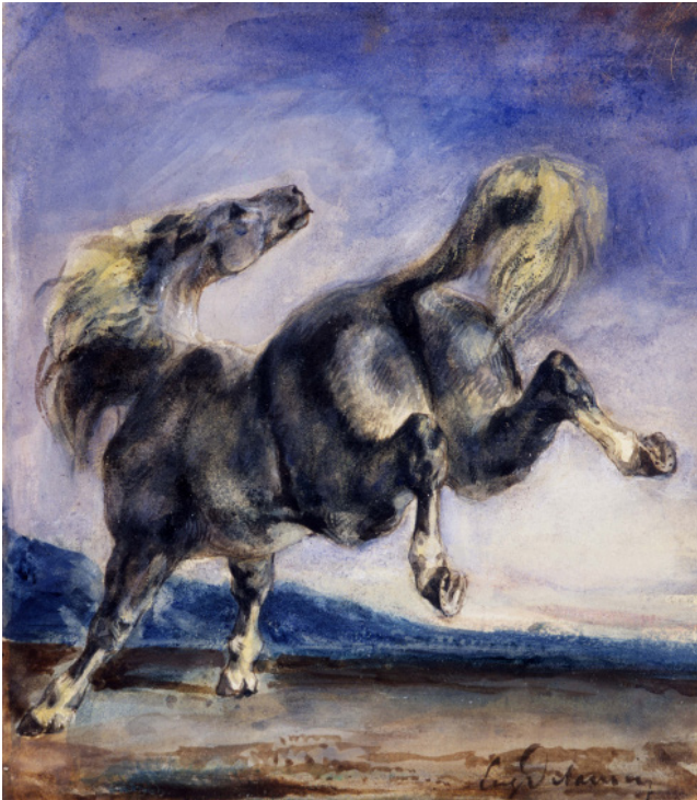
Eugène Delacroix, Cheval ruant , XIXe siècle. Aquarelle, gouache, 15,1 x 13 cm, Collection Prat.