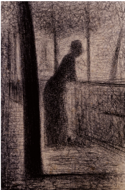
Georges Seurat, La femme accoudée à un parapet , vers 1881, Crayon Conté, 24,1 x 16 cm, Collection Prat.

La modernité graphique qui prépare les conquêtes plastiques du XX e siècle n'est pas à chercher dans l'impressionnisme pur, dont les grands maîtres du plein air (Monet, Sisley, etc.) dessinent sans véritable génie. Elle est plutôt le fait d'un Manet ou d'un Degas, qui, à leurs débuts, feront cependant référence dans leurs dessins aux grands ancêtres italiens de la Renaissance et à leurs figures idéales. Elle réside aussi dans une affirmation de la plasticité spectaculaire des formes, comme chez Rodin, tandis qu'un autre langage s'élabore en ces mêmes années à Pont-Aven autour de Gauguin, Bernard et Sérusier.