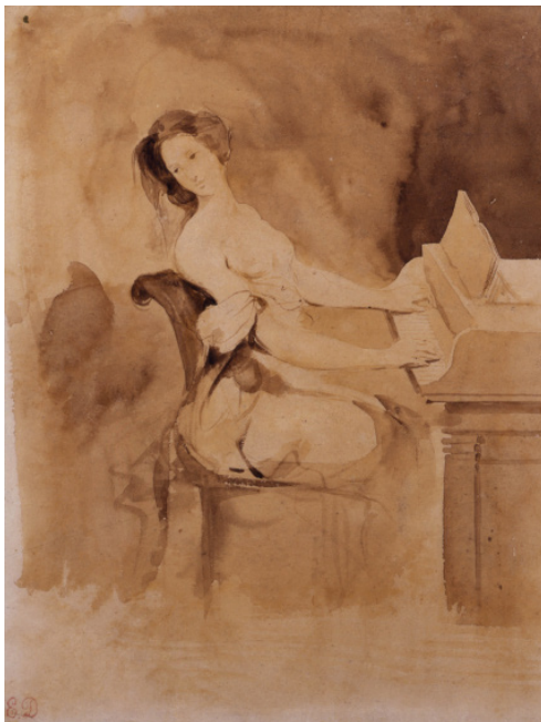
Eugène Delacroix, L'amoureuse au piano , vers 1830 Pinceau et lavis brun, 21,8 x 17,5 cm, Collection Prat.

Les oppositions classiques entre novateurs et académiques après 1850 n'ont guère lieu d'être dans le monde du dessin où la liberté inventive des uns ne contrarie en rien la pureté graphique de ceux que l'on a trop longtemps qualifiés de « pompiers ». Il n'est plus juste aujourd'hui d'opposer Jean-Baptiste Carpeaux, Jean-François Millet ou Théodore Rousseau aux décorateurs de l'Opéra-Garnier que sont Isidore Pils ou Paul Baudry, ni aux puristes comme Pierre Puvis de Chavannes, alors que certains artistes comme Thomas Couture, Camille Corot ou Gustave Courbet poursuivent un chemin à part et très personnel