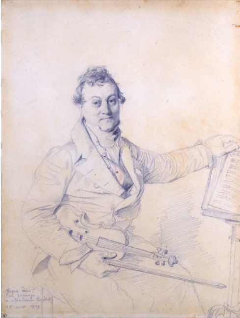
Jean Auguste Dominique Ingres, Pierre Baillot , 1829 Graphite, 36, ix 28 cm, Collection Prat

La gloire de Napoléon sera illustrée bien sûr par David, mais aussi par ses élèves comme Girodet et Gros. C'est précisément avec Gros que se manifestent les tensions entre la rigueur néoclassique et l'impulsion romantique, contradictions si violentes qu'elles le conduiront au suicide.