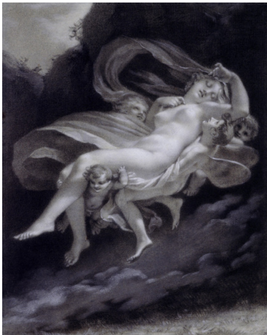
Pierre-Paul Prud'hon, Psyché enlevée par les Zéphirs , vers 1808, pierre noire, réhauts de blanc sur papier bleu, Collection Prat.