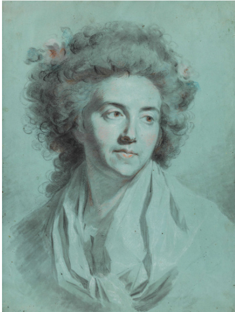
Claude Hoin, Tête de femme en buste , XVIII e siècle. Trois crayons sur papier bleu, 52 x 38 cm, Collection Prat.

C'est déjà sous le règne de Louis XV (mort en 1774) que se fait jour la réaction néoclassique, influencée par les écrits de Winckelmann et du comte de Caylus, et le regain d'intérêt pour l'Antique suscité par les fouilles de Pompéi et d'Herculanum. Les frères Challe, Desprez ou Petitot reflètent ainsi ce goût archéologique diffusé par le grand graveur romain Piranèse.