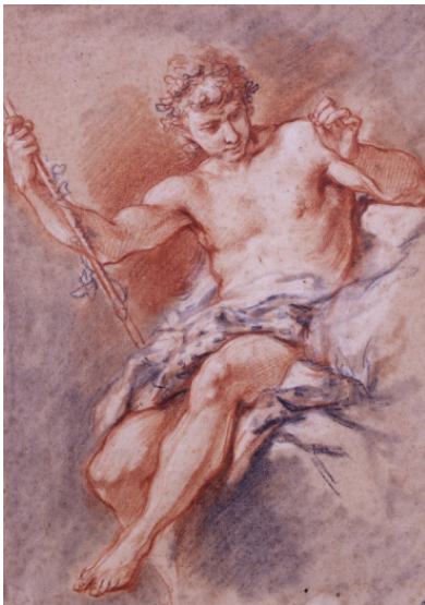
François Boucher, Bacchus , vers 1748 Trois crayons sur papier crème, 35,4 x 25,1 cm, Collection Prat.

Au temps de la Régence, l'art devient moins majestueux, plus poétique aussi. Malgré sa courte vie, Antoine Watteau demeure le représentant idéal de cette tendance, avec ses fêtes galantes imaginaires et ses incessantes évocations des progrès de l'amour. Après lui, François Boucher continuera dans cette veine, l'enrichissant de toute une iconographie mythologique à travers laquelle il célébrera les amours des dieux.