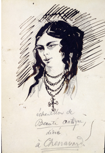
Baudelaire, Echantillon de beauté antique , plume et encre brune, graphite, 19x12,5 cm, Collection Prat.

Si Delacroix, selon le mot encore de Baudelaire, s'est voulu « un peintre littéraire », c'est aussi l'importance des rapports entre l'écrit et le dessiné qu'illustrent les œuvres d'artistes, souvent rompus à l'art de l'estampe, comme Honoré Daumier ou Rodolphe Bresdin. Des écrivains-dessinateurs, prolifiques (Victor Hugo, plus de trois mille dessins) ou rarissimes (Charles Baudelaire, à peine trente dessins), participent de la même énergie. Les rapports entre l'art et la littérature nourrissent également l'imagination d'un Gustave Moreau comme d'un Odilon Redon, que l'on considère comme les fondateurs du courant symboliste.