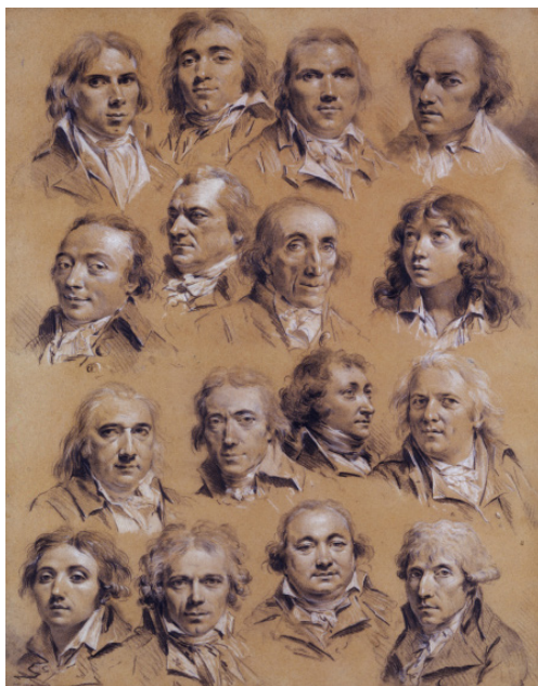
Louis Leopold Boilly, Portrait de seize hommes , vers 1798, pierre noire, réhauts de blanc sur papier beige, Collection Prat.

Autour de Jacques-Louis David se cristallise un nouvel évangile, celui de l'exemplum virtutis (exemple de courage physique ou moral) hérité des Anciens. Grands lecteurs de Plutarque et de Tacite, les jeunes rénovateurs du style, adeptes de la ligne froide et du récit héroïque, cultivent un répertoire nouveau dont leurs dessins constituent une approche essentielle. Avant même Le Serment des Horaces qui triomphe au Salon de 1785, David célèbre la vertu d'Andromaque, veuve d'Hector, le suicide exemplaire d'Artémise ou le respect par Régulus de la parole donnée. Exilé à Bruxelles après le retour définitif des Bourbons en 1815, il dessine des portraits d'un réalisme acerbe.