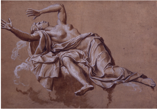
Noël Coypel, Femme projetée en arrière (La Fraude) , XVII e siècle, pierre noire, lavis brun rehauts, Collection Prat.

Le long règne de Louis XIV, dont la production artistique tend avant tout à célébrer la gloire du souverain, assure le triomphe de l'esprit classique. L'établissement de l'Académie royale de peinture et de sculpture en 1648 permet de canaliser peu à peu la création artistique dans cette direction. Charles Le Brun, premier peintre du roi, en sera jusqu'en 1690 le parfait illustrateur, en particulier au château de Versailles dont il conçoit une grande partie du décor.