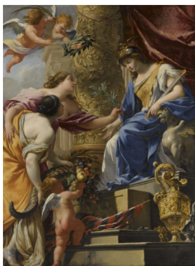
Simon Vouet, La Prudence amène la Paix et l'Abondance, 1625-1650. Paris, musée du Louvre.

Après le partage de l'empire de Charlemagne entre ses trois petits-fils, formalisé à Verdun en 843, l'Europe conserve la nostalgie de l'unité, gage de paix. La dispersion du pouvoir à l'époque féodale incite les religieux à chercher à protéger les civils par la « paix de Dieu », garantie par des sanctions spirituelles. Une fois l'autorité royale rétablie, le souverain se trouve partagé entre le devoir guerrier d'accroître son royaume, et celui de garantir la paix due à son peuple. À l'occasion des traités, les mariages entre familles princières cherchent à suppléer à l'impossible unité. Mais les héritages peuvent dégénérer en guerres « de Succession », ou favoriser une concentration de territoires suscitant la crainte d'une hégémonie, comme celle de l'empire des Habsbourg au XVI e siècle. Aussi cherche-t-on à établir la paix sur un équilibre des puissances, maintenu au besoin par la force armée et par l'action de négociateurs de plus en plus professionnels.