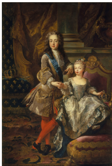
Jean-François de Troy, Portrait de Louis XV de France et l'infante d'Espagne , 1724. Florence, Palais Pitti.

L'art de la guerre ne doit pas faire oublier celui de la paix, idéal qu'il convient de célébrer sans réserve en ces temps troublés. L'exposition du Petit Palais, qui associe la Ville de Paris et le ministère des Affaires étrangères et du développement international, a pour ambition de tresser les fils d'une histoire de l'idéal de paix – une notion qui a évolué, de la nostalgie de l'ordre romain et des partisans de la paix de Dieu jusqu'aux penseurs modernes ; celle du roman national avec ses grandes dates et ses acteurs majeurs, de Charlemagne à Napoléon et De Gaulle ; celle de l'émergence d'institutions supranationales garantes de l'équilibre des forces ; celle enfin d'un nouvel ordre mondial qui dépasse le cadre politique et intègre les enjeux économiques et environnementaux.