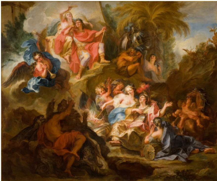
Antoine Coypel, Louis XIV se reposant dans le sein de la Gloire, après la paix de Nimègue 1678, 1681 .

La dernière partie , après un rappel du rôle des penseurs de la paix depuis le XVII e siècle, évoque l'émergence de l'opinion publique, les moments de paix illusoire (l'entre-deux guerres, la Société des Nations), le droit des peuples et la décolonisation, l'ONU puis, pour clore l'exposition et couvrir la période la plus récente, l'interdépendance irréversible de l'humanité : l'équilibre de la terreur nucléaire, les questions climatiques, la gouvernance mondiale. Cette dernière section rassemble des œuvres des XIX e et XX e siècles : un corpus important d'affiches de 1914 aux années 1970, des caricatures de Daumier entre autres, la terrible Apothéose de la guerre (1871) de Vassili Verechtchaguine (Moscou, galerie Trétiakov), des œuvres de Monet ( La Rue Montorgueil ), Picasso ( La Colombe de la Paix ), mais aussi des objets historiques comme le bureau de la signature du traité de Versailles (œuvre de Charles Cressent)... Des documents audiovisuels (archives, interviews réalisés spécifiquement pour l'exposition) donneront la parole aux politiques, spécialistes des questions diplomatiques et permettront d'ouvrir sur les questions d'actualité.