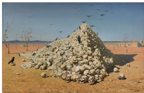
Vassili Verechtchaguine, Apothéose de la guerre , 1871. Galerie Trétiakov, Moscou

Ces documents emblématiques de l'histoire de France, conservés dans les archives du ministère des Affaires étrangères, sont présentés pour leur valeur historique mais aussi pour leur beauté exceptionnelle. La salle dévoile des correspondances échangées avec les monarques et chefs d'État des différents pays du monde, les lettres de créance des ambassadeurs étrangers ainsi que les traités conclus par la France et leurs instruments de ratification. Rédigés selon des règles protocolaires, les actes diplomatiques sont de véritables objets d'art comme en témoignent leurs calligraphies, leurs enluminures et leurs sceaux. Présentés dans un ordre chronologique, avec le souci de mettre en avant le roman national, ces trésors de la diplomatie constituent des souvenirs forts de notre mémoire collective.