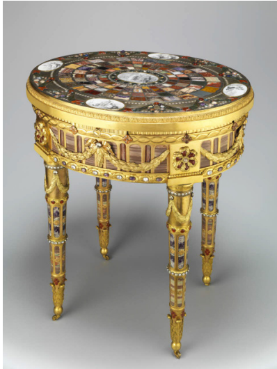
Johan-Christian Neuber, Table de Teschen , 1779. Musée du Louvre

historiques particuliers, comme la paix de Ryswick (1697) peinte par François Marot ou le traité de Rastadt (1714) mis en scène par Paolo de Matteis. Mais quelle que soit la séduction du pinceau, ces allégories de la Paix se définissent face à celles de la Guerre et symbolisent davantage le triomphe des vainqueurs qu'elles ne glorifient l'équilibre des puissances.