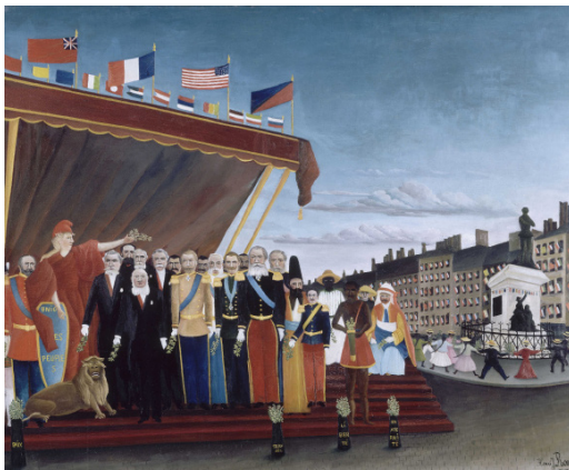
Henri Rousseau dit Le Douanier Rousseau, Les représentants des puissances étrangères venant saluer la République en signe de paix , 1907. Musée Picasso.

À partir du XVI e siècle, les souverains limitent leurs déplacements et renoncent peu à peu aux rencontres personnelles au sommet. On commence à distinguer la représentation - réservée aux princes et hauts dignitaires - des aspects techniques et juridiques, domaine des conseillers, également rédacteurs des textes. Aux XVII e et XVIII e siècles, le monde de la négociation se diversifie et se professionnalise, comme en témoignent de nombreux recueils pratiques rédigés par d'anciens ambassadeurs. C'est le moment où le ministre Colbert de Torcy tente la création d'une première école de formation à la diplomatie. Être à l'image du roi implique une attention scrupuleuse aux questions de cérémonial, en particulier lors des réceptions et des échanges de cadeaux diplomatiques, destinés au souverain, à sa famille et à ses représentants. Le diplomate doit être aussi un observateur vigilant - «espion honorable», selon l'ambassadeur Abraham de Wicquefort - qui informe discrètement son ministre au moyen de dépêches régulières et chiffrées.