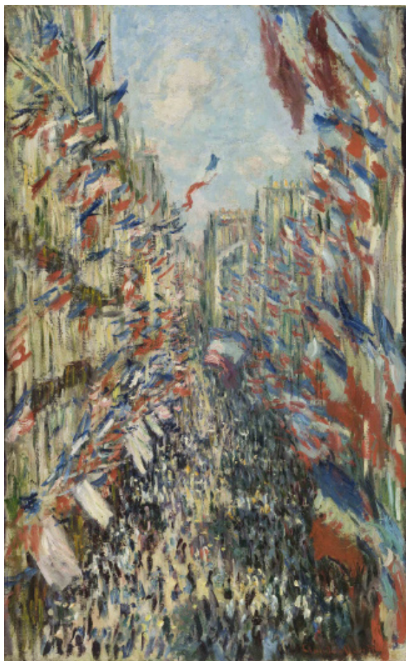
Claude Monet, La Rue Montorgueil à Paris. Fête du 30 juin 1878, 1878.

Avec le soutien de la Banque Transatlantique