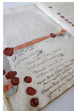
Traité de paix avec l'Empire, dit « traité de Westphalie ». Munster, 24 octobre 1648.