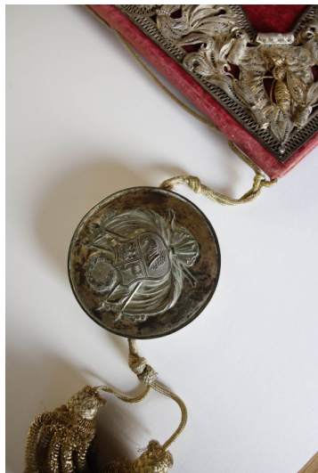
Ratification péruvienne du traité d'amitié, de commerce et de navigation entre la France et le Pérou du 9 mars 1861. Lima, 23 mai 1861.

la photographie et la télévision des incessantes négociations en cours dans la capitale contribue à universaliser l'image de Paris comme haut-lieu de la diplomatie.