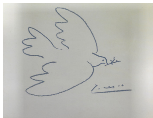
Pablo Picasso, Colombe de la paix , 1950. Musée d'art moderne de la Ville de Paris. © Succession Picasso 2016

Autre temps fort de l'exposition, la « chambre des trésors » qui dévoile ensuite un florilège de documents diplomatiques choisis pour leur exemplarité ou pour leur somptuosité.