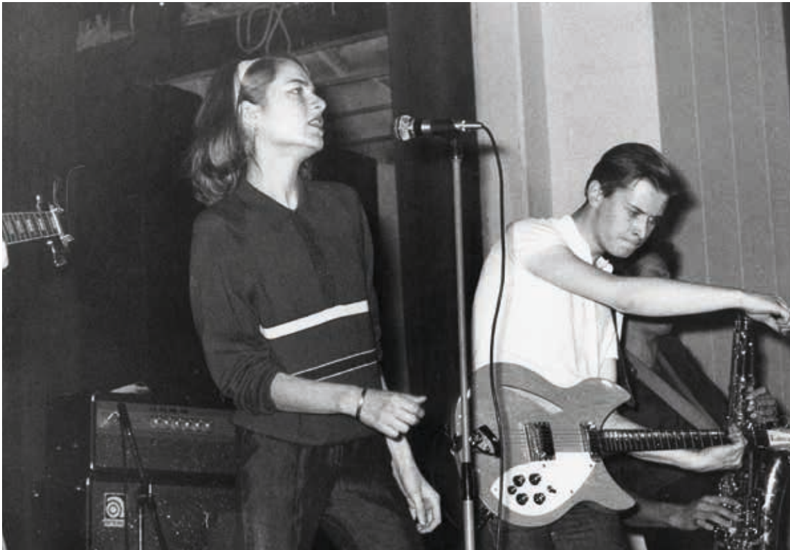
■ Stinky Toys, 1979 □ Pascal Carqueville