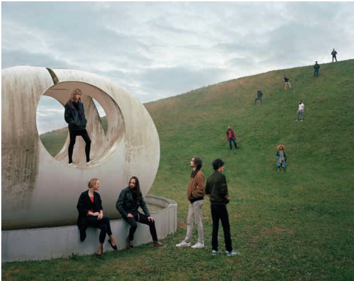
■ Moodoïd, 2014 □ Fiona Torre