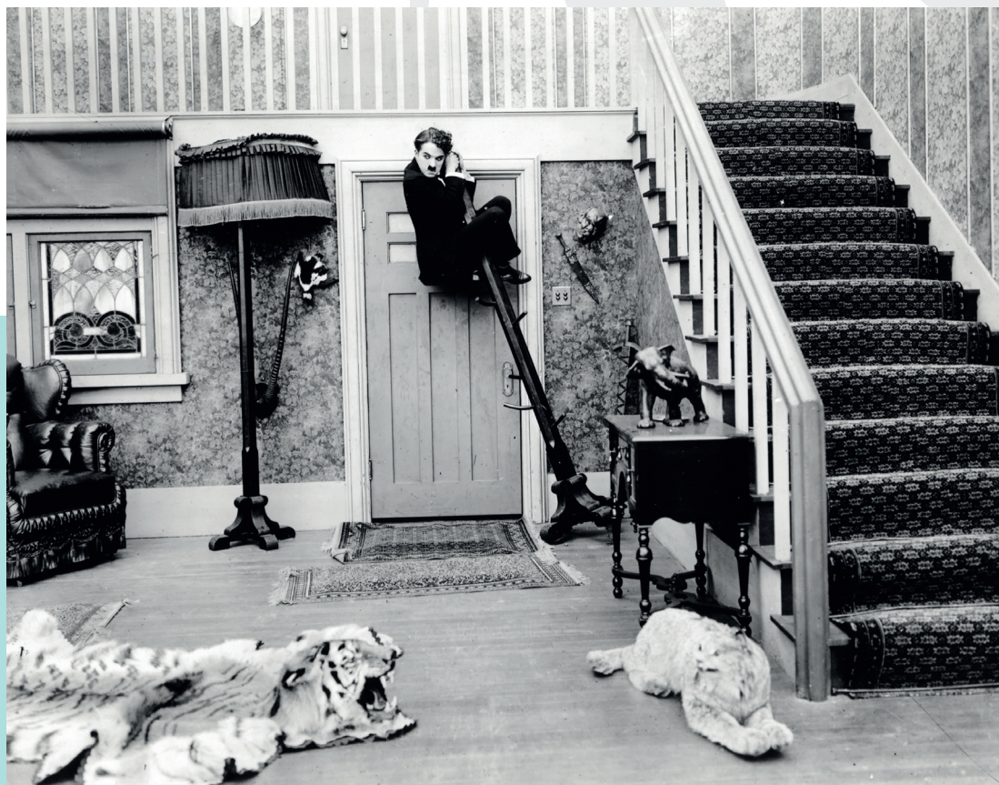
Charlot rentre tard , 1916

Dans ses premiers films, l'humour est féroce, mais la cruauté s'estompe peu à peu et le vagabond se nimbe d'un halo de poésie. Chaplin impose la dimension musicale de son personnage comme ressort comique et poétique. La drôlerie tient dans ce corps en mouvement, chorégraphié comme celui d'un danseur, parfaitement accordé au rythme du montage ; un corps constamment en équilibre, comme mû par des forces contraires, en action-réaction avec le monde qui l'entoure. Cette silhouette au langage universel imprègne l'imaginaire du public comme des artistes d'avant-garde, en tant qu'incarnation d'un art en mouvement.