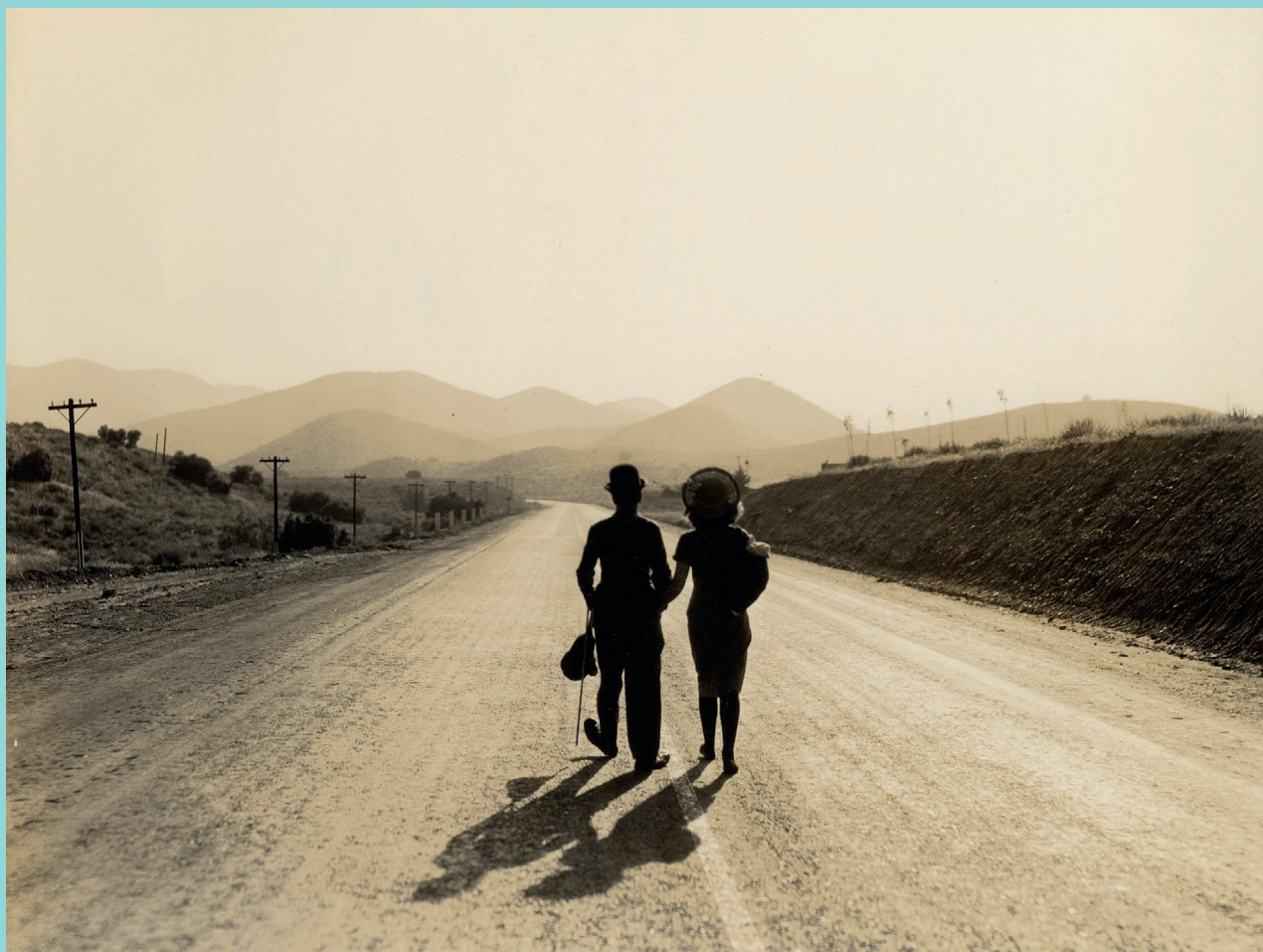
Les Temps modernes , 1936 © Roy Export Co Ltd