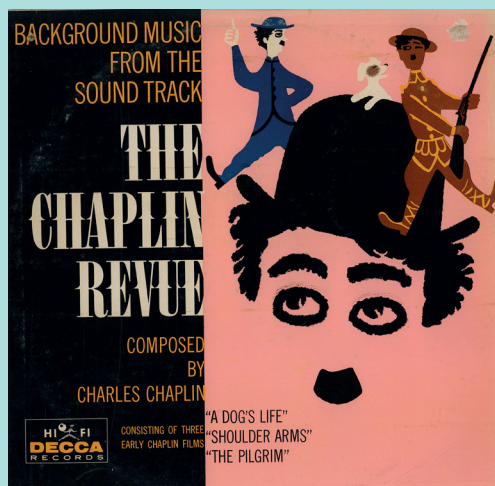
Pochette de disque de la bande originale de La Revue de Charlot , Decca, 1960