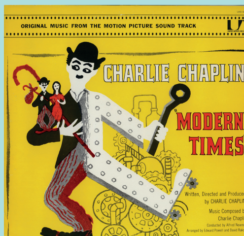
Pochette de disque de la bande originale des Temps modernes , United Artists Records, 1959