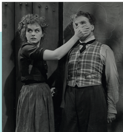
Scène du Dictateur : Hannah empêche le barbier de parler, vers 1939-1940