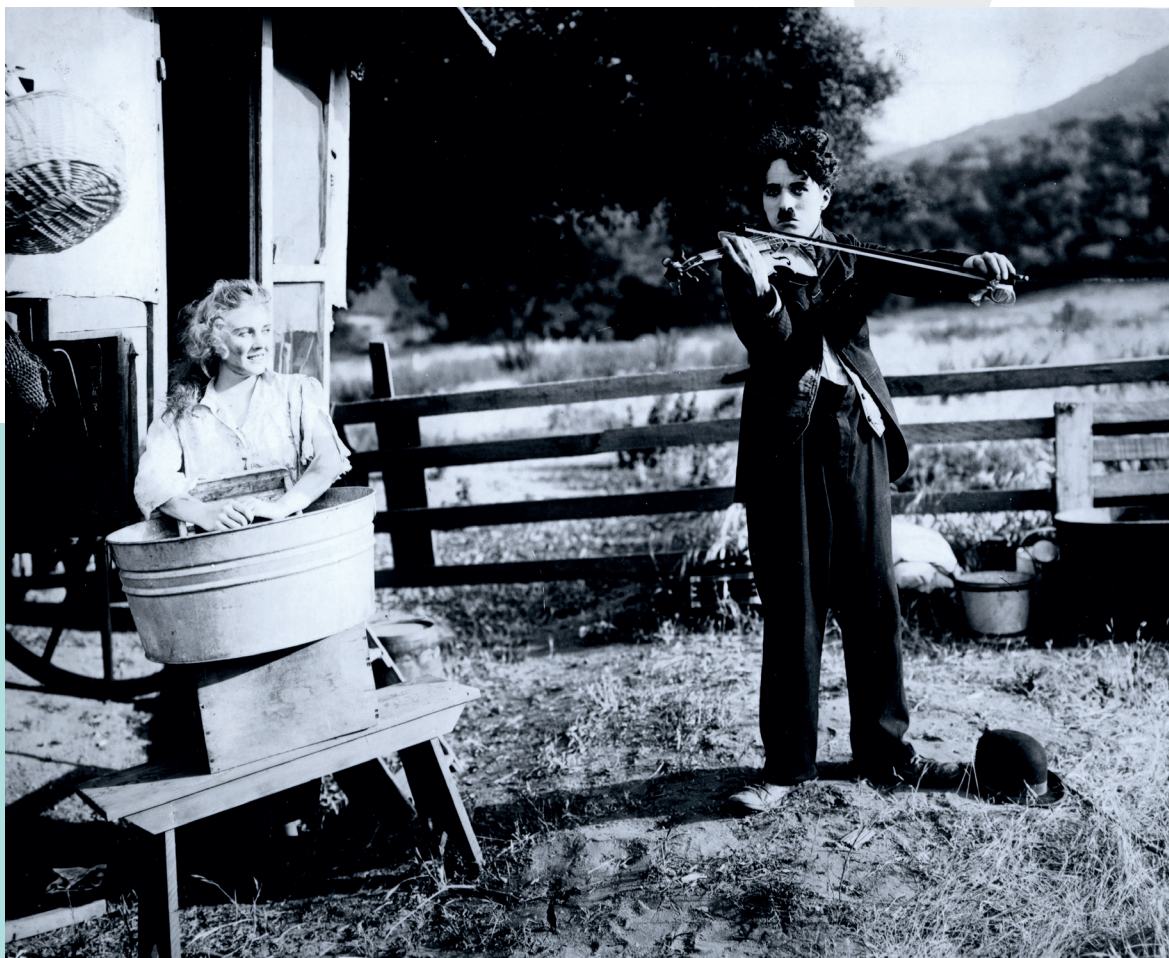
Chaplin avec Edna Purviance dans Charlot musicien , 1916

À partir de 1918, Chaplin accorde la plus grande attention à l'accompagnement musical lors de la première du film. Il joue aussi sur l'évocation du bruit ou de la musique pour nouer une intrigue ou construire un gag ( Charlot cambrioleur ou Une idylle aux champs ) : à défaut de maîtriser le son, Chaplin en fait un motif à l'écran.