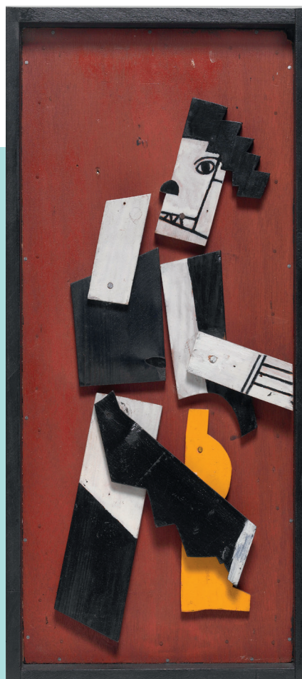
Charlot cubiste de Fernand Léger, 1924 Centre Pompidou, MNAM-CCI © Adagp, Paris, 2019