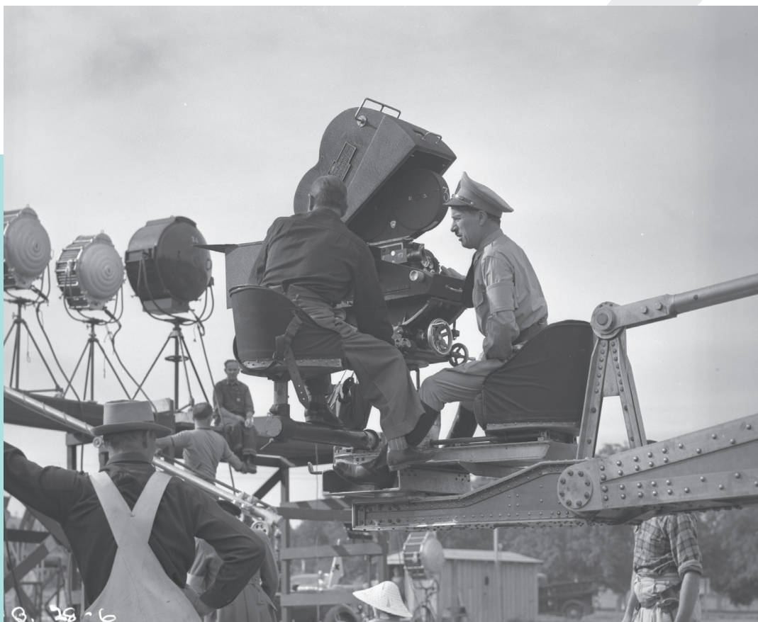
Chaplin derrière la caméra pendant le tournage du Dictateur, vers 1939-1940

Depuis les petits films d'une bobine des années 1910 jusqu'aux longs métrages sonores de la fin de sa carrière, Chaplin invente son métier de réalisateur en même temps que le cinéma se professionnalise. Il commence à travailler avec une caméra à manivelle puis se tourne vers une machine plus perfectionnée avec plusieurs objectifs et un magasin à pellicule. Avec l'arrivée du son sur les plateaux, il faut insonoriser les caméras en les enfermant dans un caisson isolant : Chaplin tourne ainsi Le Dictateur avec une caméra Mitchell NC accompagnée d'un blimp.