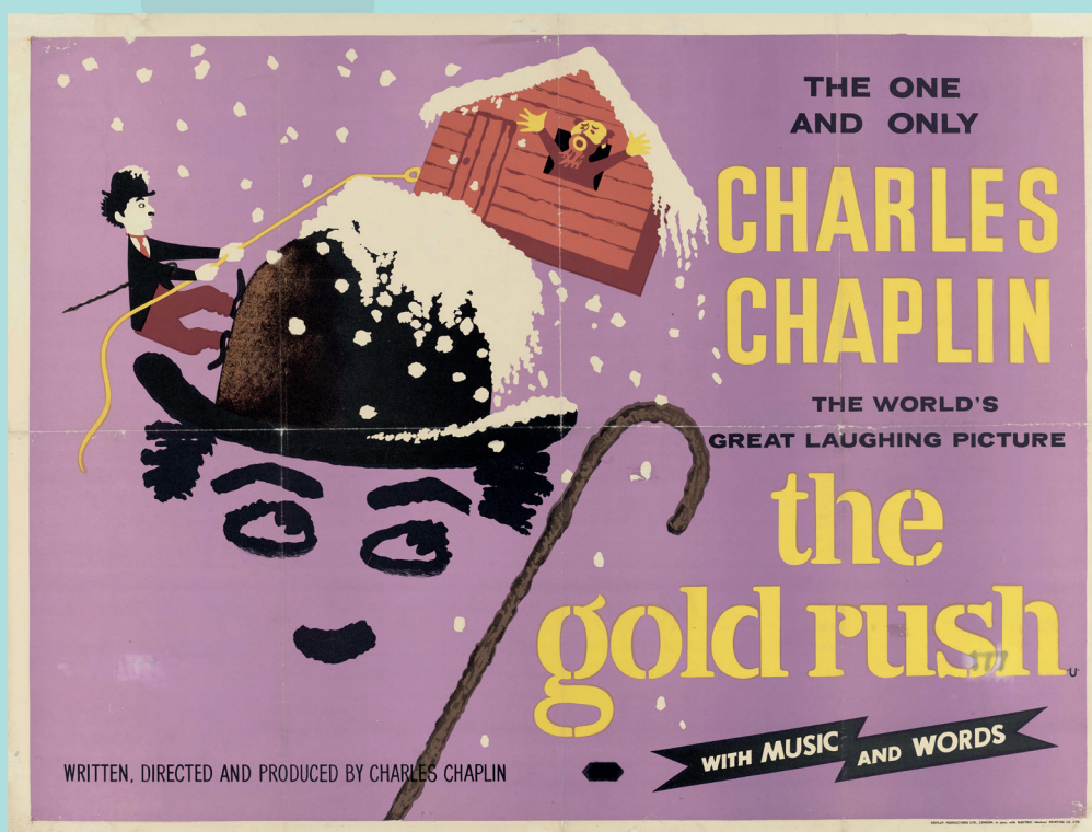
Affiche pour la ressortie de La Ruée vers l'or au Royaume-Uni, années 1950 © Léo Kouper