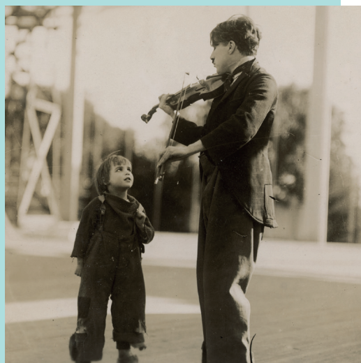
Chaplin avec Jackie Coogan pendant le tournage du Kid, vers 1920-1921