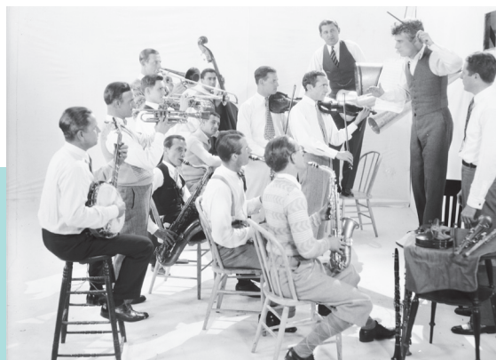
Chaplin en répétition avec l'orchestre d'Abe Lyman, 1925

En 1942, Chaplin choisit de ressortir le film, en y ajoutant une bande sonore avec narration et musique originale. Il supprime les intertitres, modifie le montage et compose des mélodies qu'il adapte avec une exigence virtuose à chaque scène et chaque ambiance – des passages les plus sombres aux scènes les plus enjouées.