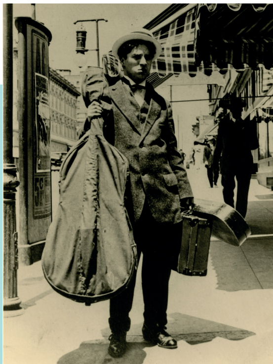
Chaplin lors de sa première tournée aux États-Unis avec la troupe de Fred Karno, juin 1911