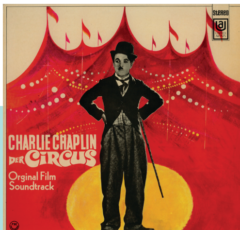
Pochette de disque de la bande originale du Cirque , United Artists Records, 1969 © Roy Export S.A.S

Malgré la variété des sources – elles puisent dans un répertoire classique à fort potentiel dramaturgique et dans des airs populaires –, ses musiques sont immédiatement reconnaissables.