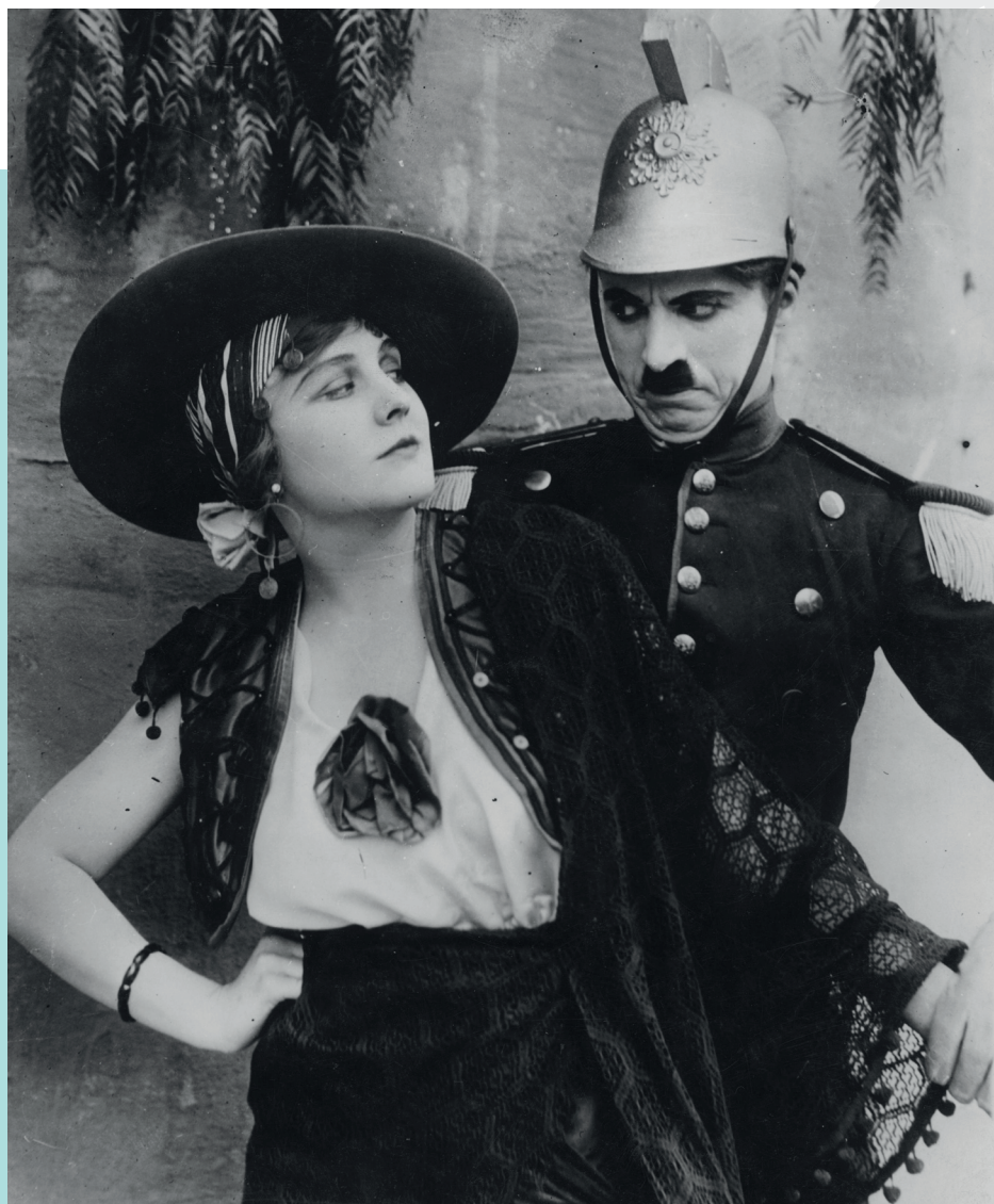
Edna Purviance dans le rôle de Carmen et Chaplin dans celui de Don José, dans Charlot joue Carmen, 1915

Le film de Chaplin, qui tourne en dérision celui de son concurrent, fait figure de prise de position cinématographique autant que d'exercice de style. Il est également un clin d'œil au théâtre populaire et musical.