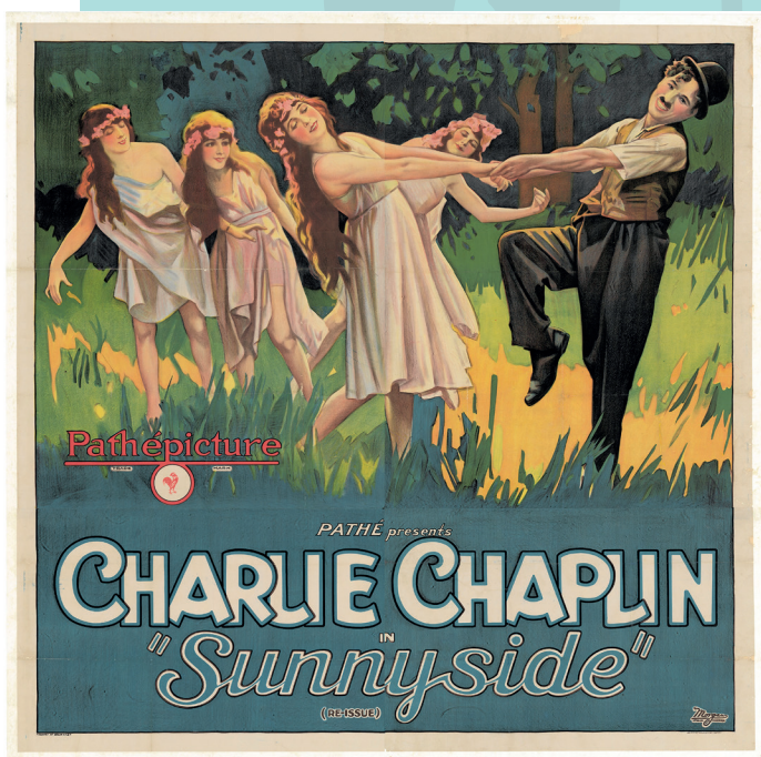
Affiche d' Une idylle aux champs , vers 1925 Collection Cinémathèque suisse

Ses sculptures du Charlot cubiste – dont trois versions subsistent aujourd'hui et deux sont présentées dans l'exposition – sont des assemblages qui permettaient à l'artiste de décomposer et recomposer le corps du vagabond pour l'animer, à la manière d'une marionnette ou d'un puzzle.