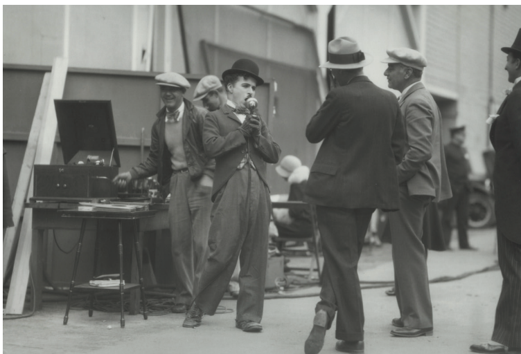
Chaplin tenant un micro sur le plateau lors du tournage des Lumières de la Ville, vers 1929-1930