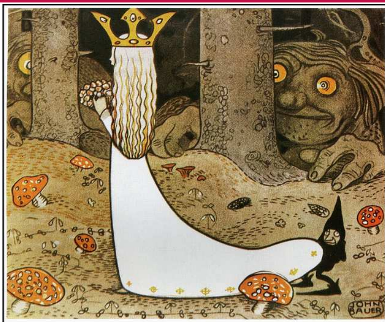
John Bauer (Peintre et illustrateur suédois, 1882-1918)