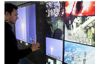
Fragments d'une histoire de la conquête spatiale