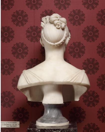
Baron Bosio François-Joseph (1768-1845), d'après Triscornia Paolo (?-vers 1832) Fredérique-Catherine de Wurtemberg reine de Westphalie (1783-1835), épouse de Jérôme Bonaparte, 1811.

Cette œuvre provient de la collection du château de Versailles et de Trianon, Versailles.