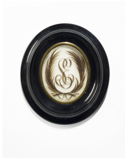
S.E. (médaillon, vers 1900) Collection Jean-Jacques Lebel

À partir du XIV e siècle, les cheveux sont donnés en gage de tendresse. Support du sentiment, ils participent au culte de l'être cher. Parallèlement, se développe l'emploi du cheveu comme relique. Imputrescible, il perpétue le souvenir des morts. En 1793, au matin de son exécution, Louis XVI adresse à ses proches des cheveux de tous les membres de sa famille. Au XIX e siècle, avec le sentimentalisme renaissant, les dames à la mode aiment à se parer de bijoux en cheveux très travaillés et ornés de 103 matériaux précieux. Yves Le Fur (dir.), Cheveux chéris, frivolités et trophées , musée du quai Branly/ Actes Sud, 2012. p. 103.