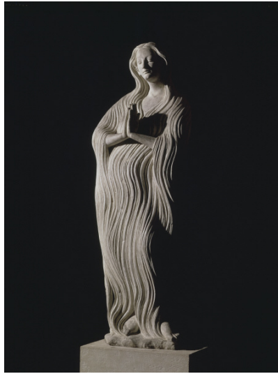
Sainte Marie-Madeleine, dite aussi Sainte Marie l'Égyptienne. Normandie ou Île-de-France, 1311-1313.

Les cheveux, parure de la séductrice Marie de Magdala, vont se transformer, après sa conversion, en bure de pénitente. Comme le voile des épouses, ses cheveux la recouvrent de la tête jusqu'aux pieds.