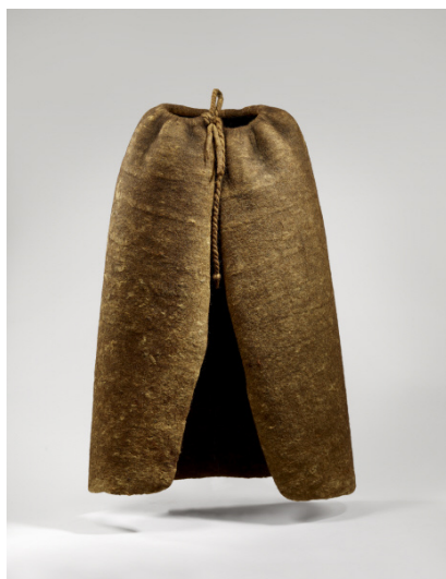
Cape, 70.2011.6.1 population Yi, province du Yunnan, Chine, Asie Début XX e siècle Feutre en laine de yack et de mouton, cheveux

Ces capes en feutre ont été faites à partir de laine de mouton, de laine de yack et de cheveux humains. Elles étaient fabriquées dans les régions froides du Sichuan par la société yi. Plusieurs fois par jour, les femmes brosaient leur épaisse chevelure et apportaient au maître les cheveux naturellement pris au piège par leur peigne. L'utilisation des longs et soyeux cheveux de femmes permettait d'imbriquer entre elles les laines de yack et de mouton et garantissait un tissage naturel très dense qui rendait la cape presque imperméable. En portant ces capes, les hommes yi affichaient leur statut et leur richesse.