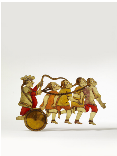
Figure d'ombres : quatre hommes tirés par les cheveux par un personnage sur un char 70.2011.23.11, fin XIX e siècle, Turquie