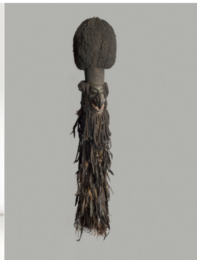
Masque 71.1893.21.17 XIX e siècle, Nouvelle-Calédonie