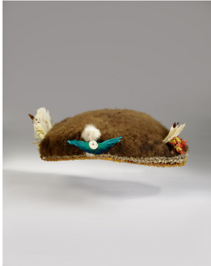
Coiffe, 72.1993.1.22, Cheveux, gorgeret de paradisiens, plumes, laine rouge, coquillage, papillote de bonbon Big Boy, plastique orange, pétales, feuilles village de Tari, Océanie