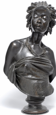
Charles Cordier (1827-1905), Buste en bronze d'une femme noire , 1851