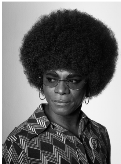
Samuel Fosso, Photographie tirée de la série « African Spirits », 2008 Samuel Fosso © musée du quai Branly

La forme, l'abondance, la couleur de la chevelure peuvent constituer des éléments de reconnaissance immédiate, quelquefois utilisés seuls pour représenter un individu, ainsi dans la caricature de politiques, d'acteurs... Jouant à la fois de la gestuelle de moments particuliers des personnages qu'il interprète, Samuel Fosso utilise aussi cet aspect, le cas le plus caractéristique étant certainement celui d'Angela Davis.