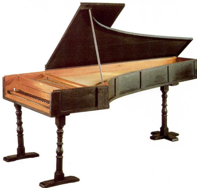
Un piano-forte de Cristofori (autour de 1720)