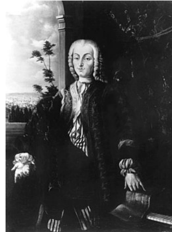
Portrait de Bartolomeo Cristofori, 1726, artiste inconnu

* c'est un petit ergot qui vient pincer la corde.