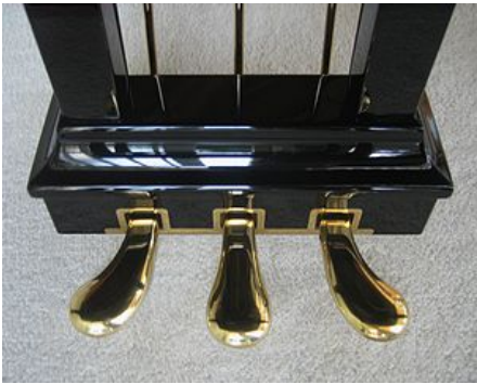
Les pédales d'un piano à queue

Le pianiste utilise ses pieds pour actionner 3 pédales :