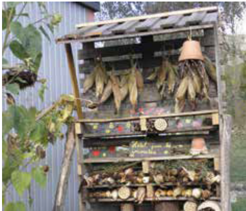
Un refuge pour les insectes construit par des élèves de l'école de Coucy le Château (02).