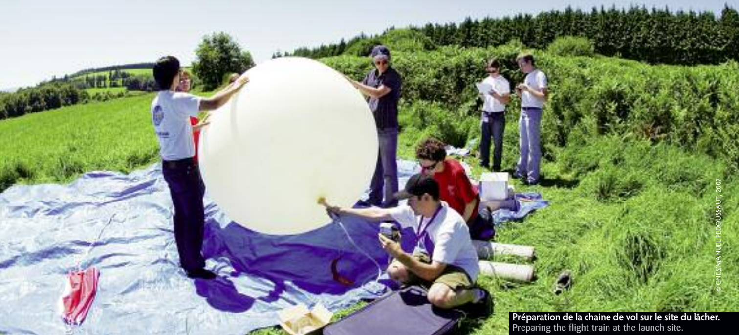
Préparation de la chaîne de vol sur le site du lâcher. Preparing the flight train at the launch site.