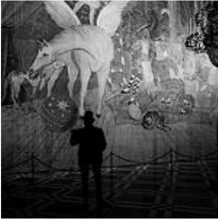
Rideau de scène du ballet Parade créé en 1917, Pablo Picasso - Béatrice BDM, 2017 - Creative commons

« Il est résulté dans Parade , une sorte de sur-réalisme où je vois le point de départ d'une série de manifestations de cet esprit nouveau qui, trouvant aujourd'hui l'occasion de se montrer, ne manquera pas de séduire l'élite et se promet de modifier de fond en comble les arts et les mœurs dans l'allégresse universelle, car le bon sens veut qu'ils soient au moins à la hauteur des progrès scientifiques et industriels ». (Guillaume Apollinaire).