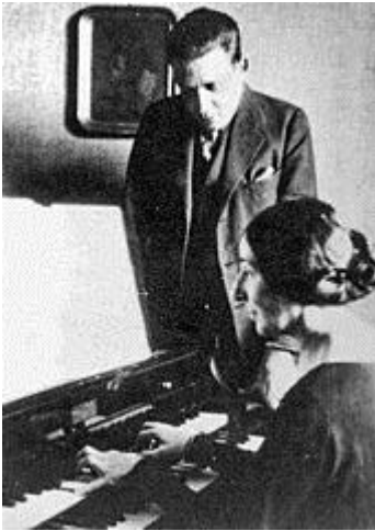
Francis Poulenc (1899-1963) et la claveciniste polonaise naturalisée française Wanda Landowska (1879-1959)

Le nom de Guillaume Apollinaire reste étroitement lié à celui de Francis Poulenc , sans doute le compositeur ayant le plus mis en musique ses poèmes. Poulenc admirait profondément Apollinaire qu'il a brièvement rencontré en 1918. Il fut marqué par le timbre de sa voix. Dès 1919, alors qu'il n'est âgé que de 20 ans, Poulenc met en musique six poèmes du Bestiaire (écrit par Baudelaire en 1911) dans un langage assez moderne et austère, encore loin du Poulenc néoclassique et mélodique que l'on connaît généralement. Le compositeur qualifiera lui-même cette œuvre de « grave » et en aucun cas d'ironique. Viendront ensuite les 4 poèmes de Guillaume Apollinaire FP 58 en 1931, pour lesquels Poulenc mettra en musique L'anguille , La carte Postale , Avant le cinéma et 1904 .