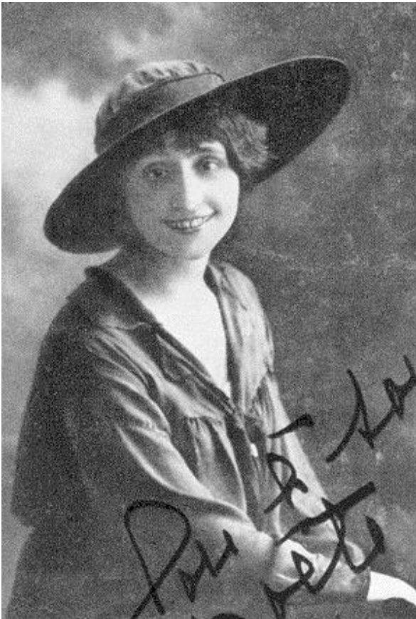
Photographie de Louise de Coligny-Châtillon, auteur inconnu (avant 1919) - [Public domain], via Wikimedia Commons

Une femme divorcée et libre de mœurs, qu'il rebaptise « Lou, et dont il tombe éperdument amoureux. Cette jeune femme légère mais de bonne famille lui inspire ses plus beaux poèmes d'amour.