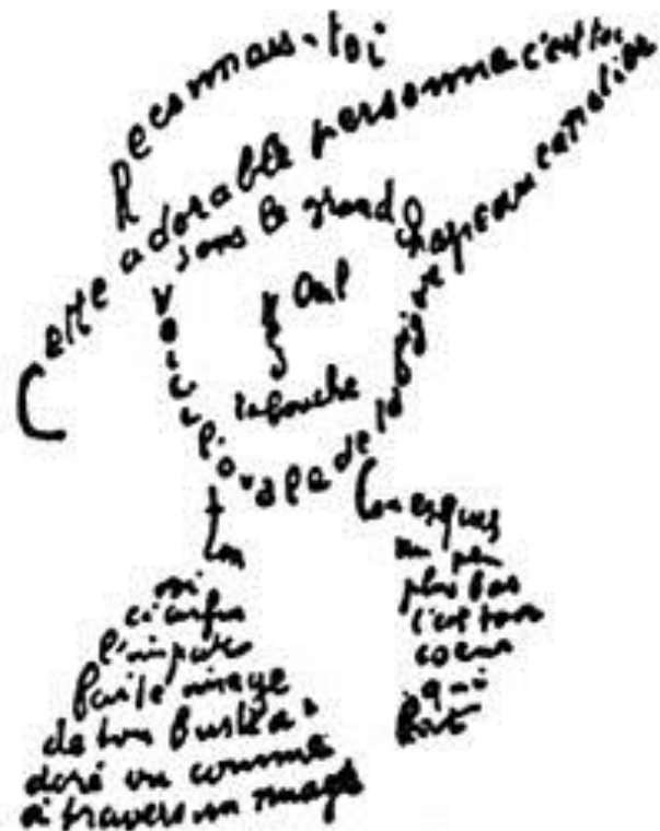
... et le calligramme d'Apollinaire