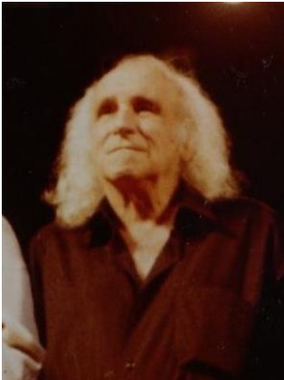
Léo Ferré en 1992 - Par Paul kiujcom (File:Alain Meilland Olympia 1992.jpg (cropped)) [Public domain], via Wikimedia Commons

La chanson du mal-aimé (1953), Léo Ferré, oratorio : http://www.youtube.com/watch?v=2zgL3TRGXWA